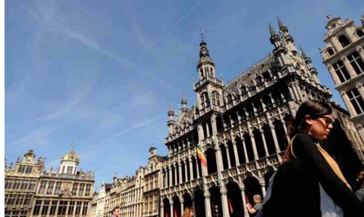
Nella foto, a sinistra e sotto la Grande Place