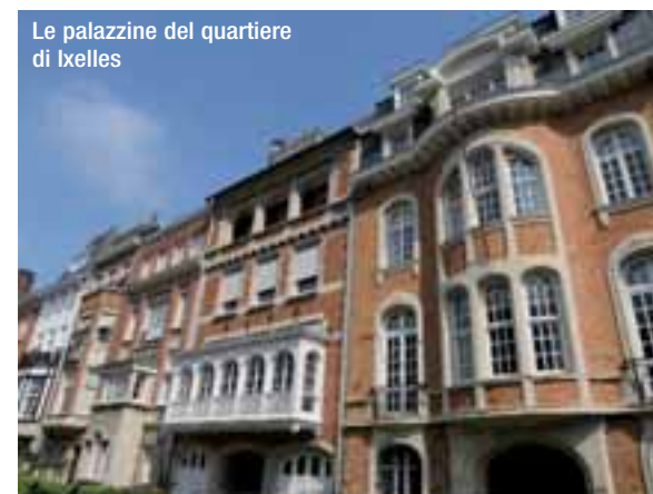
Le palazzine del quartiere di Ixelles

il parco di Woluwé, edifici liberty e – verso la fine del percorso – la foresta di Soignes, così verde e serrata che sembra quella di Robin Hood. Di periferia – almeno nel senso che attribuiamo noi alla parola periferia – nessuna traccia. L'approdo finale lascia senza parole: una piccola Versailles col suo grande parco, specchi d'acqua e tulipani, manti erbosi curati come un campo da golf dove sdraiarsi beati, un 'bello diffuso' dove la mano dell'uomo e la natura si integrano senza soluzione di continuità. All'interno della palazzina principale – intorno alla quale si aggirano i grandi elefanti in legno dell'artista Andries Botha – la più grande collezione di oggetti e reperti africani d'Europa. Ecco, la vera anima di Bruxelles si coglie attraverso