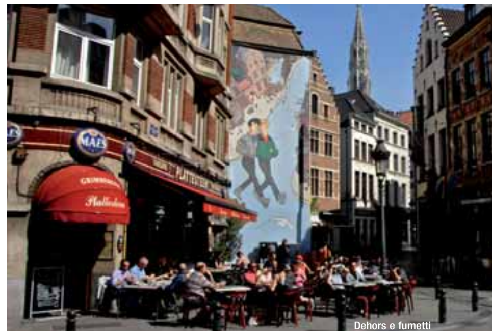
Dehors e fumetti