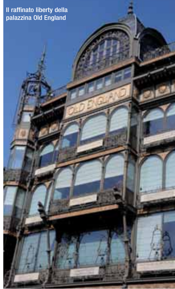
Il raffinato liberty della palazzina Old England

trasformazione, abitata da funzionari e manifestanti, operai e gru, macerie e trivelle, dal nuovo che è già vecchio e dal futuro che cresce a vista d'occhio. Blindata e funzionale crescerà ancora perché – come si ironizza nei suoi corridoi – « Per scrivere le leggi sul formaggio oggi servono 10 mila parole, mentre per fondare l'Europa unita ne bastarono meno della metà... ». Nona: il museo Magritte. È la new entry tra i grandi musei della capitale: il sofisticato spazio dedicato al maestro del surrealismo (rue de la Régence 3,