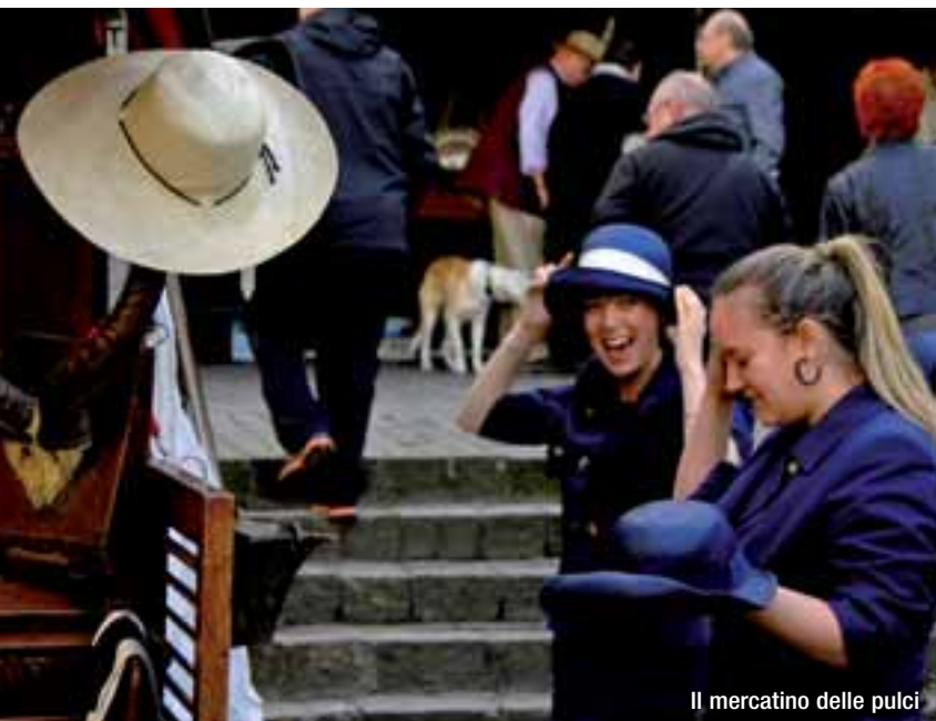
Il mercatino delle pulci