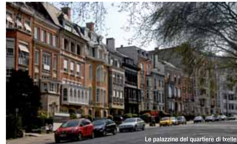
Le palazzine del quartiere di Ixelles

glioso che li circonda. Seconda: i fumetti. Qui sono considerati la 'nona arte' e fanno capolino ovunque, a partire dai 50 enormi murali che decorano il centro cittadino. I grandi maestri locali sono Francois Schuiten (autore del magistrale ciclo 'Le città oscure'), Peyo, creatore degli Schtroumpf (da noi meglio noti come Puffi) ed Hergé, ideatore di Tintin. In uno splendido ex magazzino tessile creato da Victor Horta, maestro del liberty, troviamo le Centre Belge de la Bande Dessinée (centro Belga per l'Arte del Fumetto, rue Des Sables 20, www.comicscenter.net ) e – proprio di fronte, nella medesima via – si visita un'area dedicata in esclusiva a Marc Sleen, creatore di Nero, e star indiscussa del fumetto fiammingo.