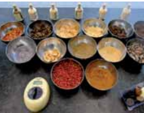
Le delizie di Zaabar