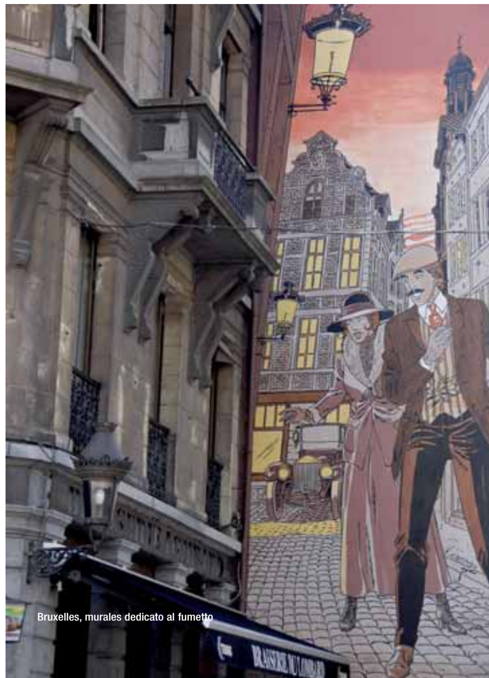
Bruxelles, murales dedicato al fumetto