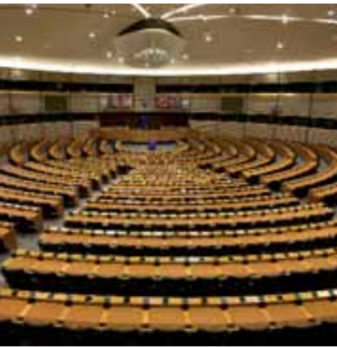
Zona UE: l'emiciclo del Parlamento, l'interno e l'esterno del palazzo, la statua raffigurante Europa rapita dal Toro