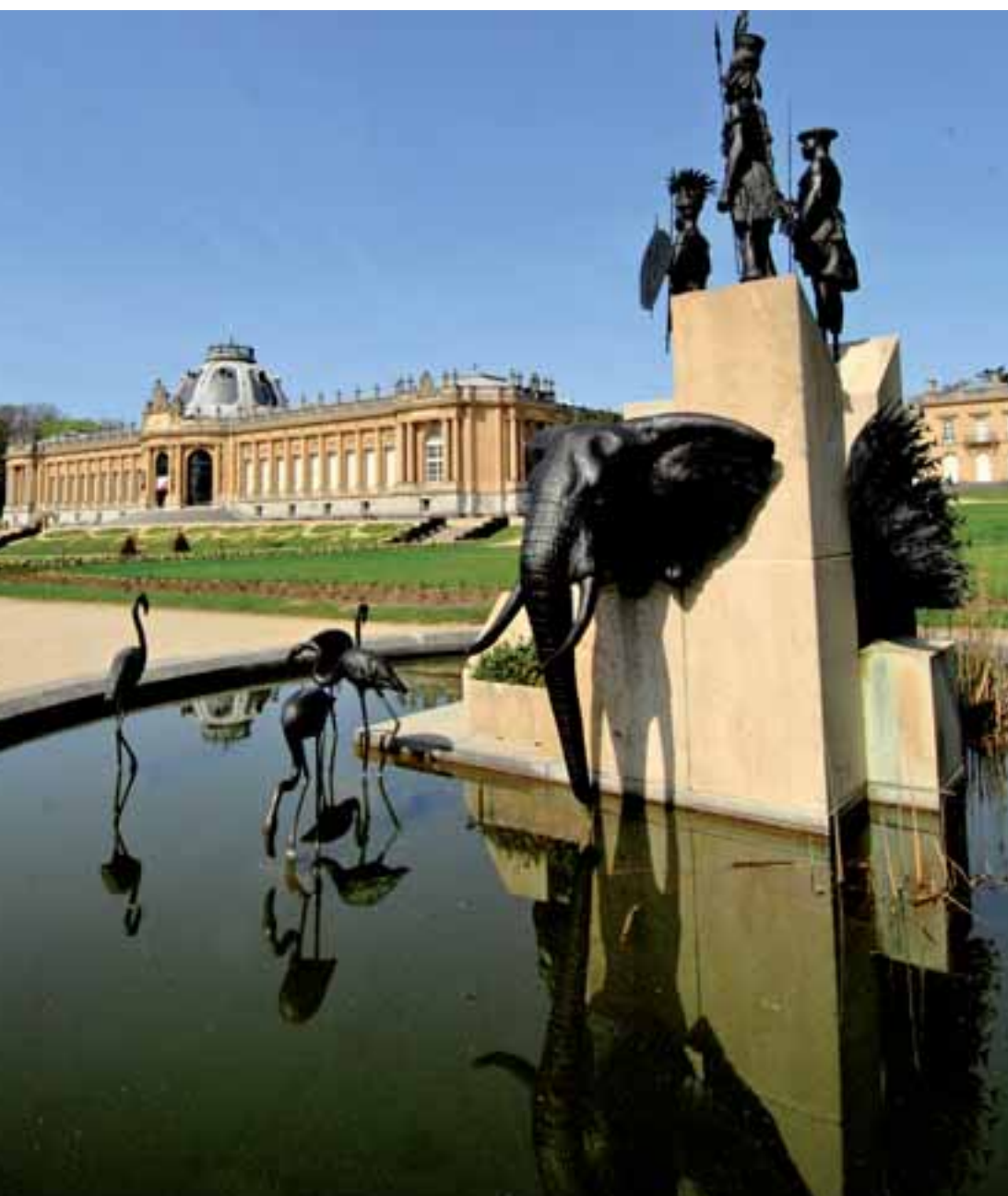
Tervuren: la statua celebrativa del fiume Congo

sempre incontrare perché non si limita all'elenco di piazze e palazzi, snocciolando nomi e date, ma va oltre: incuriosisce, commenta, coinvolge e... macina chilometri al tuo fianco. Tra i suoi suggerimenti ne abbiamo accettato uno in particolare, lasciando Bruxelles per Tervuren – cittadina fiamminga a soli 15 chilometri di distanza, sede del Museo Reale dell'Africa Centrale – seguendo una rotta che Marco ha semplicemente definito «la più bella strada d'Europa». Vero, verissimo, addirittura sorprendente. La si percorre in taxi o con lo storico tram 44, ma l'emozione non cambia perché, nell'ordine, si notano: giardini urbani, candide palazzine vittoriane, ville, ambasciate,