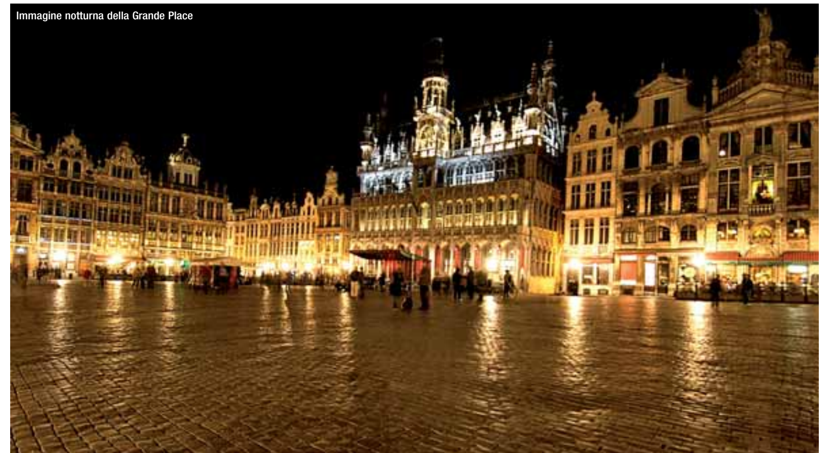
Immagine notturna della Grande Place

impone una curiosa transumanza mensile (umana ma anche cartacea, con una carovana di tir a trasportare casse sigillate zeppe di documenti) dal costo vertiginoso: 200 milioni di euro annui per un viaggio a/r che solo qualche iracundo eurodeputato britannico si sente di contestare apertamente. Bene, stabilita l'originalità dello scenario veniamo a 'dieci buone ragioni' per visitare Bruxelles. Prima: la Grande Place. Impossibile sottrarsi a questo magnete. La più sontuosa piazza d'Europa è uno scenario dorato, un teatro dove le statue osservano la platea e dove gli spettatori – se il clima lo consente – si siedono (e sdraiano...) a terra chiacchierando, leggendo, chattando o, più semplicemente, osservando il meravi-