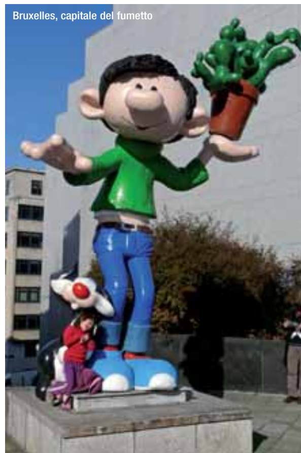
Bruxelles, capitale del fumetto