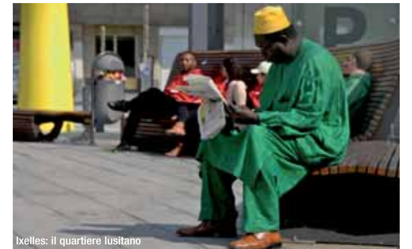
Ixelles: il quartiere lusitano