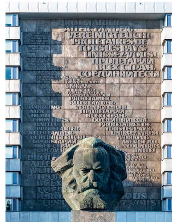
L'imponente scultura dedicata a Karl Marx, alta 13 metri con il basamento, è tuttora l'opera più conosciuta di Chemnitz. Concepita dal russo Lev Karbel ha sempre suscitato sentimenti contrastanti. Gli abitanti la chiamano amichevolmente Nischel, nel dialetto locale "testa" o "teschio"

mania Ovest e Berlino Est , capitale della DDR – e infine la nuova "grande Berlino", a riunificazione avvenuta. Nell'accezione moderna del termine, "capitale" significa anche qualcosa, di provvisorio o permanente, che celebra un particolare riconoscimento. A livello continentale, dal 1985 (merito di Melina Mercouri ), viene designata la Capitale Europea della Cultura (fino al 1999 Città Europea della Cultura); scelta dalle diverse nazioni, a turno, in modo da evitare rivalità internazionali. Nei primi vent'anni compaiono in cronologia nomi eccellenti – Amsterdam, Berlino, Parigi, Dublino, Madrid, Lisbona... – e per l'Italia: Firenze,