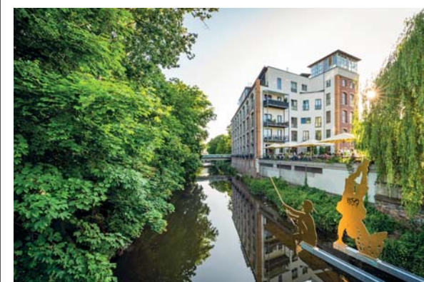
A destra, tre immagini del nostro ristorante preferito di Chemnitz: da Janssen, nel verde, di fronte al canale cittadino, si gustano ricette creative, di terra e di mare, con un impiattamento artistico e seducente. Tanta fantasia per viaggiatori alla ricerca di soluzioni originali

Berlino è una città di traiettorie, nello spazio, ma, più ancora, nei luoghi e nella storia, nelle umane vicende – desideri, drammi personali, affermazioni o disastri imprevedibili, effimeri o duraturi trionfi, celebrità e riscatti