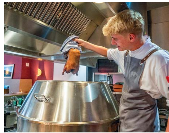
Orania Berlin, la preparazione della celebre anatra laccata