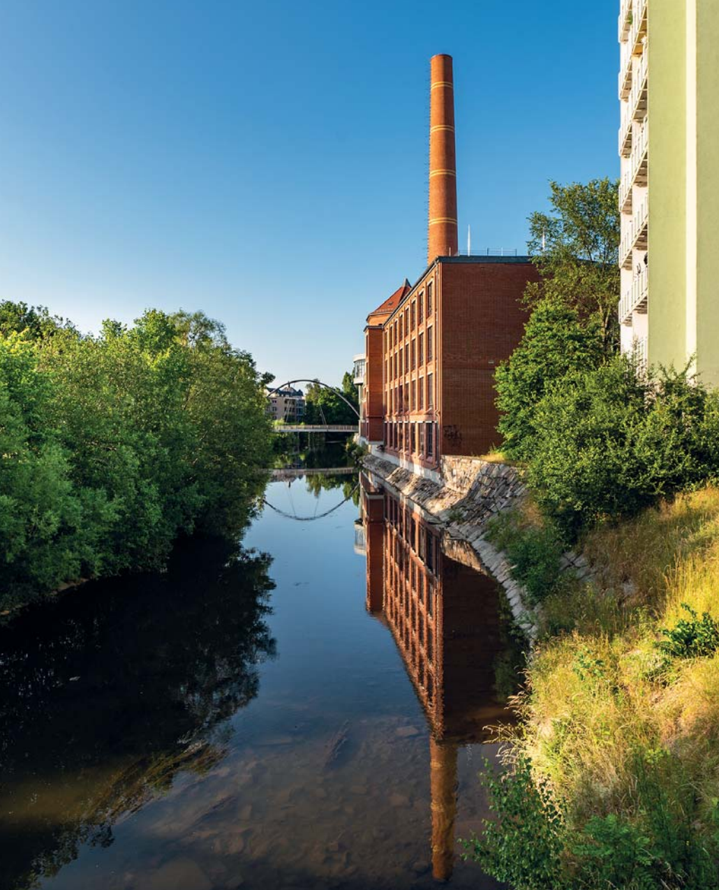
La prospettiva fluviale di Chemnitz racconta il passato industriale della città, con la grande ciminiera sullo sfondo, ma lo inserisce in un contesto bucolico, concepito all'insegna della sostenibilità, con ampie aree verdi e locali organizzati attorno ai dehors estivi