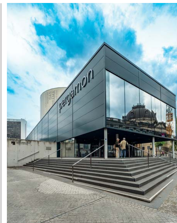
Berlino, l'edificio che ospita il diorama del Pergamon, una delle nuove attrazioni berlinesi da non perdere. In attesa della ristrutturazione del celebre altare, capolavoro dell'antichità, si può ammirare una selezione delle opere e fruire dell'emozionante installazione immersiva del complesso

Il Mitte abbiamo iniziato a conoscerlo partendo da Postdamer Platz , luogo emblematico dove la Berlino della post unificazione iniziò a mostrare i suoi nuovi muscoli di luci e di cemento. Lasciamo la parola a Stefano: «Partiamo dunque da Potsdamer Platz con la S-Bahn, ossia la metro di superficie, diretti verso Oranienburger Strasse nel Mitte: la soglia ibrida di quello che era, fino al 1938, il quartiere in cui si trovavano le principali istituzioni della comunità ebraica di Berlino: il cimitero, l'ospedale, le scuole, l'ospizio per gli anziani e l'imponente sinagoga, situata di fronte a importanti infrastrutture dell'appena nato impero prussiano, come la centrale telefonica, i reali uffici postali e del telegrafo. L'areale in cui si trova quest'ultimo è la nostra prima