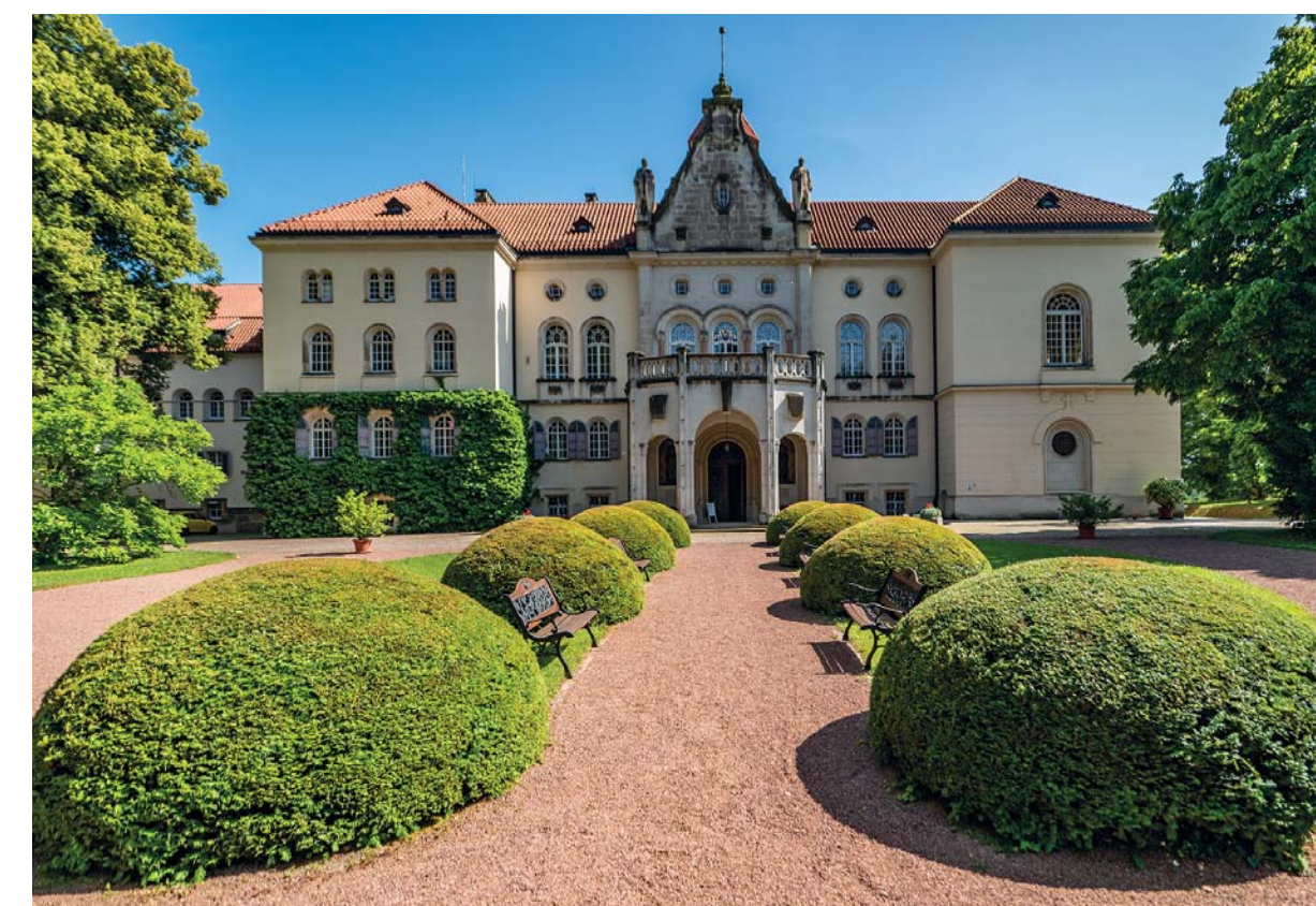
Il castello di Waldenberg, con il suo impatto fiabesco, testimonia l'art de vivre di una casata nobiliare sassone. Ma è anche l'occasione per apprezzare interni di grande suggestione, dove il tempo sembra essersi fermato