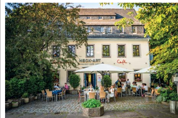
Il ristorante Heck-Art propone un'atmosfera "fuoriporta", anche se è facilmente raggiungibile a piedi dal centro. Bel giardino all'esterno, cucina locale e contaminazioni mediterranee