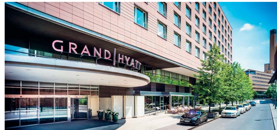
Il Grand Hyatt Berlin è una struttura sofisticata e strategica, collocata in Postdamer Platz propone ambienti eleganti e gusto per il design, con opere d'arte su ogni piano e una spettacolare piscina coperta panoramica