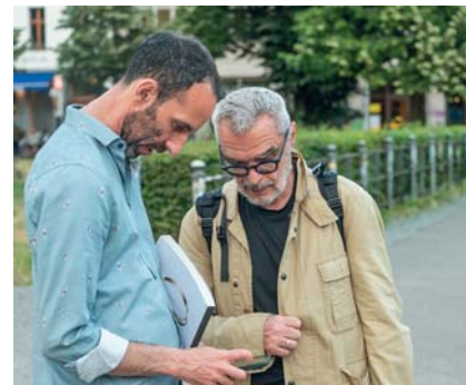
In esplorazione nella Kreuzberg dei sapori