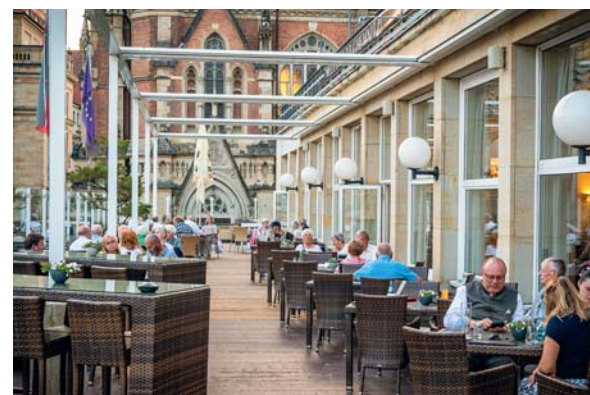
L'Opera Restaurant & Lounge è uno degli approdi gastronomici d'eccellenza di Chemnitz. Proprio di fronte all'area dove si tengono i concerti estivi propone cucina internazionale e sapori sassoni in veste gourmand