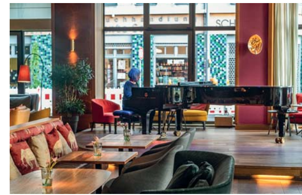
Orania Berlin, la sala da pranzo del ristorante