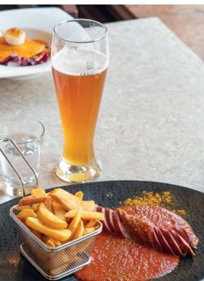
La cucina locale ha radici tradizionali, dove la carne riveste il ruolo principale. Solitamente servita con le celebri patate e la birra, che, originariamente, per l'apporto calorico, si intendeva come alimento e non solo come bevanda