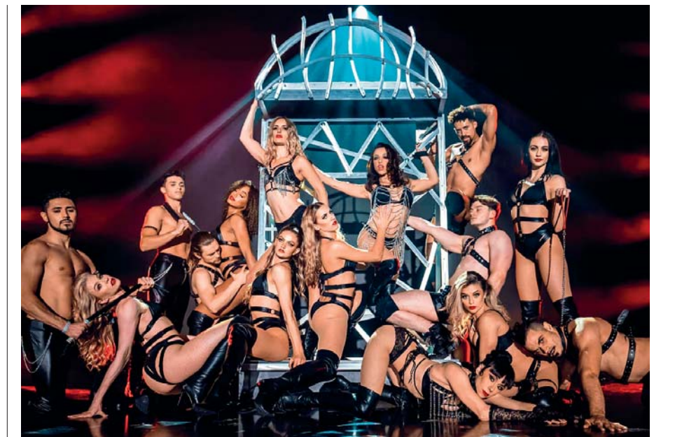
Vegas Rouge è uno show da non perdere: provocatorio e coloratissimo, ammiccante e travolgente. Gli artisti uniscono competenze diverse e irresistibili, acrobati e veri funamboli nelle evoluzioni al trapezio

zonate, momenti burlesque, continui cambi di scena, corpi esibiti con malizia, sense of humor, ritmi frenetici. La produzione è internazionale, ma l'anima è risolutamente berlinese. Di quello che dicono non capirete un'acca, ma davvero non importa. Vivrete una serata color rosso acceso. A metà strada tra Cabaret e i licenziosi teatri della serie (cult) Babylon Berlin . >>>