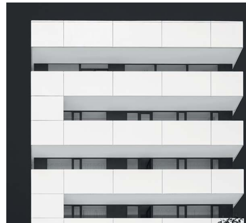
Le architetture della ex DDR, candide e geometriche, fanno pensare alle piazze metafisiche di De Chirico, dove la presenza degli elementi urbani evoca atmosfere sospese nel tempo

Il centro storico di Chemnitz venne quasi completamente distrutto dai bombardamenti inglesi durante il secondo conflitto mondiale. Oggi, amorevolmente ristrutturato, permette di rivivere le atmosfere dell'antica città sassone