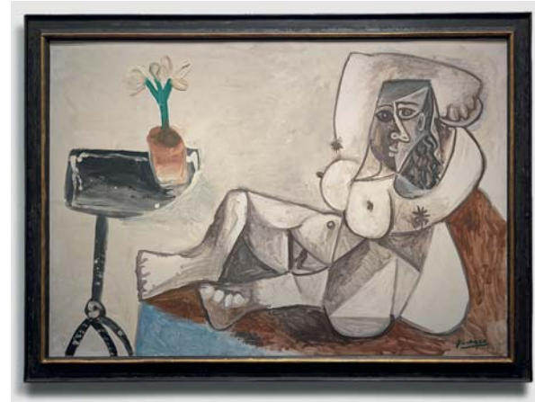
Un'opera di Pablo Picasso esposta nella mostra alla Neue Nationalgalerie. Ogni stagione dell'arte contemporanea universale è presente coi suoi artisti, inseriti nel contesto storico e culturale