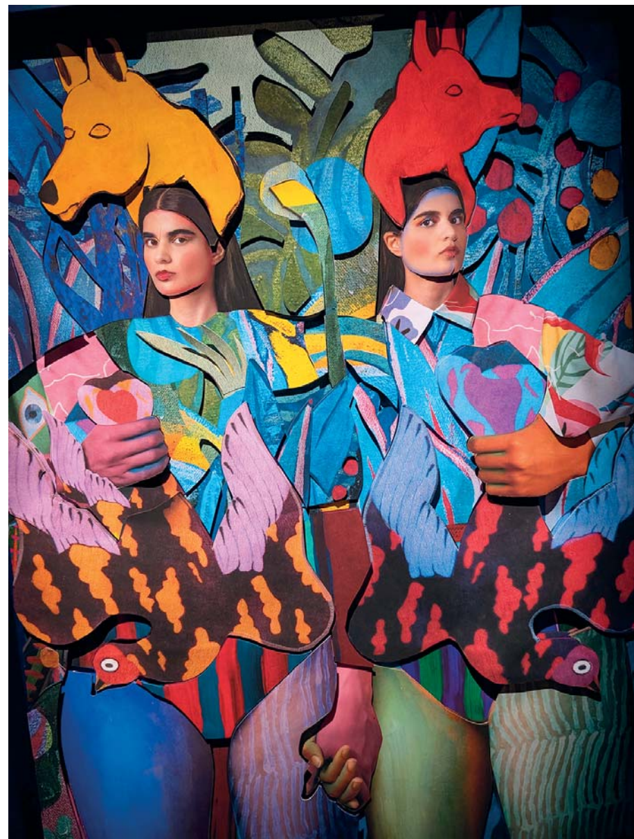
L'esposizione Hysteria propone le opere di Cooper & Gorfer a Fotografiska, nuovo spazio dedicato alle immagini creative, e provocatorie, dello scenario internazionale. Di suggestiva originalità il contesto, quello dell'ex centro sociale Tacheles

La prima volta che sono stato a Kreuzberg era il 31 dicembre del 1988, esattamente un anno prima della caduta del Muro. Nello storico quartiere popolare e operario si respirava aria di frontiera, perché quel Muro era proprio lì e quasi lo potevi toccare, sinistro e minaccioso teneva lontani tutti, tranne una eterogenea popolazione di squat, turchi, immigrati di varia origine e artisti squattrinati. La notte del 31 dicembre venne scelta dalla polizia per espugnare – manu militari – gli inquilini del centro sociale Kazzo , che allora andava per la maggiore. Il furibondo match terminò in parità. Negli anni seguenti Kreuzberg non ha sostanzialmente modificato la sua anima di villaggio alternativo , anche se la recente gentrificazione ha portato un robusto incremento degli affitti. Così oggi tutto è sicuramente più lustro (si fa per dire), certamente più desiderabile, ma con un minore tasso di genuinità. D'obbligo la visita all' East Side Gallery – un chilometro e mezzo del Muro originario decorato da writers internazionali –