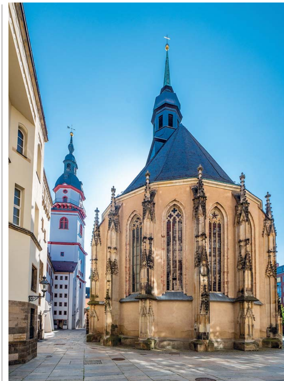
Chemnitz e la vicina Zwickau portano il ricordo di un passato ricco, con edifici medioevali e barocchi a impreziosire il centro storico. Un patrimonio recuperato con cura dopo le devastazioni della Seconda guerra mondiale

metri quadrati. Tutto è vivo e vitale, i set raccontano e ambientano centinaia di vetture che narrano la storia della città, della regione e della Germania intera. Le auto cessano, almeno ai nostri occhi, di essere macchine, per rivelarsi opere d'arte e d'ingegno, emozionanti come creature d'acciaio, pronte a rimettersi in moto. Nel cuore di Zwickau si può visitare la casa natale – concert hall e centro ricerca – di Robert Schuman . L'impressione è quella di un luogo abitato, dove il compositore e la moglie Clara sembrano essere ancora lì, seduti di fronte al pianoforte preferito, alle prese, oggi