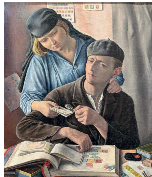
La grande esposizione dedicata al realismo in Europa tra il 1920 e il 1930 è una proposta di grande impatto artistico: vengono messi a confronto opere e artisti di tutti i continenti, uniti da una comune sensibilità per il tema