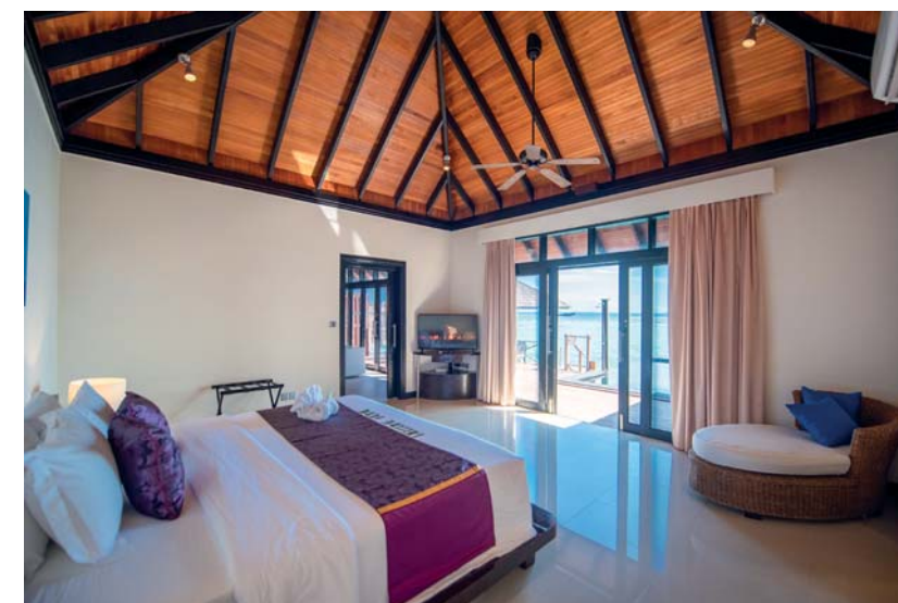
L'interno delle Beach Villas al Siyam Iru Fushi, dove prevalgono elementi naturali rigorosamente autoctoni. Gli spazi sono caratterizzati da un grande ambiente living aperto verso la piscina privata e il mare

con infinity pool a sfioro, lunga 25 metri. La pluripremiata spa by Thalgo si trova in un'area appartata del resort, immersa in una vegetazione tropicale di palme e alberi in fiore. Nelle venti salette a disposizione degli ospiti si effettuano oltre 140 trattamenti utilizzando tecniche orientali, comprese quelle maldiviane, e occidentali. Un medico ayurvedico residente, guida gli ospiti attraverso i trattamenti maggiormente indicati per il loro benessere. Lo snorkeling è una attività imprescindibile : qui è facile osservare da vicino gli abitanti del mondo subacqueo, dove la star è il pesce pagliaccio, che si può incontrare nel Nemo Garden, impianto restitutivo di barriera corallina a pochi metri dalla riva. Per le immersioni, il diving center certificato SSI organizza non soltanto corsi, ma anche uscite per esplorare la barriera corallina, dove si trovano mante, squali nutrici e leopardo, che nuotano tra le thila , le formazioni coralline che dal fondale si ergono fino a 5 metri dalla