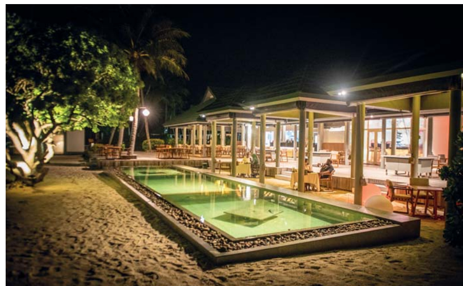
Il ristorante giapponese Arigato esalta le proprie ricette utilizzando la materia prima dell'Oceano Indiano: freschissima, quotidianamente disponibile grazie alla perizia dei pescatori locali