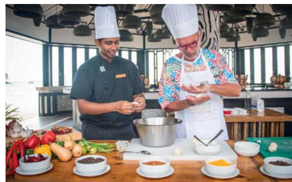
Corso di cucina al Siyam Iru Fushi. L'occasione ideale per cimentarsi con i saperi di una tradizione antica, dove i prodotti del mare vengono interpretati con semplicità, ma anche arricchiti con l'uso delle spezie e della frutta tropicale

con infinity pool a sfioro, lunga 25 metri. La pluripremiata spa by Thalgo si trova in un'area appartata del resort, immersa in una vegetazione tropicale di palme e alberi in fiore. Nelle venti salette a disposizione degli ospiti si effettuano oltre 140 trattamenti utilizzando tecniche orientali, comprese quelle maldiviane, e occidentali. Un medico ayurvedico residente, guida gli ospiti attraverso i trattamenti maggiormente indicati per il loro benessere. Lo snorkeling è una attività imprescindibile : qui è facile osservare da vicino gli abitanti del mondo subacqueo, dove la star è il pesce pagliaccio, che si può incontrare nel Nemo Garden, impianto restitutivo di barriera corallina a pochi metri dalla riva. Per le immersioni, il diving center certificato SSI organizza non soltanto corsi, ma anche uscite per esplorare la barriera corallina, dove si trovano mante, squali nutrici e leopardo, che nuotano tra le thila , le formazioni coralline che dal fondale si ergono fino a 5 metri dalla