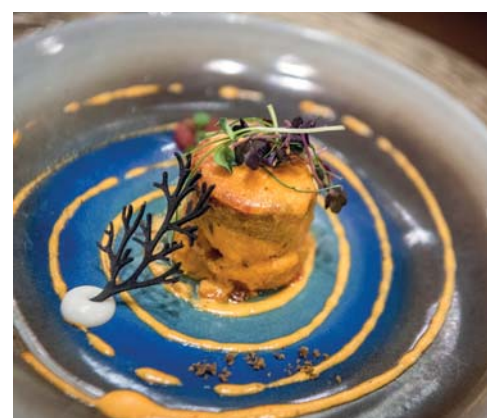
Tre piatti proposti nel menu degustazione dallo chef Mangal. Al Barrique Wine Cellar non si ordina, ci si lascia sedurre da portate che incrociano mare e terra, mentre i vini vengono scelti dal sommelier per esaltare le ricette del showcooking dinner

Alle Maldive il flusso turistico è da sempre cosmopolita. Nei Siyam Resort la maggior parte dei visitatori sono, nell'ordine: russi, inglesi, americani, indiani; seguono i restanti europei, e poi, con una quota per ora minima ma in crescita, gli italiani