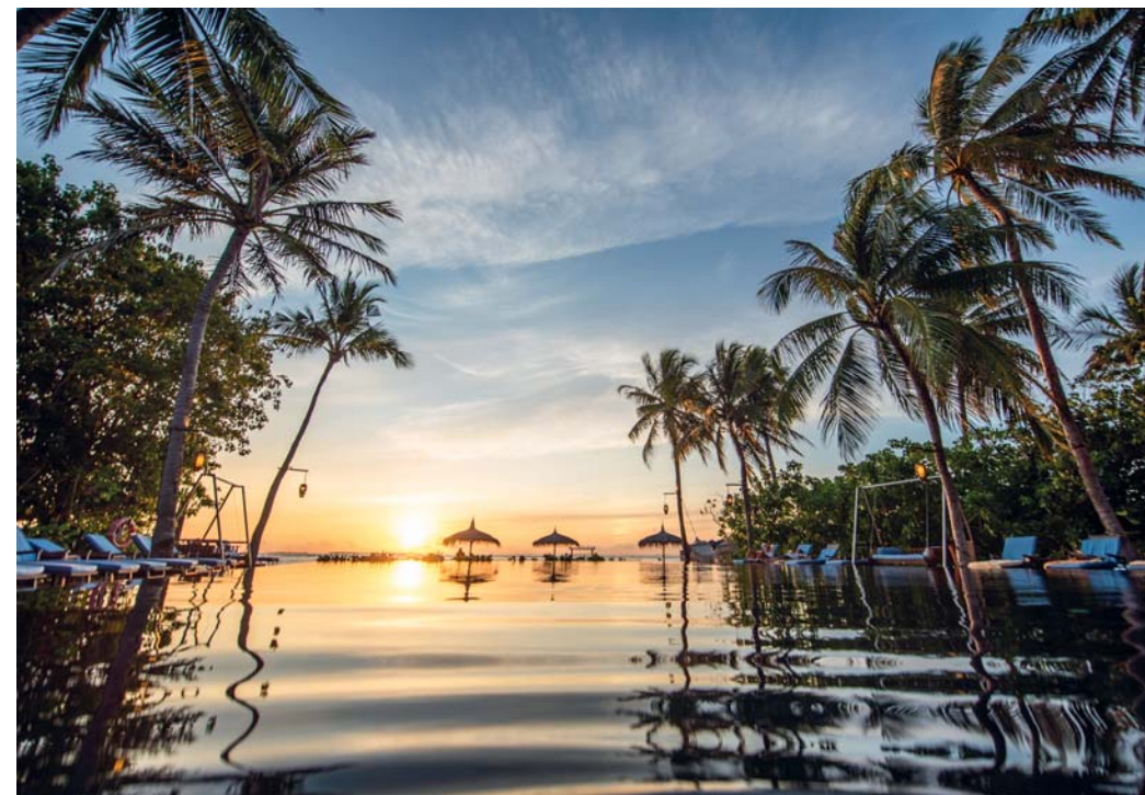
Le grandi piscine "a sfioro" dei Siyam Resorts sono posizionate fronte mare, nella maggior parte dei casi rivolte verso il tramonto, per poter approfittare delle luci al calar del sole. Magia completata da una cornice di palme riflesse nell'acqua