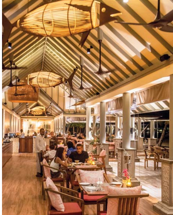
Il ristorante maldiviano Kaage del Syam World propone una cucina tradizionale, aggiornata nelle ricette e negli accordi gastronomici, moderna ma senza perdere le proprie radici