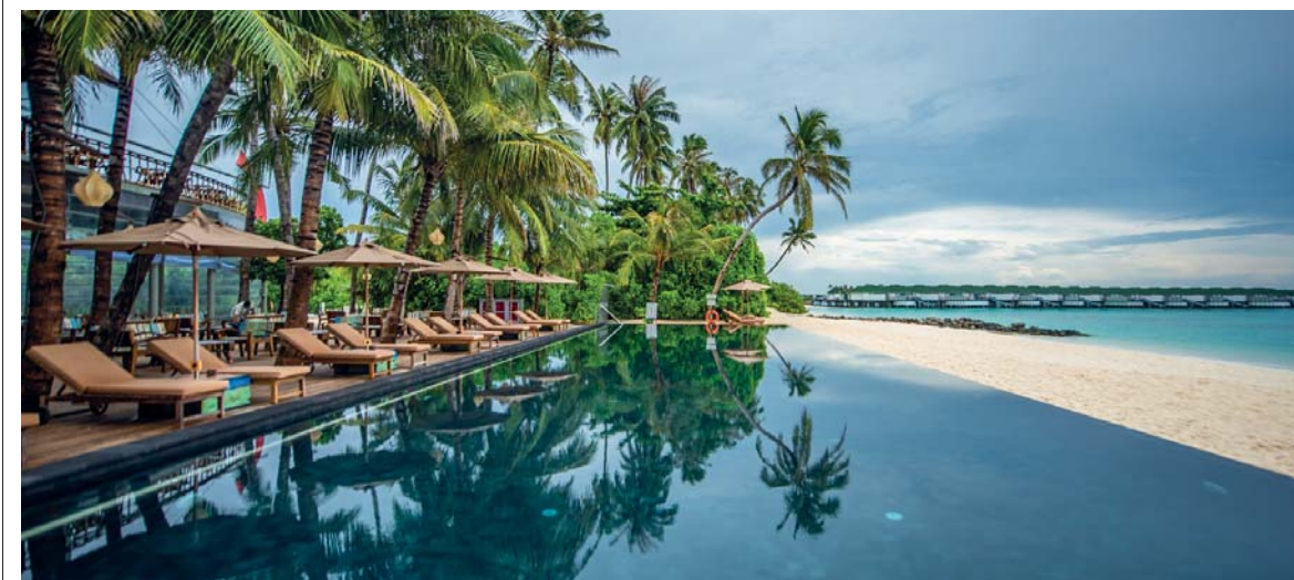
La coreografia dei Siyam Resort prevede i lettini rivolti verso l'oceano, con sempre una piscina a sfioro disponibile e servizi di bar ristorante nelle immediate vicinanze. Tutto è un piacere di prossimità concepito nei minimi dettagli