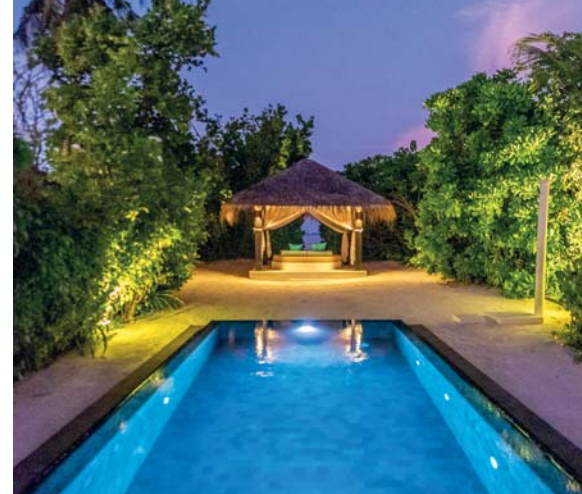
Le Beach Villas del Siyam Iru Fushi sono una sistemazione esclusiva che comprende un'ampia area di soggiorno, la grande vasca idromassaggio esterna, una piscina privata e l'accesso diretto alla spiaggia