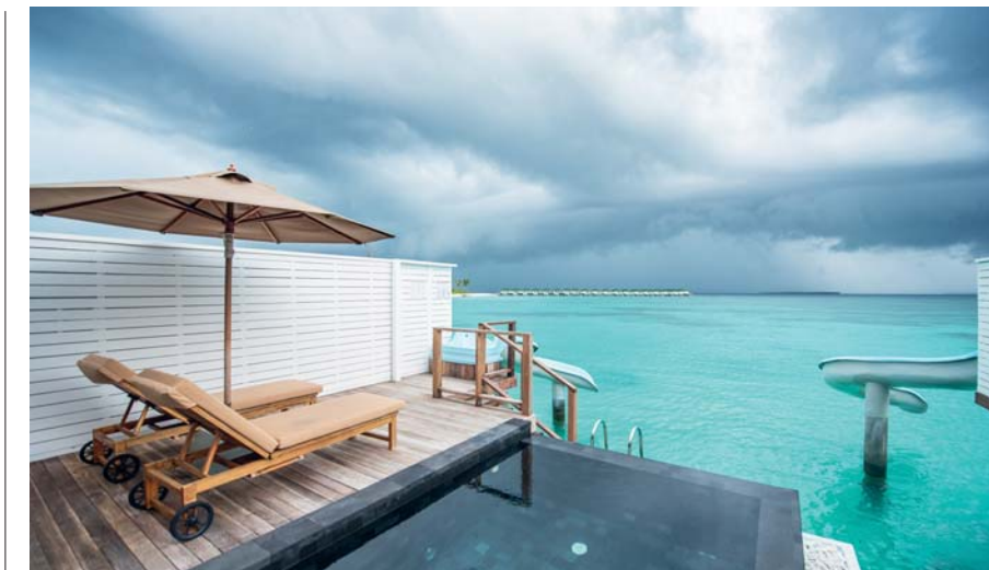
Alle Maldive esiste l'incognita del brutto tempo? Certo, soprattutto durante la stagione delle piogge, mentre il meteo più favorevole è nel nostro inverno. Ma il fascino della pioggia ai tropici, coi cieli tormentati, non è uno spettacolo da trascurare

sistemazioni differenti, con proposte che spaziano da 89 fino a 3.000 metri quadrati, dalle pool beach villas a pochi passi dalla spiaggia, alle water villas sull'acqua, con scivolo per tuffarsi in mare, fino alle strutture da 2 a 5 camere da letto. In totale le unità abitative – arredate in ricercato design contemporaneo – sono 469 , delle quali 181 sulla spiaggia, o nelle immediate vicinanze, e 288 sull'acqua. Immersa nella vegetazione tropicale, Veyo Spa (il nome significa "vite", un omaggio alla folta e rigenerante vegetazione dell'isola) è il luogo dove ricaricarsi o farsi coccolare da massaggi e trattamenti. I prodotti utilizzati sono locali, con la maggior parte dei massaggi a base di oli medicinali tradizionali maldiviani o di erbe tropicali. Come Veyo Signature, per rilassare i muscoli e alleviare le tensioni, oppure Veyo Scrub, un trattamento a base di sabbia, erbe o polpa di cocco per uno scrub profondo. Fiore all'occhiello di Siyam World è la ristorazione, un vero festival internazionale permanente, dove la regia è firmata dall'executive chef Aaron Slater . Tra le proposte che spaziano in ogni direzione noi abbiamo particolarmente amato: Takrai , che serve cucina thai, l'indiano Kurry Leaf , lo spagnolo Andalucia , Arigato , raffinatissimo giapponese sulla spiaggia, dove sushi e saimi vengono preparati con il pescato dell'oceano (una marcia in più rispetto ai migliori ristoranti nipponici internazionali).