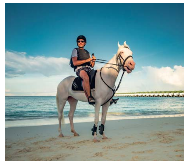
Al Siyam World le possibilità di praticare attività sportive possono coprire l'intero arco della giornata: snorkelling e immersione, equitazione per partecipanti di ogni età, camp con i grandi campioni del football