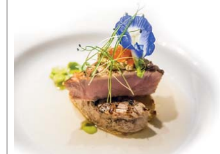
Una creazione di cucina francese al ristorante Flavours di Iru Fushi. Gli ospiti possono scegliere tra una varia offerta gastronomica, che spazia dall'Oriente all'Europa. Un festival di sapori internazionali all'insegna dell'eccellenza

superficie. Molti sono coloro che scelgono le Maldive per viaggi di nozze e anniversari, in questo caso le proposte romantiche alla carte rispondono a ogni esigenza. Compresa quella di noleggiare un'isola deserta, minuscola e dalla sabbia bianchissima, dove godersi l'intera giornata, ma anche gli sfizi gastronomici degli chef di Iru Fushi. Prima di partire sarete invitati a piantare la vostra palma, il migliore augurio di buon ritorno in questo angolo di paradiso.