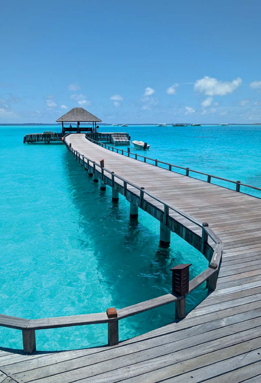
Una passerella del Siyam Iru Fushi si allunga, sinuosa, verso le acque dell'atollo. Le basse profondità che circondano le isole permettono queste soluzioni architettoniche, ideali per immergere le strutture direttamente nel contesto marino

tinenti, per raggiungere il luogo delle tante isole che punteggiano un blu "che si muove anche di notte", come canta Paolo Conte . Così, quando finalmente ci sono, non posso che pensare a una delle più insidiose considerazioni di Alessandro Baricco: «Il mare non fa altro, in fondo, che questo: chiamare. Non smette mai, ti entra dentro, ce l'hai addosso, è te che vuole. Puoi anche far finta di niente, ma non serve. Continuerà a chiamarti». Mare assoluto? Lo abbiamo già detto. Ma anche paradiso in pericolo. Le Maldive hanno un'altezza media di un metro e mezzo, se il riscaldamento globale procederà di questo passo, tra pochi lustri, invece dei puntinati di Hirst, resteranno solo le tele di Klein, rese celebri dal blu profondo e uniforme, tanto per intenderci. L'uomo ha colonizzato l'arcipelago con mano leggera, almeno sinora. I suoi abitanti, musulmani, parlano il divehi, lingua indo-ariana autoctona, e sono, per vocazione, formidabili pescatori. In realtà dovremmo dire "lo erano", perché, negli ultimi trent'anni, il turismo ha radicalmente modificato l'asset dell'economia maldiviana. Per primi arrivarono hippy e viaggiatori estremi, quelli con bagaglio minimale appresso e tanta voglia di scoprire un