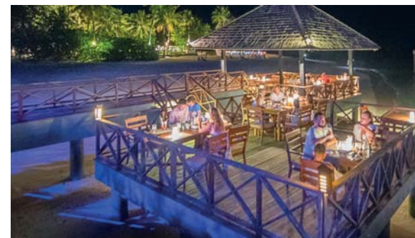
Le serate nei Siyam Resorts sono caratterizzate da un uso sapiente delle luci. Bandite le scenografie dei grandi villaggi internazionali, qui vince il gusto per un'atmosfera intima e suggestiva, ideale per lasciarsi circondare dalla notte tropicale