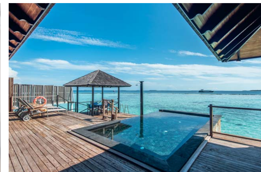
Nei Siyam Resorts il gioco di prospettive tra le piscine e l'oceano valorizza l'immersione nel contesto tropicale. Tutte le sistemazioni garantiscono un'ampia metratura e uno standard di privacy assoluto

superficie. Molti sono coloro che scelgono le Maldive per viaggi di nozze e anniversari, in questo caso le proposte romantiche alla carte rispondono a ogni esigenza. Compresa quella di noleggiare un'isola deserta, minuscola e dalla sabbia bianchissima, dove godersi l'intera giornata, ma anche gli sfizi gastronomici degli chef di Iru Fushi. Prima di partire sarete invitati a piantare la vostra palma, il migliore augurio di buon ritorno in questo angolo di paradiso.