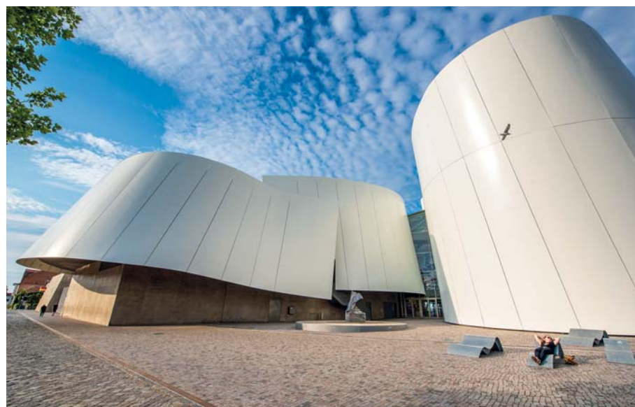
L'Ozeaneum di Stralsund è dedicato alla vita nei mari settentrionali d'Europa. Sorprende e lascia ammirati per le sue forme candide e avvolgenti, che si inseriscono audacemente nel porto antico

che già nel 2008, in anticipo sui tempi, aveva progettato l' Ozeaneum con particolare attenzione alla sostenibilità; affrontando con efficacia il problema dell'inquinamento in ogni sua forma. Premiato come miglior museo Europeo nel 2010, questo capolavoro racconta il Mare del Nord e il Mar Baltico con le sue creature; fornendo anche le istruzioni per l'uso, quelle da mettere in campo per