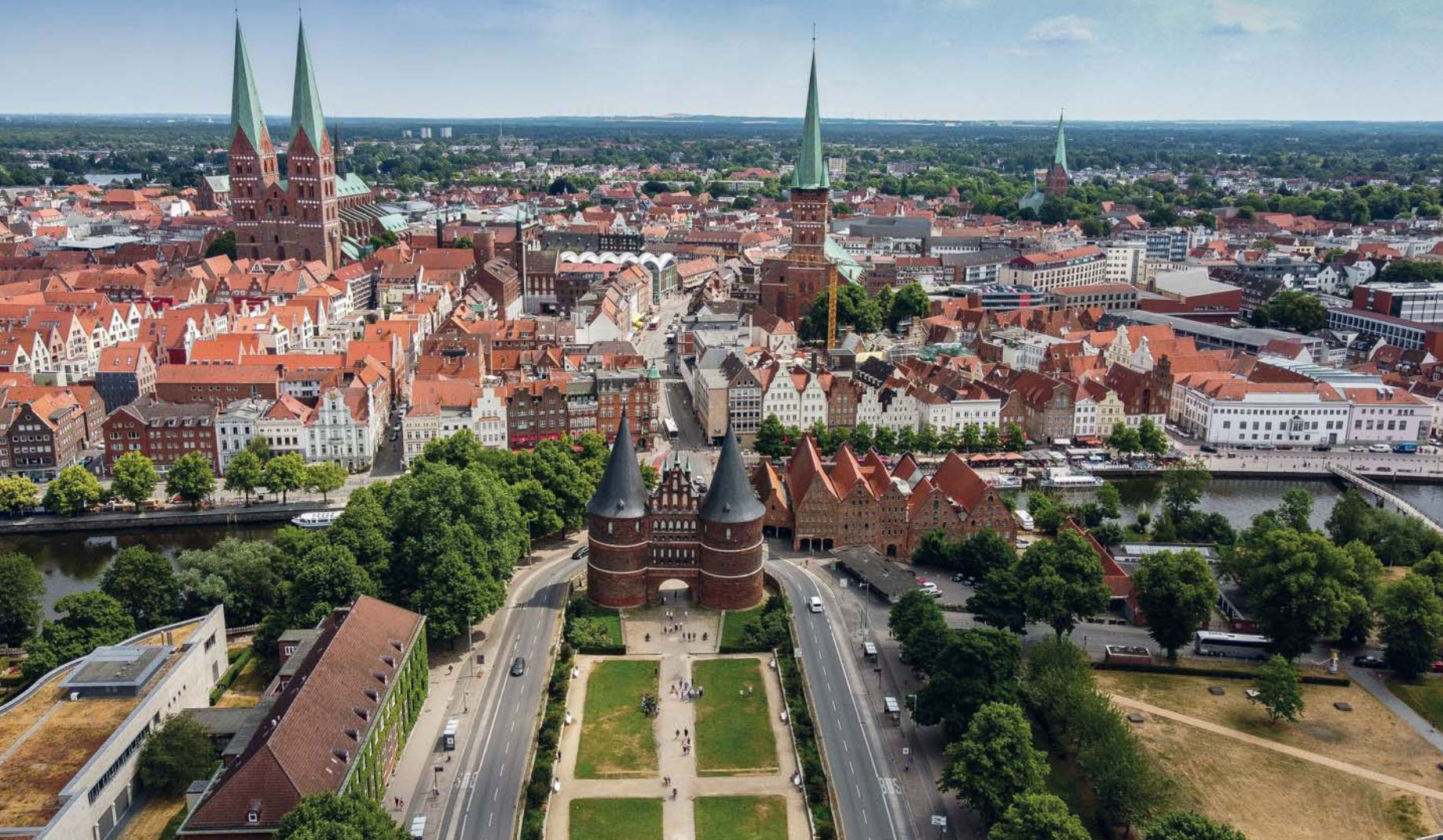
Veduta aerea di Lubecca, città regina della Lega Anseatica. Le sue meraviglie medioevali sono state in gran parte risparmiate dai bombardamenti del secondo conflitto mondiale