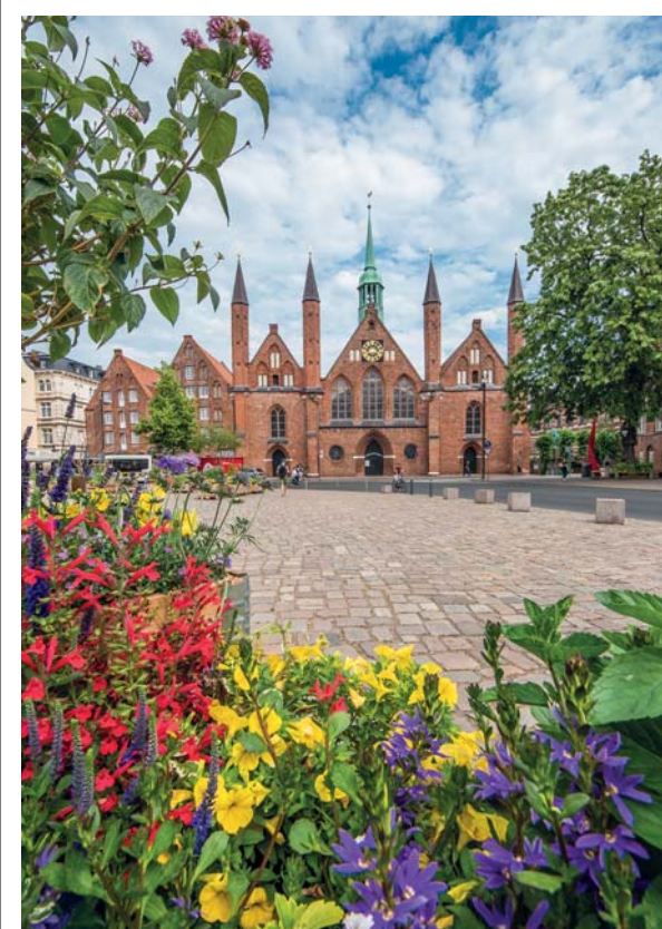
Durante la stagione estiva il centro di Lubecca offre coreografiche fioriere che completano la suggestione di una città vissuta a misura d'uomo, tra rispetto per la storia e sostenibilità ambientale

paritetici. Siamo nel XXI secolo? Stiamo parlando degli straricchi del Gruppo Bilderberg? O del World Economic Forum di Davos? No, ci riferiamo ai principi della Lega Anseatica , la più grande alleanza commerciale del medioevo (e non solo) nata, sulle rive del Baltico, nel XII secolo. I principi che la costituiscono restano di grande attualità, perché propongono una ben dosata formula di vincoli e di privilegi, mettendo al centro la città – coi suoi mercati – e anteponeandola agli stati nazionali, pesanti per gabelle e burocrazia. Vince "il piccolo" che,