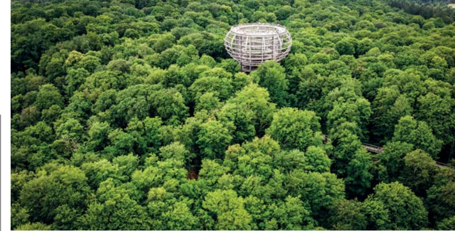
Una delle due torri del Naturerbe Zentrum di Rügen fa capolino dalla foresta come una costruzione aliena, dalla sua cima si domina tutto il paesaggio circostante