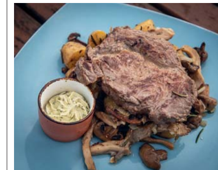
La Schilligs Gasthof è il tempio della carne nell'isola di Rügen. Allevamenti di assoluta prossimità e cura per ogni dettaglio della produzione. Ristorante imprescindibile

con carni prodotte da loro e pescato in arrivo dal molo prospiciente. Chilometro zero? Molto, ma molto di più. Nella località balneare di Binz, lo Strandhotel Dorint ospita il ristorante Olivio : ingredienti tedeschi certificati e ricette di ispirazione mediterranea. Difficile gustare carni di questa levatura, il miglior indirizzo del viaggio. Due gioielli ancora, prima di lasciarvi. Nei pressi di Binz domina la foresta il castello ottocentesco di Granitz , onirico ed eclettico espone le sue forme moresche in Pomerania . A Cap Arkona vanno nuovamente in scena le candide scogliere di Rügen , segnalate da due fari tra i più belli del Baltico. Un luogo di tale bellezza che venne scelto per celebrare i riti in onore di Svetovid e del suo oracolo equino, leggendario stallone bianco che poteva decidere tra guerra e pace. >>>