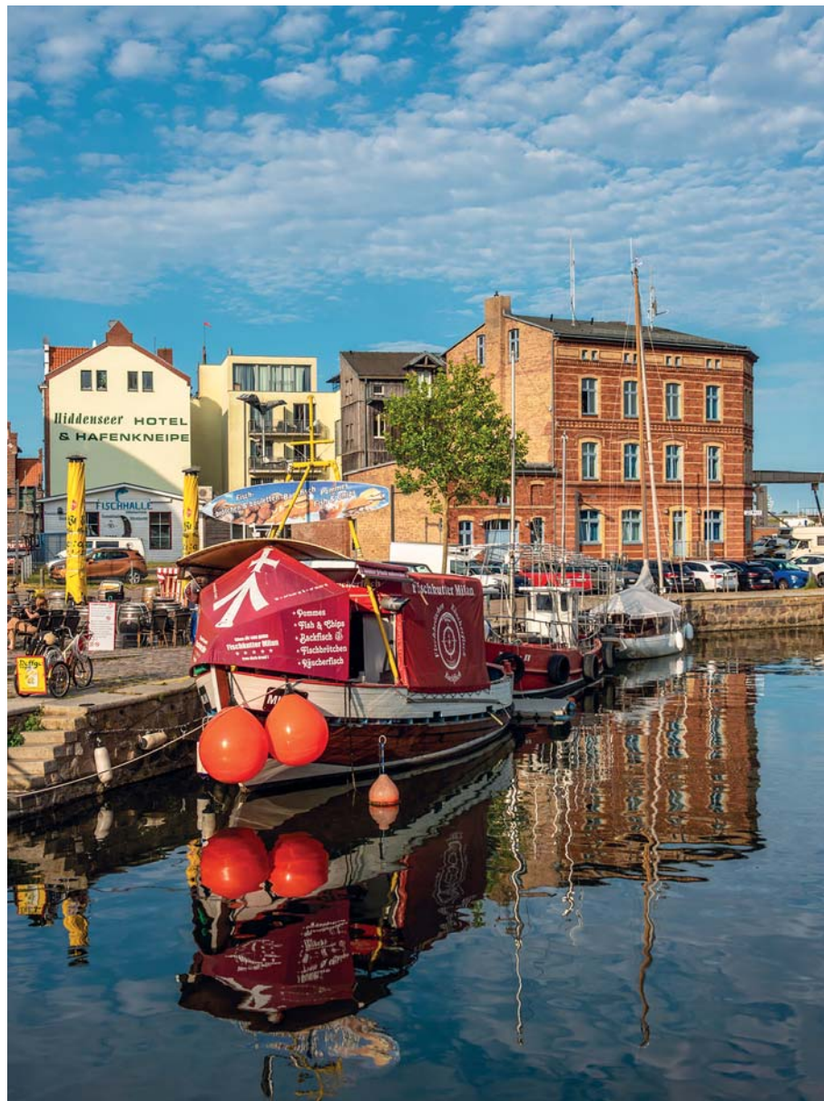
Stralsund, suggestiva cittadina marinara dal passato anseatico, ha una vitalità sorprendente, certificata da piccoli ristoranti di pesce allestiti nelle barche ormeggiate sul porto

che già nel 2008, in anticipo sui tempi, aveva progettato l' Ozeaneum con particolare attenzione alla sostenibilità; affrontando con efficacia il problema dell'inquinamento in ogni sua forma. Premiato come miglior museo Europeo nel 2010, questo capolavoro racconta il Mare del Nord e il Mar Baltico con le sue creature; fornendo anche le istruzioni per l'uso, quelle da mettere in campo per