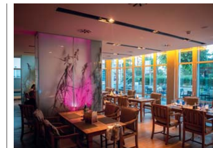
Il ristorante Olivio del Dorint Strandhotel: sapori di ricerca tra Germania e Mediterraneo, eccellenti proposte di terra e di mare