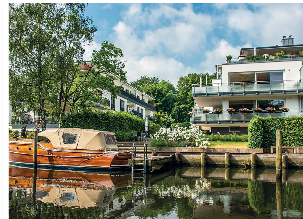
Le rive del fiume Trave ospitano edifici residenziali di grande bellezza: vetrate rivolte verso le acque, giardini, estrema attenzione ai principi della sostenibilità

Lubecca è una meraviglia sostanzialmente preservata dalla storia. Se alloggiate all' Holiday Inn – ottima scelta, posizione strategica, ambientazioni e design che reinterpretano la storia della città, confortevole piscina e sauna – fate una passeggiata nel parco e, in pochi