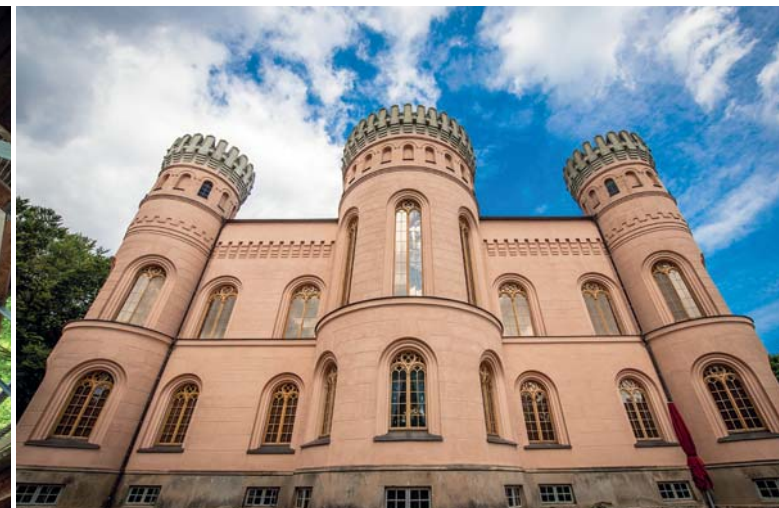
Il castello di caccia di Granitz, con le sue forme tra il gotico e il moresco, sovrasta la foresta dalla cima di un colle. La costruzione eclettica fu residenza estiva concepita per la caccia