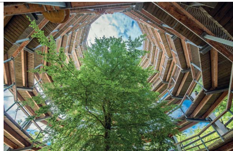
Il Naturerbe Zentrum di Rügen permette un'immersione totale nella vegetazione dell'isola. Agili strutture in legno consentono l'ascesa ben oltre l'orizzonte degli alberi

salvaguardare un patrimonio in evidente pericolo. La parte più spettacolare dell' Ozeaneum esibisce la fauna marina in ambienti spettacolari e luminosi. Di particolare effetto la grande vetrata, che occupa un'intera parete, alta più di dieci metri, dove i pesci si muovono in completa naturalezza, creando coreografie teatrali sempre differenti. Di sicuro effetto l'allestimento dell' auditorium , dove ci si accomoda su comode chaise longue; in alto le riproduzioni dei grandi cetacei nelle dimensioni originali. Luci e suoni, siamo sott'acqua con loro. Didattico e spettacolare, ludico e scientifico, questo è il museo del mare di nuova generazione. Lo visitano un milione di persone all'anno, e aspetta voi.