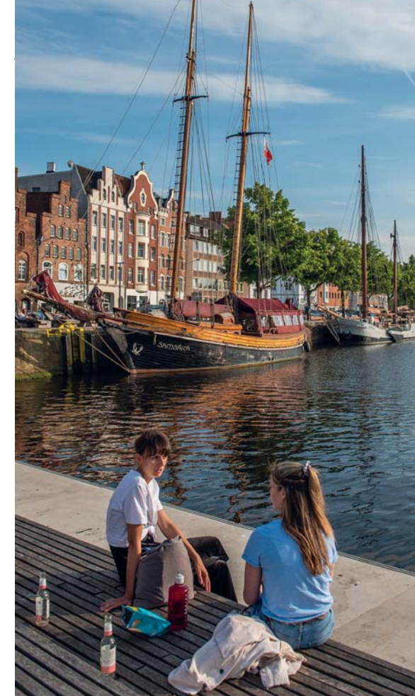
Realizzato dalla municipalità di Lubecca, questo molo urbano non è un approdo per la navigazione, ma nasce come luogo di incontro e intrattenimento

alleandosi, diventa grande, formando una rete di protezione che ne tutela l'economia e l'indipendenza. Le principali città furono: Lubecca (più volte definita la regina della Lega Anseatica), Amburgo, Brema, Berlino, Kiel, Rostock, Stralsund, Wismar, Danzica, Stettino, Amsterdam, Groninga, Copenaghen, lo stato monastico dei cavalieri teutonici, Visby, Tallin, Riga, Kaliningrad ... in tutto 70 e oltre 130 collegate. Ma in ogni città d'Europa, anche mediterranea, esisteva un "fondaco anseatico", che stoccava e distribuiva merci. Le navi della lega operavano tra il Mare del Nord e il Baltico, fino alla Russia. L'alleanza si potrebbe definire tanto solida quanto "destrutturata", non esisteva infatti un regolamento vero e proprio, né un tesoro unitario, né un esercito o una flotta comune. Vigeva il principio della reciproca assistenza e della protezione contro i nemici comuni, tutte le decisioni erano assembleari, poi ratificate dalle singole città. Nel periodo di massimo splendore la lega sconfisse prima il re di Danimarca e poi quello di Scandinavia , le armi dei commercianti erano invincibili. Il tramonto avvenne senza un atto preciso: a partire dal 1492 le rotte verso le Americhe spostarono il baricentro della navigazione, mentre in Europa si impose l'ascesa degli stati nazionali, più forti e meno inclini alle autonomie. Era il tramonto di un'epoca. L'ultima città anseatica ad ammainare bandiera fu Lubecca , la regina, dove il mito non si è mai arreso.