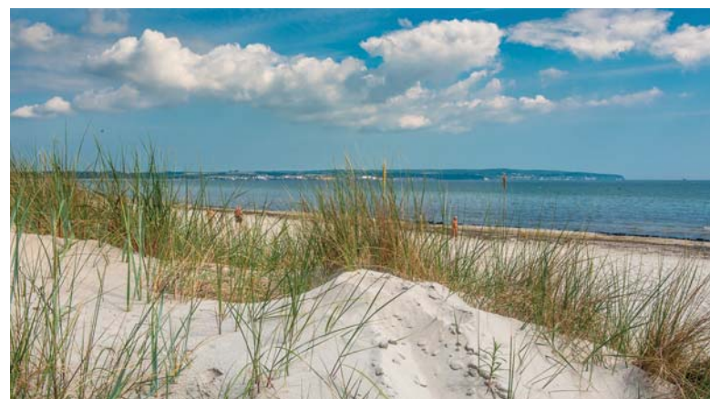
Le bianche spiagge del Mar Baltico, dove la vegetazione si fa strada tra la sabbia e si muove al ritmo del vento