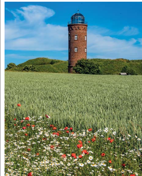
Il faro che caratterizza il panorama di Cap Arkona, si protende verso il cielo e impreziosisce un panorama dominato dal verde e dalle candide scogliere