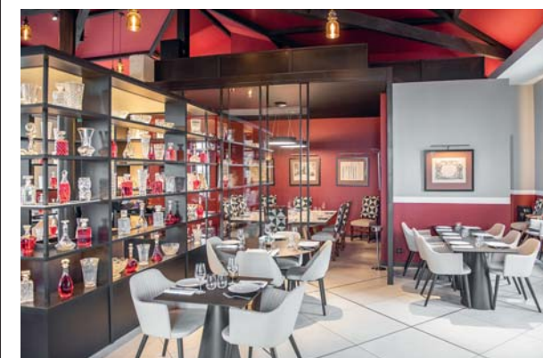
Marquis de Terme ospita nella tenuta un prezioso ristorante gastronomico, dove i vini del domaine vengono abbinati ad una raffinata cucina del territorio