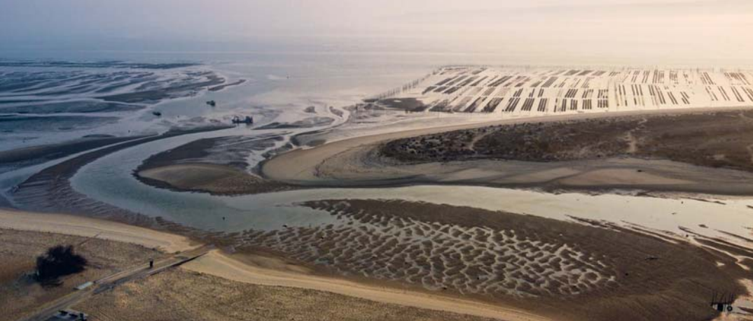
Questa veduta aerea del Bacino di Arcachon permette di osservare il movimento delle maree e la tavolozza di colori che ne deriva. All'alba e al tramonto prevale una fiabesca tonalità dorata