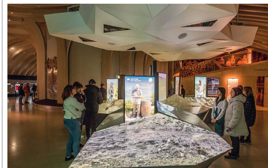
La Cité du Vin propone un percorso a tappe attraverso la storia e la civiltà del vino. Grazie a installazioni video e grandi pannelli interattivi, il pubblico esplora le diverse dimensioni con una partecipata esperienza ludica