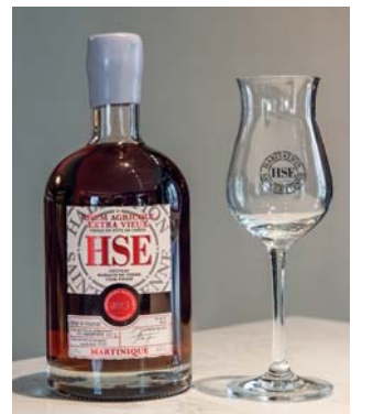
Il rhum di Marquis de Terme viene prodotto in Martinica, successivamente matura nelle botti usate per il Bordeaux

ancora l'ambita stella, ma ci arriverà, la merita già adesso. Il regno degli châteaux vive dinamiche immutabili? Sicuramente no, in particolare negli ultimi cinque anni qualcosa sta cambiando. Sotto la medesima appellazione le fasce di prezzo e di prodotto sono sempre state estremamente variabili: ci sono bottiglie da centinaia di euro (dal valore in crescita come in borsa) e altre reperibili nella grande distribuzione sotto i dieci euro. Ed è la sorte di questi ultimi ad essere altamente a rischio, per la concorrenza di prodotti internazionali (ottenuti coi medesimi vitigni) che arrivano da Cile e Argentina , mercati in espansione, aggressivi, forti di un prodotto di livello ma assai accessibile, col fascino dell'esotico. Così oggi il panorama è destinato a cambiare: i ricchi sempre più ricchi (ma è poi una novità?), mentre i produttori più modesti stanno lasciando vigne e attività. Il turismo è sempre di più la nuova frontiera, tour e degustazioni ma anche eventi, convention aziendali nei domaines, fine dining con chef stellati pronti a cogliere l'opportunità. Quello che non cambierà mai è la vocazione di un vino nato per essere gustato nel mondo. Oggi l'export vale 1,6 miliardi di euro, con un 10% in più rispetto al pre-Covid. Asse portante del-