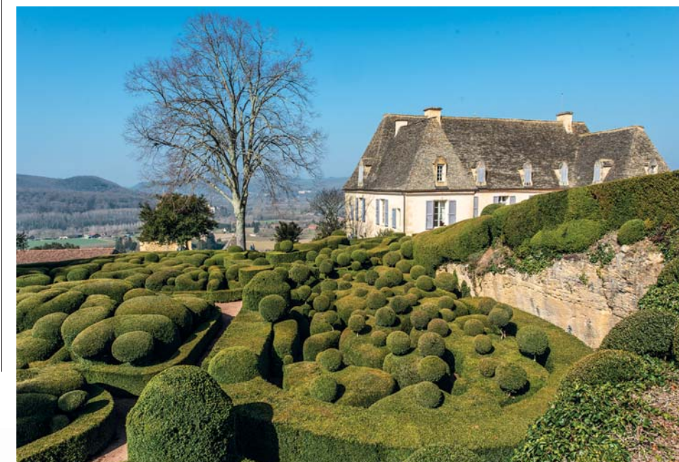
I giardini all'italiana di Marqueyssac sono i più belli della regione, e tra i più suggestivi della Francia intera. Il paesaggio è dominato da 150.000 tondeggianti bossi sempreverdi