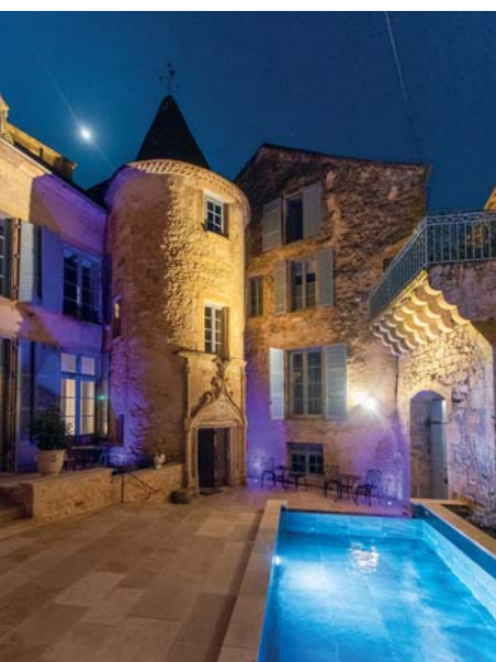
L'hotel Le Petit Manoir si trova nel cuore del centro storico di Sarlat. Il piccolo castello cinquecentesco ospita nella sua corte una piscina che la notte s'illumina di celeste