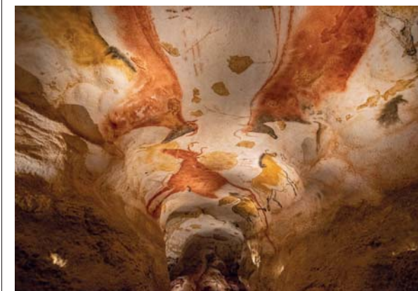
Lascaux IV è la ricostruzione, in copia esatta, di quella che tutti celebrano come "La Cappella Sistina della Preistoria". Le splendide pitture su roccia sono la prima opera d'arte dell'umanità