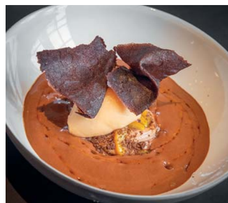
Una delle creazioni del ristorante di Marquis de Terme, grande cura all'impiattamento e all'accostamento cromatico