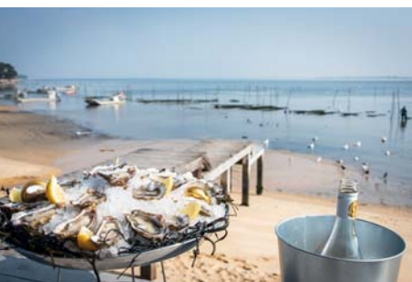
Il piccolo ristorante Confouine consente di apprezzare coquillages e ostriche, servite "in purezza", accompagnate da vino gelato, per un felice momento di armonia con tutto quanto vi circonda