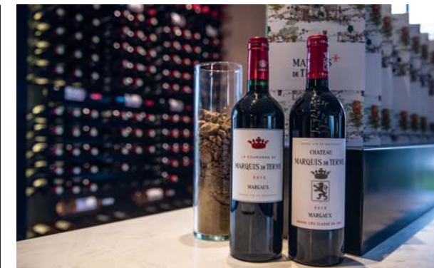
I vini di Château Marquis de Terme costituiscono un'eccellenza riconosciuta da tempo, la maison si è recentemente aggiudicata il Best of Wine Tourism