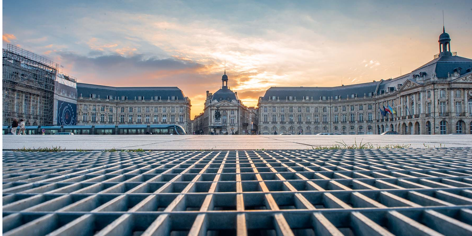
La Place de la Bourse è il luogo emblematico della città, con le sue forme eleganti e simmetriche, si affaccia sulla Gironda e ricorda i fasti commerciali di Bordeaux