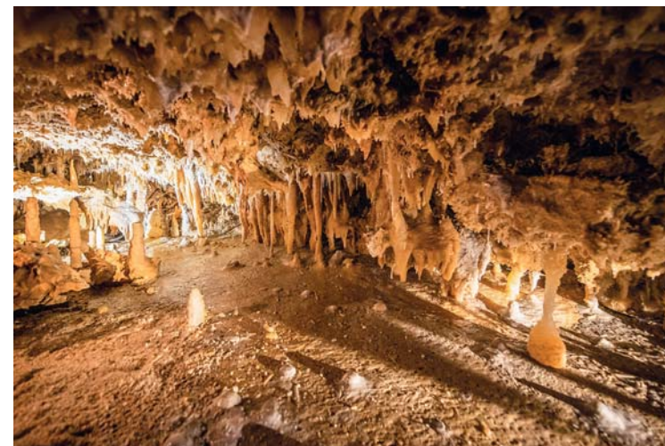
Le Grand Roc, patrimonio UNESCO, è una piccola grotta di originale fascino. Le sue dimensioni ridotte permettono di ammirare, da vicino, le concrezioni calcaree

I nostri antenati vivevano nelle caverne? Errato, ed è la prima cosa che impariamo dopo aver superato la soglia di Lascaux IV , la più formidabile opera di finzione dedicata alla preistoria. Perché questa non è la grotta originaria, che dista poche centinaia di metri,