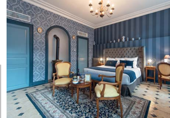
L'Hotel Restaurant de Bouilhac offre un soggiorno in quelli che furono gli appartamenti del medico di Luigi XV. Arredi d'epoca di grande charme

scoperta (fortuitamente) nel 1940, ma una fedelissima riproduzione, ci spiegano "al millimetro", del 2016. Invece le visite a quel capolavoro artistico risalente a 25.000 anni fa sono state interdetto dal 1963. Causa? La respirazione dei visitatori stava irrimediabilmente danneggiando i dipinti. Che sono una cosa in assoluto straordinaria: " la Cappella Sistina della Preistoria ", come più volte è stato detto e scritto. Animali in branco o solitari, cacciati o adorati, ritratti con colori che vanno dal rosso (in tutte le tonalità) al nero. Alcuni hanno le dimensioni corrette, altri sono più piccoli, diversi, invece grandissimi. Perché finirono lì? Sulle pareti e sul soffitto di una grotta in Dordogna ? Non lo sapremo mai, anche se quella era probabilmente una chiesa, un luogo di culto. Loro, i cavernicoli che non sono mai stati cavernicoli, vivevano sotto tende di pelle, come i pellerossa, e affrontavano un mondo di almeno 15 gradi più freddo. Sopravvivevano grazie alla caccia – gli animali ritratti erano la loro fonte di sussistenza – e sono stati i primi artisti dell'umanità. Guerrieri di 25mila anni fa che dipingevano come Picasso , Dubuffet e Barceló , magari dopo aver combattuto contro un leone delle caverne, o un orso alto due metri. Irresistibile avere dei progenitori così, sono appena uscito da Lascaux IV e già gli voglio bene, perché il bello nell'umanità lo hanno creato loro per primi. >>>