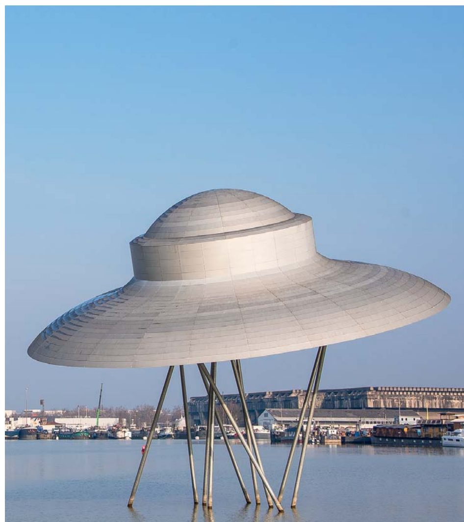
Una installazione contemporanea, simile ad un UFO Anni Sessanta, domina il panorama della "Nuova Bordeaux", che ha recuperato gli spazi del vecchio porto

alla scena artistica costantemente propositiva, alla prosperità universitaria coi suoi 65.000 studenti . Sono loro che, dalle 17 in avanti, terminate le lezioni, affollano bistrot, caffè e bar a vin. Il centro storico è di tale diffusa eleganza da essersi meritato, nel 2007, il riconoscimento come Patrimonio dell'Umanità per ben 347 edifici "classificati". I punti di forza per una bella passeggiata sono, senza dubbio: l'imponente cattedrale di Sant'Andrea , il Museo d'Aquitania e quello di Belle Arti , i tre chilometri di Rue Sainte-Catherine , il maestoso Grosse Cloche , antica porta della città medioevale, la basilica di San Michele , la piazza della Borsa , aperta verso le acque della Gironda, luogo culto della città, il Gran Teatro dell'Opera col suo colonnato infinito, degno di una vera capitale, la basilica di San Severo e il Ponte di Pietra . Aggiungiamo una perla minimalista – il Cinéma Utopia – che, all'interno di una piccola chiesa gotica, offre una programmazione d'essai in orari alternativi e inconsueti. Ma Bordeaux non finisce qui, perché questa non è certo una città museo. Nell'ultimo decennio l'area, ormai in disuso, dello storico porto del XIX secolo ha visto irrompere sulla scena quattro icone della contemporaneità, che collocano Bordeaux tra le città più avveniristiche d'Europa. La costruzione più visibile, e forse sorprendente, è quella del ponte a sollevamento verticale " Chaban-Delmas ", inaugurato nel 2012: