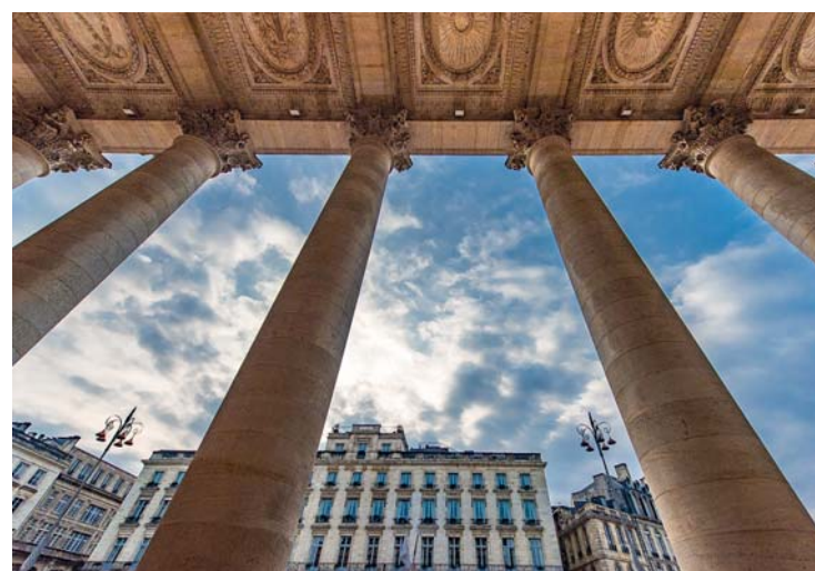
Uno scorcio dell'immenso colonnato che decora il grande Teatro dell'Opera, costruzione neoclassica di forte impatto architettonico che venne edificata a testimonianza della ricchezza cittadina

Una città è viva quando non smette mai di credere nel nuovo. Per Bordeaux è così da sempre, grazie alla sua anima commerciale, al dinamismo portuale dei secoli d'oro, alle visioni politiche di Chaban-Delmas ,