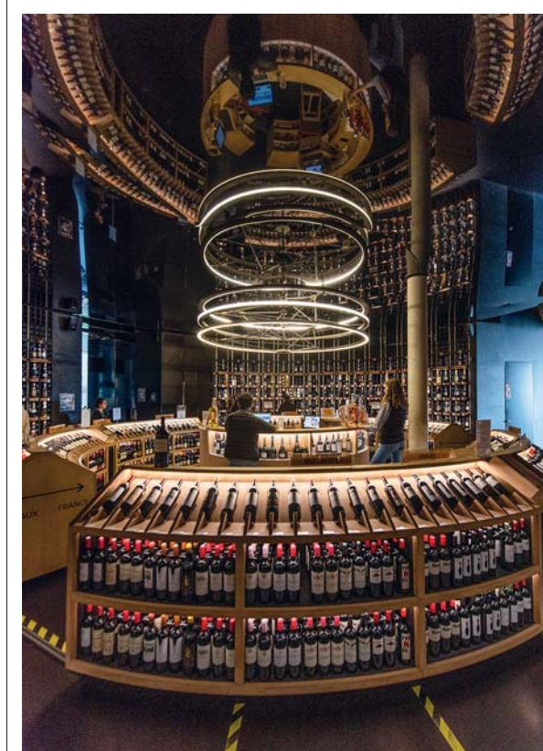
L'enoteca de La Cité du Vin ospita 800 etichette, la metà delle quali internazionali ed il rimanente francese. L'allestimento, teatrale e coreografico, nasce con l'obiettivo di valorizzare l'esposizione e i contesti territoriali