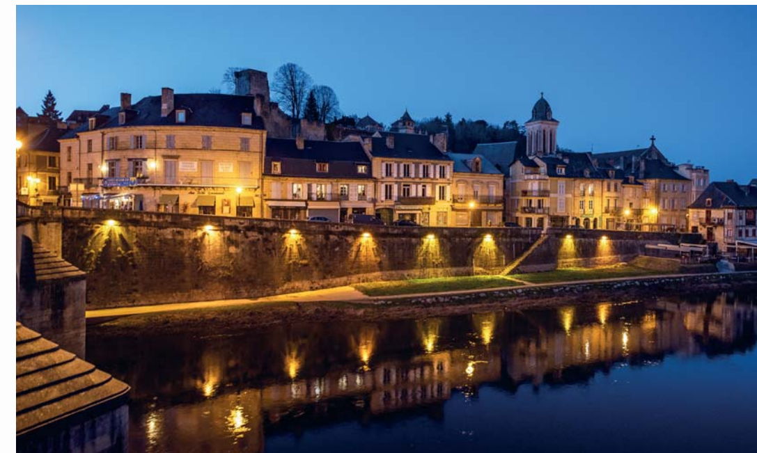
La Dordogna, un fiume lungo le strade della storia. Le sue acque hanno permesso insediamenti prosperi, di una bellezza che è rimasta intatta nei secoli. Dove l'arte e i giochi di potere ci hanno lasciato castelli, villaggi e incantesimi