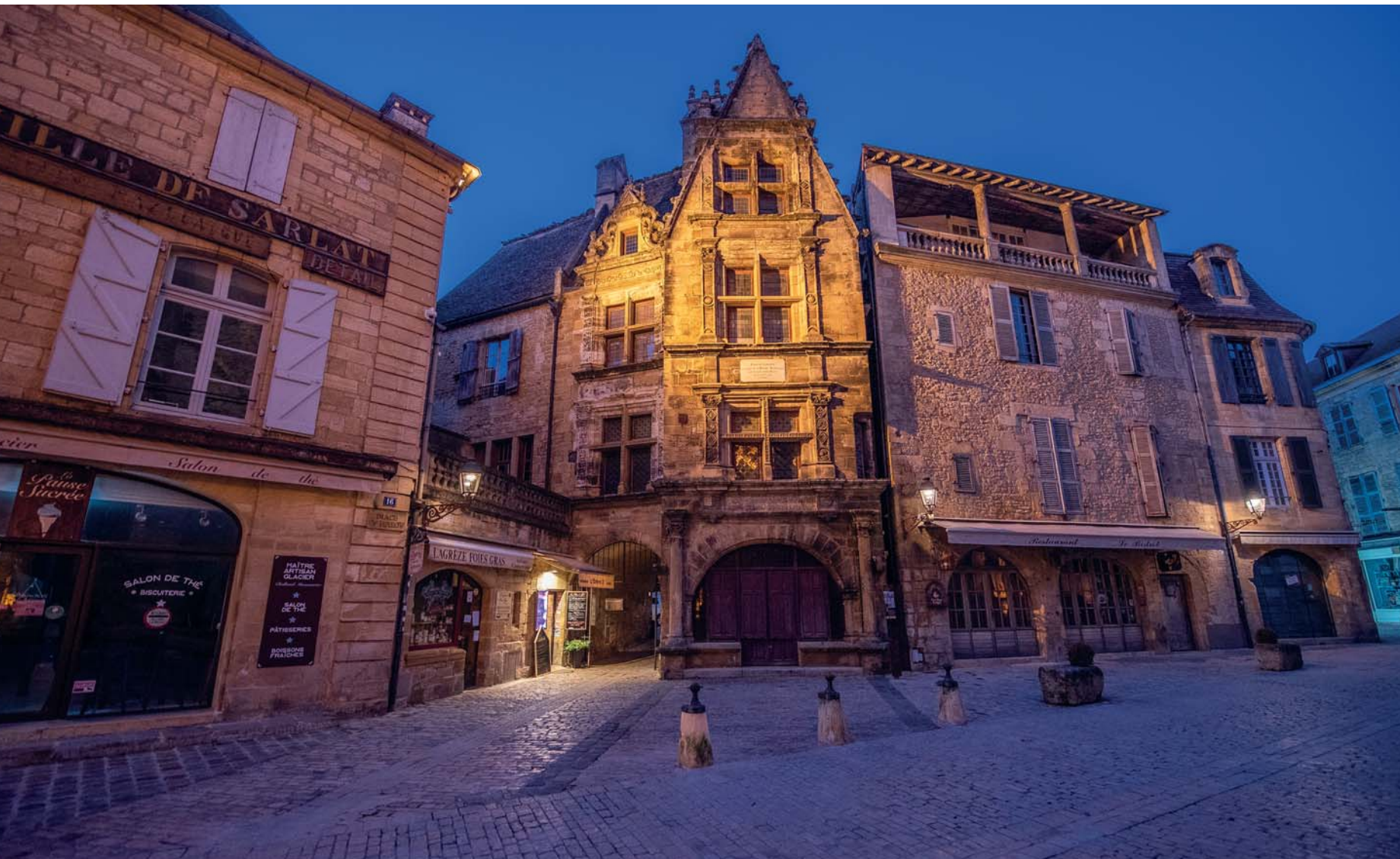
Il centro storico di Sarlat conserva intatto il suo fascino medioevale, una magia senza tempo. La capitale del Périgord Noir è il terzo set di Francia dopo Parigi e Nizza