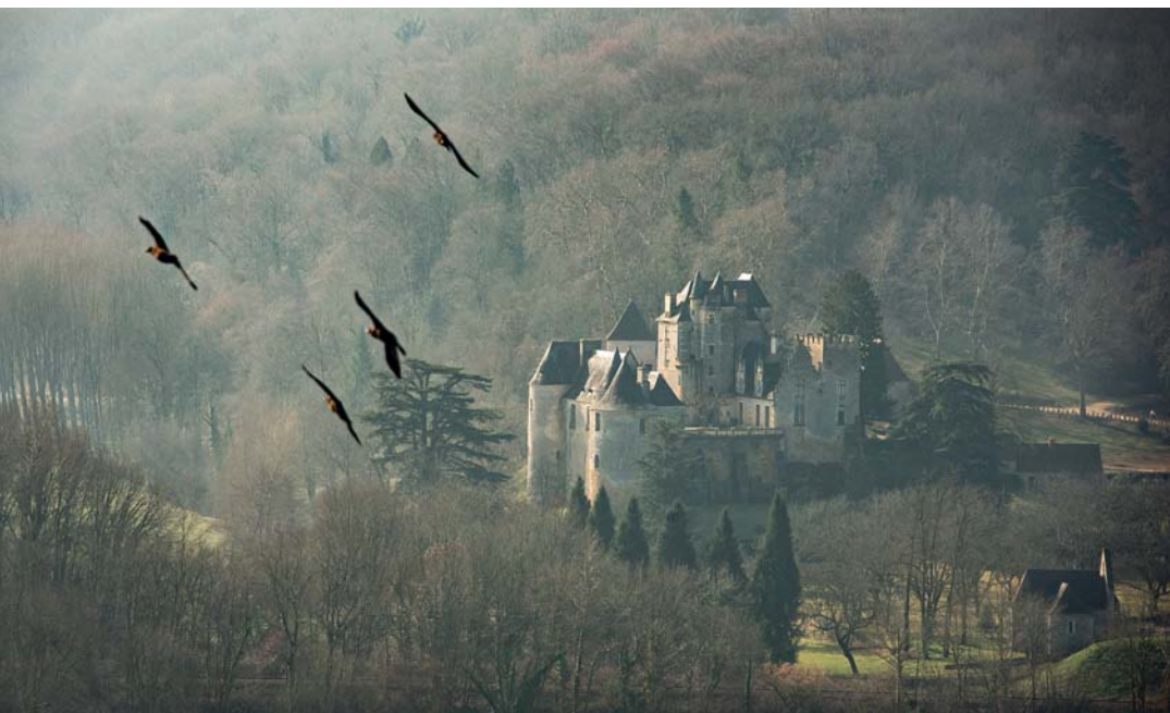
Il paesaggio della Dordogna, cuore della Nuova Aquitania, è punteggiato di castelli medioevali che evocano atmosfere guerresche e leggende senza tempo. Gli scenari cinematografici ideali per registi in rotta verso l'avventura

charme non mancano, tutti perfettamente connessi con l'ambiente – è la Maison du Bassin , tutta in legno, semplice e misteriosa come le case dei pescatori. In tavola le interpretazioni marine di Franck Le Bourlay , chef "oceanico" di tutto rispetto.