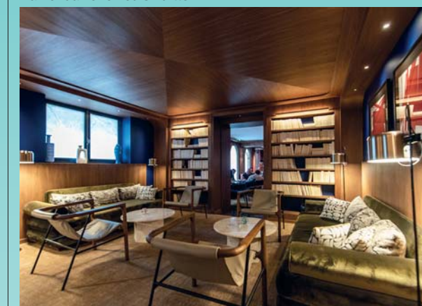
Il bar James Joyce al Pavillon Faubourg Saint-Germain &amp; Spa