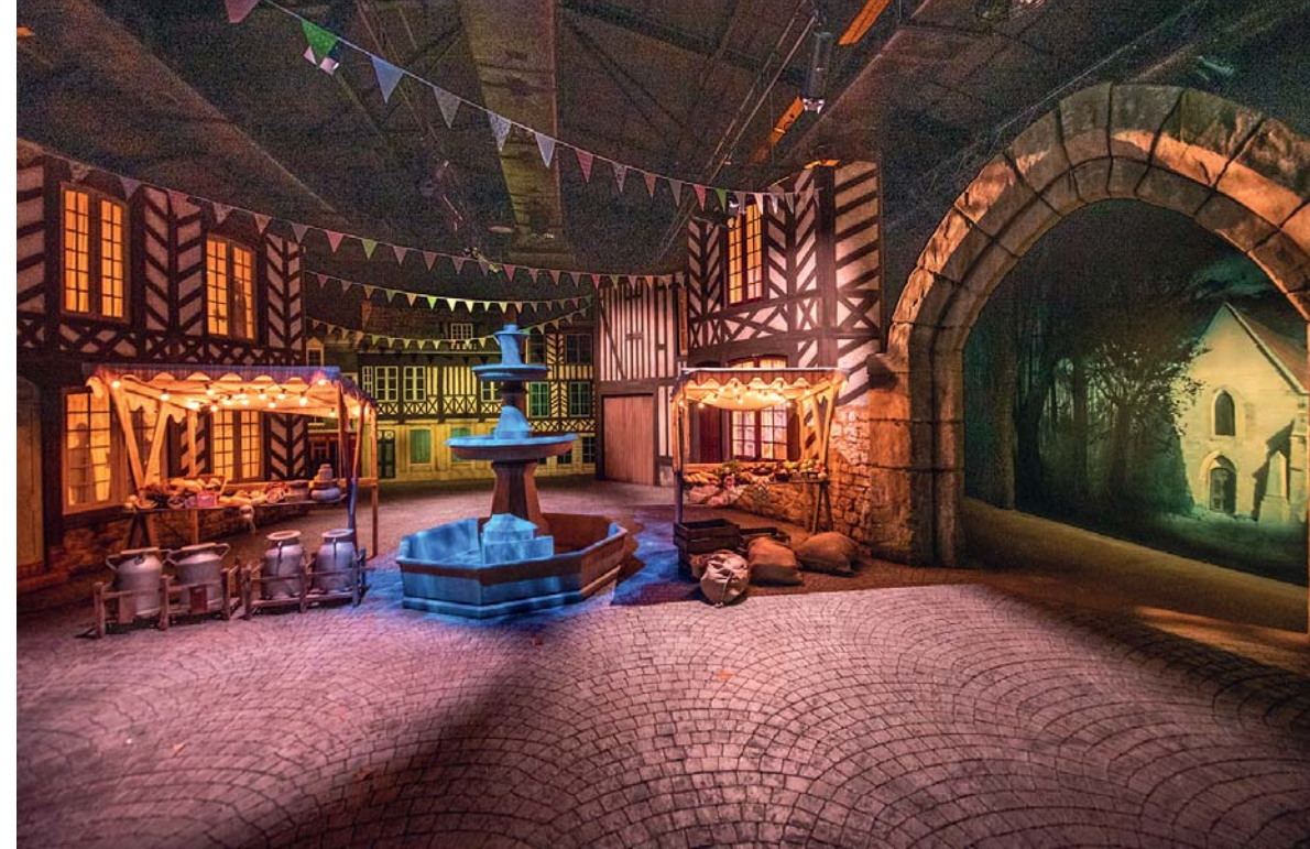
Le animazioni visive alla Calvados Père Magloire l'Experience