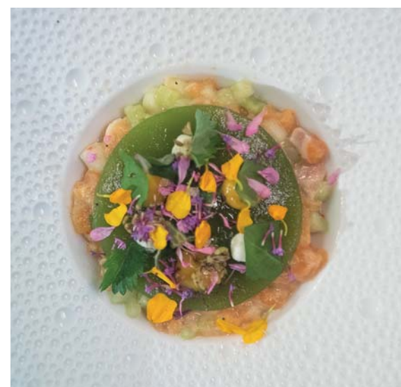
La cucina del Manoir de Surville