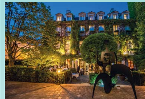
Anne in place Des Vosges