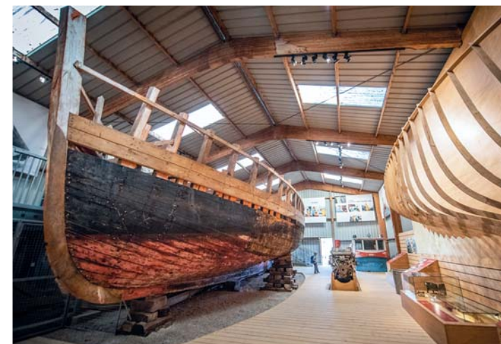
Il museo marino di Tatihou