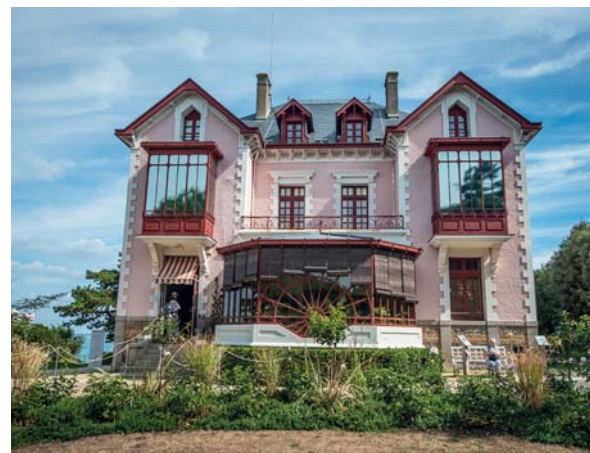
La Maison Dior sede del museo

Qui l'uomo fa un passo indietro, magari anche due, per guardare un posto dove né lui, né i suoi predecessori, c'entrano qualcosa. Cape de la Hague è il vertice del Cotentin; i villaggi, tranne rare e minuscole eccezioni, trovano posto all'interno, quasi avessero paura di un luogo che ricorda, in modo evidente, la fine del mondo: vertiginose falaise , piccole anse battute dal vento, un cielo che sembra non stare mai fermo, un mare dai colori continuamente cangianti, e poi vento, gabbiani, silenzio, il verde smeraldo dei boschi. Un paradiso geologico che espone anche le rocce più antiche di Francia, quelle di Jobourg. Potete percorrere il Capo a piedi, se siete allenati, o in auto, isolandovi