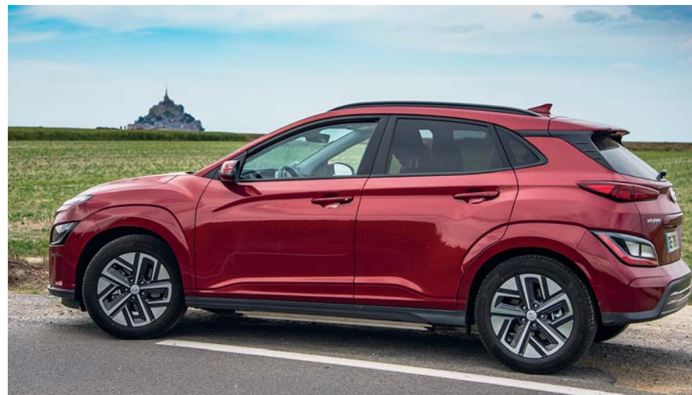
La Hyundai Kona elettrica del nostro viaggio

che ha sempre saputo dialogare con il padrone di casa. Fin dai tempi dei druidi, che adoravano le forze della natura e cercavano l'armonia, praticando un animismo identitario che è passato attraverso i secoli generando spirito di appartenenza. Per i celti, foreste, sabbie e maree non erano solo elementi del paesaggio, ma forme viventi da comprendere, adorare e tutelare. Sicuramente furono loro i primi ambientalisti europei. Noi abbiamo percorso il nostro itinerario all'insegna del "nuovo turismo", che non invade ma esplora, che cerca il bello nel piccolo e nel naturale, che privilegia i centri minori (ma incantati) in riva al mare, che seleziona gli approdi gourmet e gli hotel che hanno fatto scelte compatibili e sostenibili. L'auto – una Hyundai Kona ad alimentazione elettrica – si è sintonizzata perfettamente con il mood del nostro viaggio: silenziosa e potente, versatile alla guida, tecnologicamente avanzatissima, un SUV che parla la lingua del futuro, 484 chilometri di autonomia, che sono tanti ma non sempre abbastanza. Infatti per chi, come noi, non è avvezzo a questa alimentazione, si impone un dettagliato piano di bordo, indispensabile per "mirare" le colonnine del rifornimento, che non sono sempre universali e richiedono un lungo tempo di ricarica. Quindi, ad esempio, meglio fare l'operazione nottetempo in hotel. Adesso via, con un motore che corre ma non senti, è ora di partire.