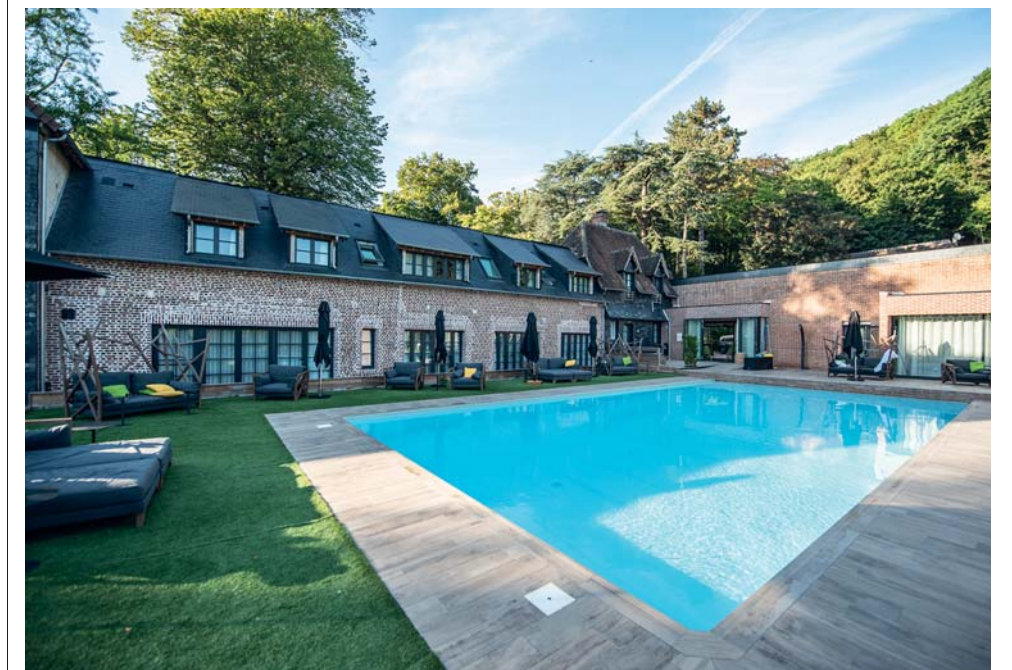
La piscina a le Jardins de Coppélia

invecchiamento. Qui si viene introdotti ai segreti della distillazione e poi si passa alla degustazione, ci si sente accolti in famiglia e si apprezza la magia di una tradizione dove il culto del prodotto è generato da un'attenzione ancestrale per ogni passaggio della lavorazione. Volete indugiare per godervi il panorama? Bene, i proprietari vi metteranno a disposizione cestini da picnic, a voi una sosta sull'erba color dello smeraldo.