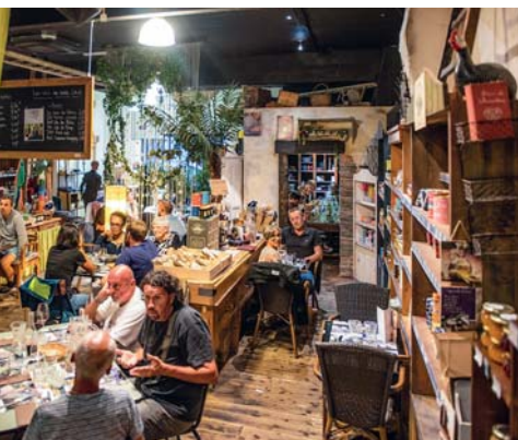
L'Armoire à Délices a Cherbourg

meglio. Li hanno scelti la marina francese e i presidenti della Repubblica. Il mio, giallo, è un antiveneto che posso mostrarvi nelle giornate di pioggia. Due approdi gourmet particolari per godervi il vostro soggiorno in città: L'Armoire à Délices, di fronte al porto, un emporio delle meraviglie dove tutto è in vendita e dove tutto si può gustare, formula tapas per esaudire la curiosità; Club Dinette, nella città vecchia, cucina del mondo in un bistrot per intenditori, goloso viaggio intorno all'asiette. Per la notte non si sbaglia con l'Hotel Mercure Cherbourg Centre Port. Le grandi vetrate verso il mare scendono fino a terra, ogni stanza sembra la cabina di un transatlantico pronto a salpare.