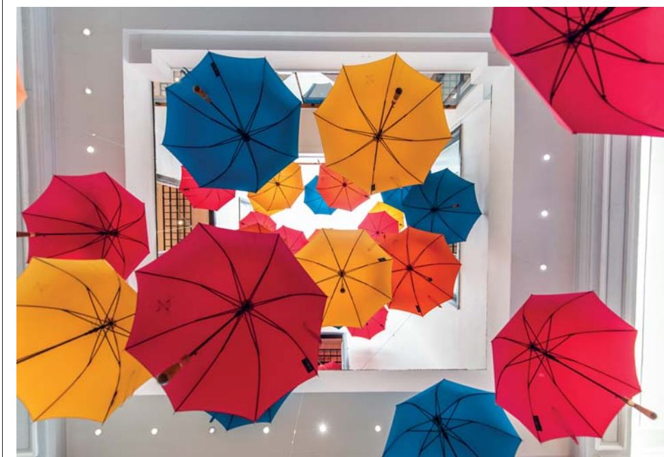
Les Parapluies de Cherbourg