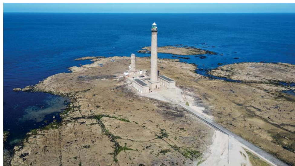
Il faro di Gatteville