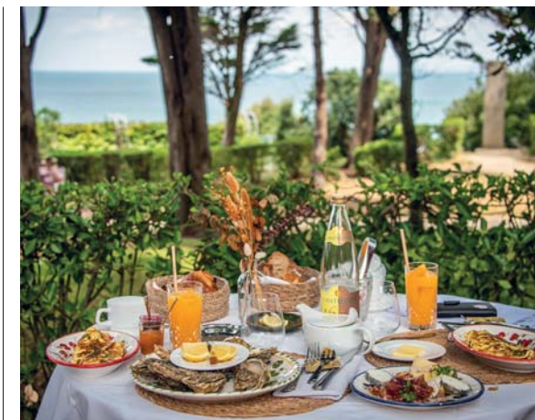
Il brunch a Maison Dior

Forse non esiste luogo al mondo paragonabile a Mont Saint-Michel. Il fascino del contesto – un grande specchio d'acqua, reso quotidianamente mutevole dalle maree, che circonda un isolotto tidale – la bellezza di un edificio religioso tutto proteso al verticale, gli stili che spaziano dal romanico al gotico fiammeggiante, i bastioni che circondano il complesso serrandolo e proteggendolo, compongono una somma che moltiplica ogni fattore. Così il tuo sguardo osserva ogni aspetto, ma resta rapito solo dal suo insieme, che ti soggioga, anche se l'hai già visto più volte. Scrive Gérard Dalmaz: «La visione sorge da un satellite surrealista, un reliquiario gigantesco in una solitudine orgogliosa, come un'immagine fuggita da un fumetto di fantascienza. Su questo universo brutalmente minerale, dei servi del Padreterno hanno eretto la loro fortezza della fede consacrata al Principe delle milizie celesti, l'arcangelo San Michele: il cavaliere del bene contro il male, che ha sconfitto il drago, Satana, il Principe dei demoni». Se scegliete uno degli hotel nell'ultimo tratto percorribile con l'auto, sarete subito pronti ad accedere alla meraviglia utilizzando le navette elettriche gratuite. Si può anche fare il percorso a piedi, bellissimo, però occhio alle maree. Noi abbiamo soggiornato all'Hotel Gabriel, basico ma comodo. Cena eccellente all'ottimo Le Pré Salé, che contraddice ogni luogo comune sui ristoranti turistici: impeccabile cucina di mare e di terra, coquillage sfarzoso.