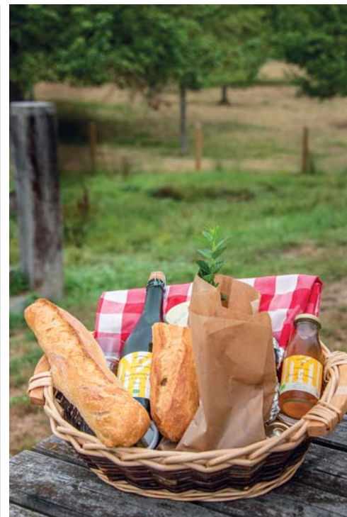
Il picnic di Manoir d'Apreval