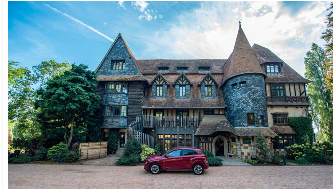
Le Jardins de Coppélia