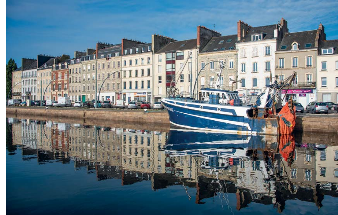
I quai di Cherbourg

È nato prima l'uovo o la gallina? In questo caso la gallina (ossia il film): era il 1963 quando Jacques Demy realizzò (con le musiche immortali di Michel Legrand)