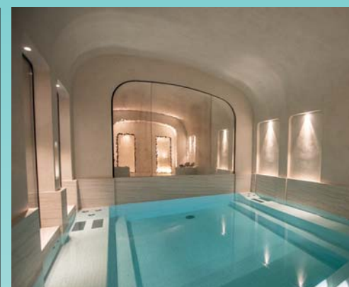
La piscina del Pavillon Faubourg Saint-Germain &amp; Spa