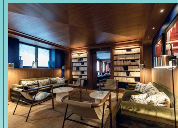
Il bar James Joyce al Pavillon Faubourg Saint-Germain &amp; Spa