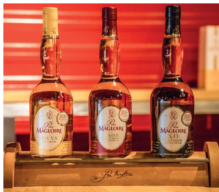
I grandi Calvados di Père Magloire