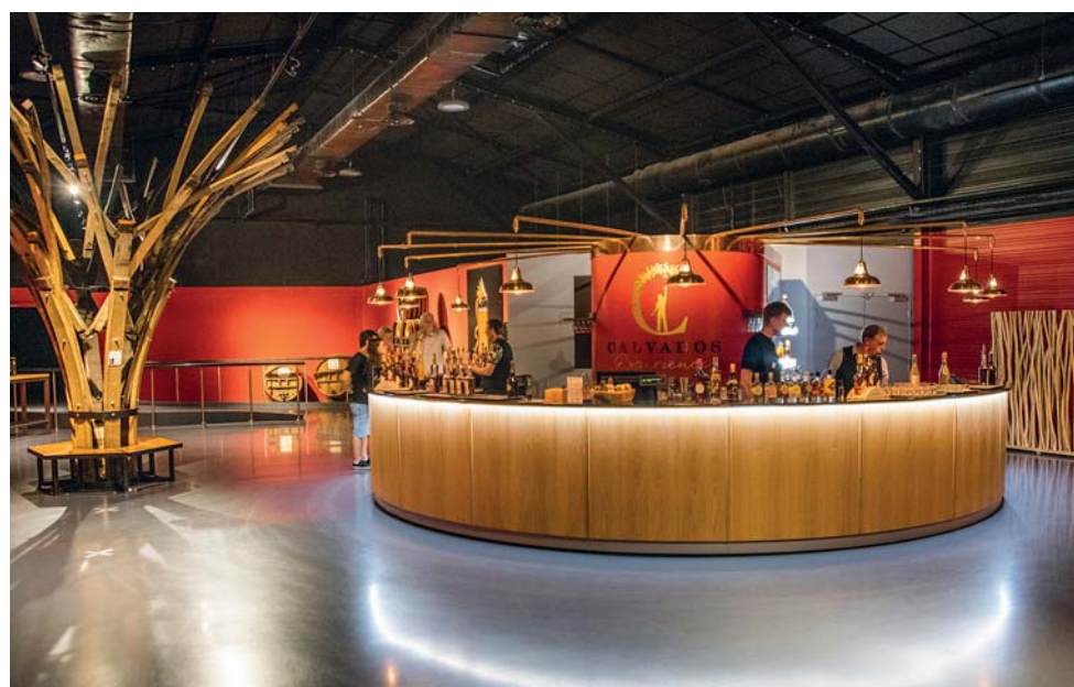
La Calvados Père Magloire l'Experience

La via del ritorno offre ancora tre incantesimi. Il primo è a Pont-l'Évêque – si direbbe un festival delle case a graticcio – dove l'Auberge de la Touques, dimora di origine medioevale, inscena una cucina di carne dagli accordi ancestrali: agnello presalé, foie gras, golosa palette di formaggi normanni... Nelle vicinanze ha sede la Calvados Père Magloire l'Experience, una sorta di museo interattivo, sorprendente e spettacolare, dedicato al Calvados e alla sua storia. Si conclude con una degustazione delle diverse referenze che vi farà toccare il cielo con un dito. L'ultima tappa è la migliore. Il Manoir de Surville è una struttura pluripremiata, con la Chiave Verde per il Turismo Sostenibile e il Rispetto dell'Ambiente e con le Tre Stelle per la cucina eco-responsabile, riconoscimenti anche per l'accoglienza ai ciclisti. Tutto meritato, ma qui si va oltre: cortesia e attenzione in ogni dettaglio, due ettari di giardino, una dimora del XVI secolo dove le stanze sono appartamenti arredati con gusto fuori dal tempo, la sala biblioteca con caminetto che sembra uscita da un libro di arredamento, la piscina riscaldata che è una vera delizia. Per la cucina difficile trovare aggettivi, basti dire che è