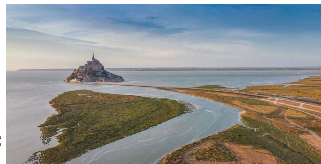
Mont Saint-Michel, prospettiva dal drone