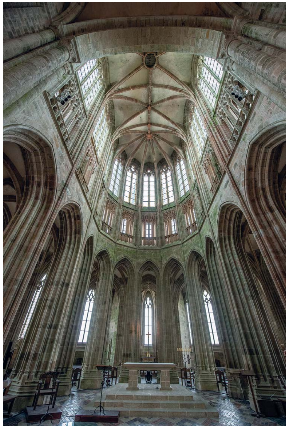
La navata centrale dell'abbazia di Mont-Saint-Michel