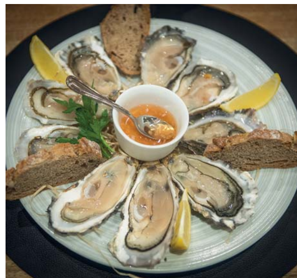
Le ostriche del Cotentin