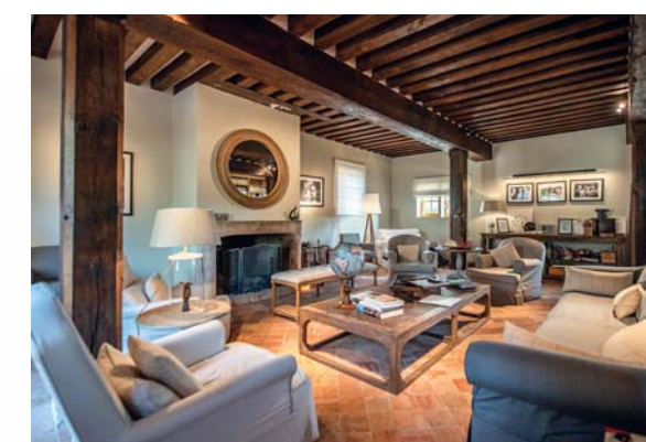
La sala biblioteca al Manoir de Surville