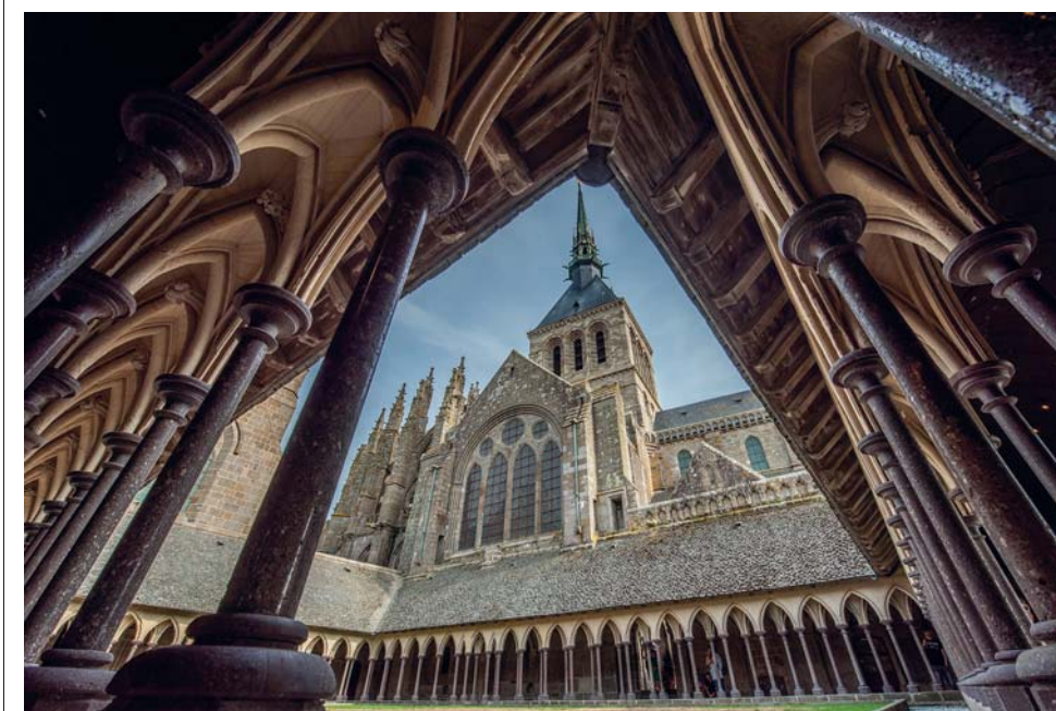
Il chiostro dell'abbazia di Mont Saint-Michel