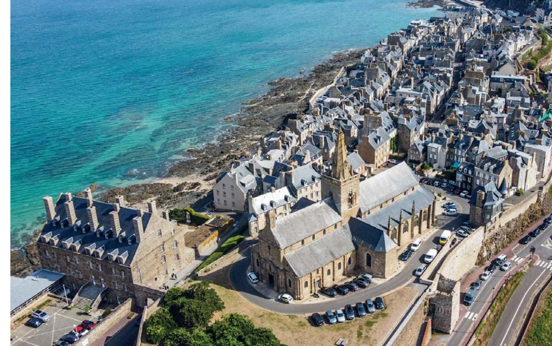
Prospettiva aerea di Granville