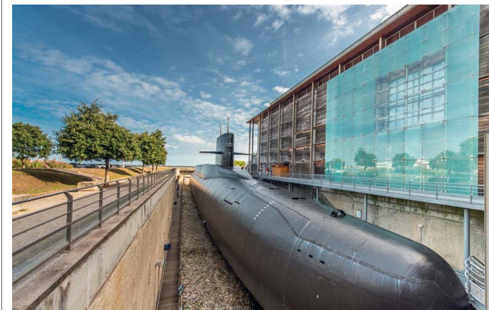
Il sottomarino Le Redoutable