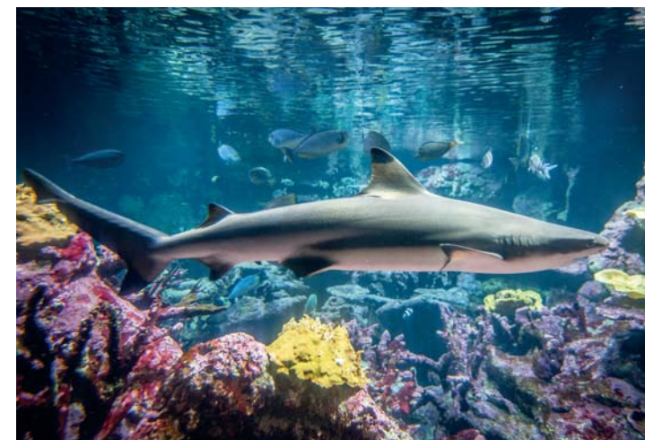
L'acquario della Cité de La Mer