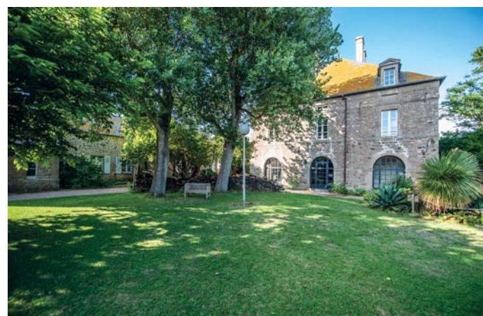
L'hotel di Tatihou ricavato dall'ex lazaretto

museo marino e un hotel dove la notte – gustate le superbe ostriche del litorale – ci si immerge in un silenzio assoluto, unici ospiti di un'isola incantata. Rientrati sulla terra ferma, il consiglio è di indugiare tra le vie di Saint-Vaast-la-Hogue, classificato "Uno dei più bei villaggi di Francia". Imprescindibile approdo gourmet il ristorante La Chasse Marée (cacciatore di maree, il battello che setaccia i fondali alla ricerca di coquillage). Qui, oltre alle "ostriche assolute", regina della casa è la choucrute normanna, indimenticabile enciclopedia marina per buongustai impavidi.