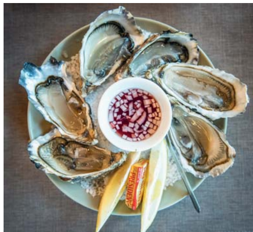
Ostriche e pescato, le icone della cucina normanna