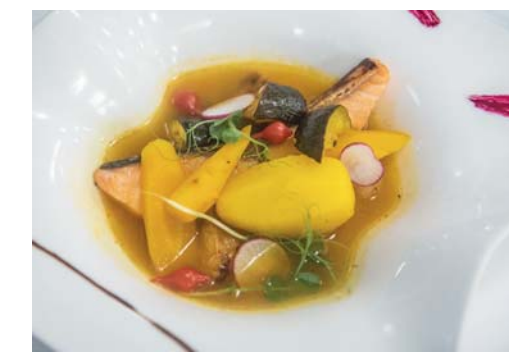
La cucina di Le Pré Salé