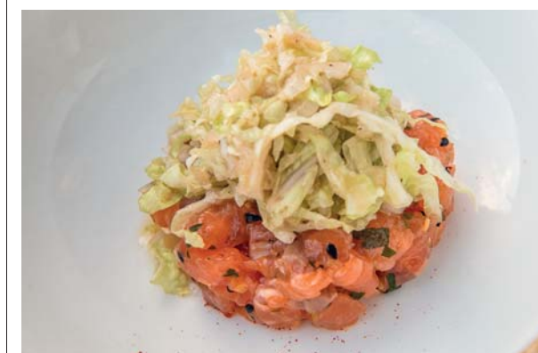
La cucina di Le Capucine

invecchiamento. Qui si viene introdotti ai segreti della distillazione e poi si passa alla degustazione, ci si sente accolti in famiglia e si apprezza la magia di una tradizione dove il culto del prodotto è generato da un'attenzione ancestrale per ogni passaggio della lavorazione. Volete indugiare per godervi il panorama? Bene, i proprietari vi metteranno a disposizione cestini da picnic, a voi una sosta sull'erba color dello smeraldo.