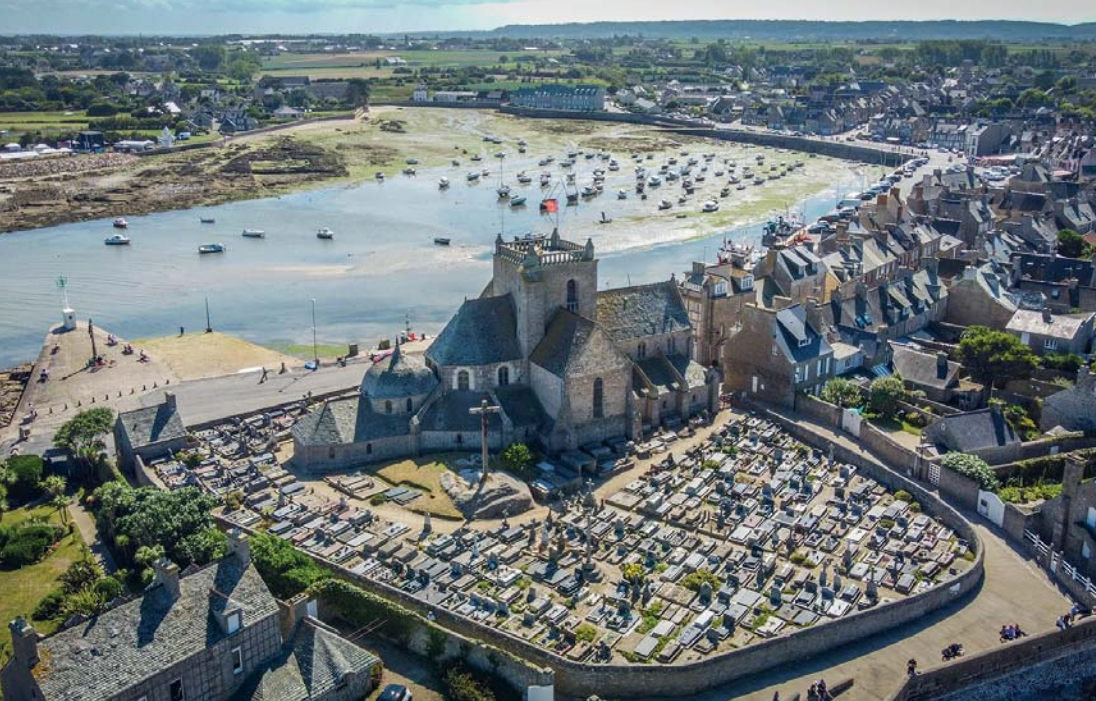
Barfleur osservata dal drone