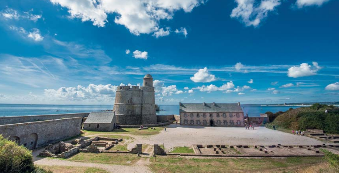
Il nostro drone all'isola di Tatihou

mento iconico è l'inespugnabile Fort Vauban (patrimonio UNESCO), edificato dall'altro lato dell'isola dopo la battaglia di La Hogue, che oppose la flotta francese agli anglo-olandesi. La storia di Tatihou è un romanzo d'appendice, dove si sono avvicendati i primi uomini della terra, i celti, i romani e i vichinghi. I francesi la usarono come guarnigione e come lazaretto ai tempi della peste, poi come asilo per i rifugiati della guerra civile spagnola, dopo ancora come carcere minorile. Infine la recente decisione di allestire un fascinoso