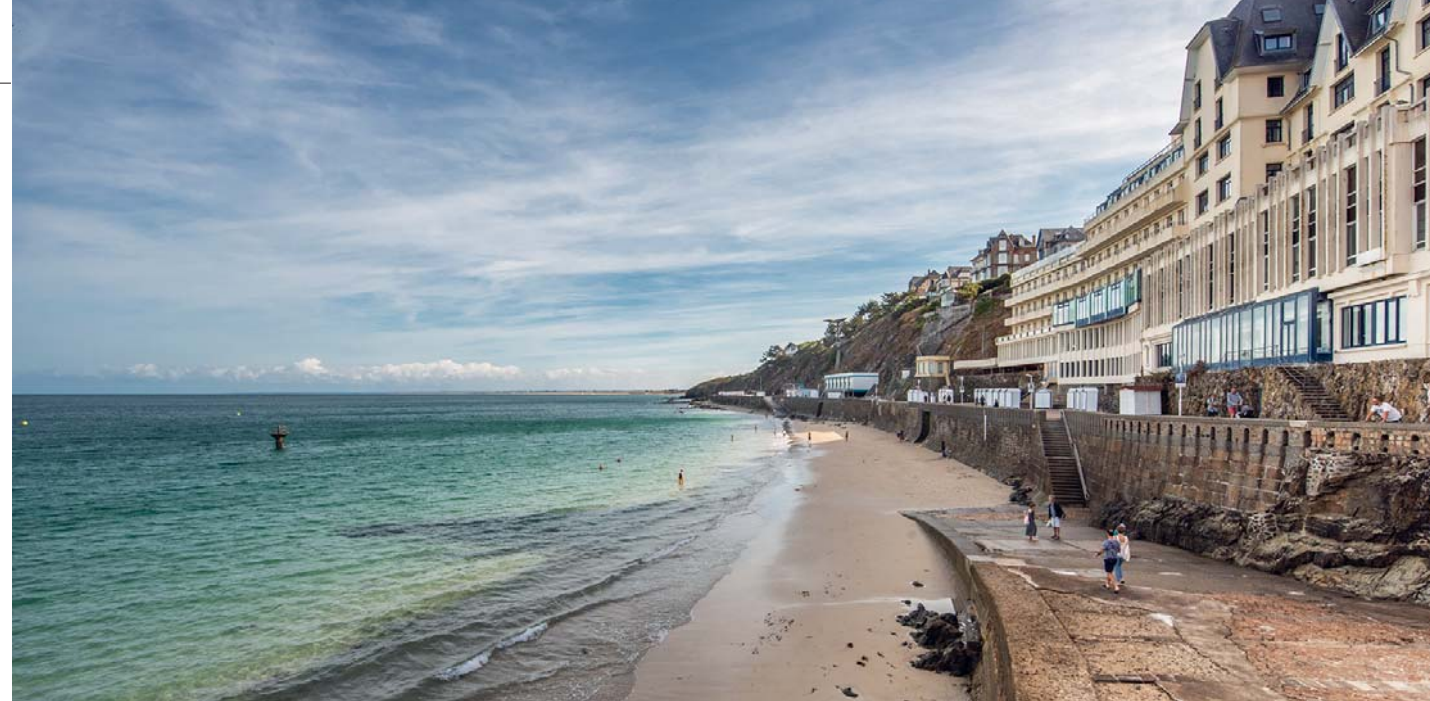
I quai di Granville