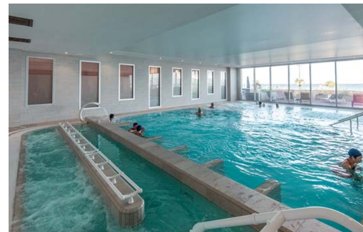
La piscina del Prévithal Hotel

A Donville-les-Bains si trova Il Prévithal Hôtel de la Baie Thalasso Spa, luogo ideale dove offrirsi una pausa di pieno relax: trattamenti talassoterapici sotto stretto controllo sanitario, massaggi, grande piscina coperta con acqua marina, ma anche ristorazione gastronomica di livello e pregiate referenze enologiche. Si riparte per esplorare Granville, vera tappa sorprendente: organizzata su uno sperone roccioso, comprende una città alta (la parte più antica) e i due lati di quella più bassa, che scendono entrambi verso il mare. Se lungo i quai del porto l'atmosfera è vivace e trafficata, salendo, tra le belle case del XV e XVI secolo, domina la quiete. Approdati ai bastioni, si può visitare il raffinato Museo d'Arte Moderna, con belle esposizioni temporanee. A pochi chilometri si trova una palazzina consacrata alla bellezza: l'abitazione d'infanzia di Christian Dior (nato a Granville nel 1905), personaggio emblematico della moda mondiale che qui, nel meraviglioso giardino di fronte al mare, ebbe probabilmente le sue prime ispirazioni. L'edificio oggi è un museo che ripercorre – con eleganti esposizioni temporanee – i temi cari a Dior, ma c'è di più: per una completa esperienza immersiva, la caffetteria del giardino offre menu gourmand e il rito del brunch.