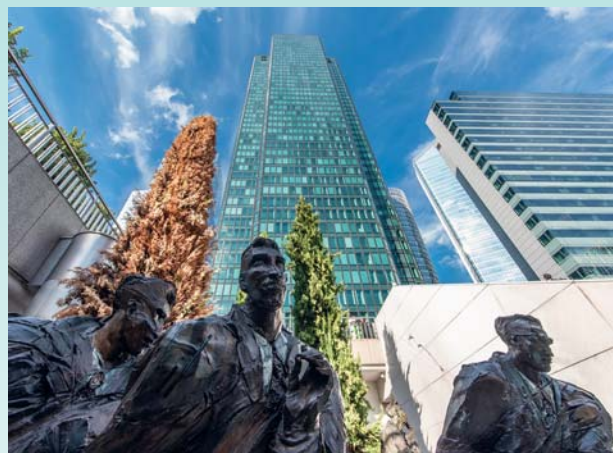
Lo skyline di Parigi

Parigi rappresenta alla perfezione il concetto di "città mondo", che non ha bisogno di inseguire eventi ad alta rilevanza per richiamare i viaggiatori. Parigi è essa stessa un evento ad alta rilevanza, e per tornare a sceglierla non c'è bisogno di individuare una ragione a priori. Anzi, è opportuno fare il contrario, dopo aver deciso il soggiorno si iniziano ad esplorare le diverse opportunità, certi di non restare mai delusi.