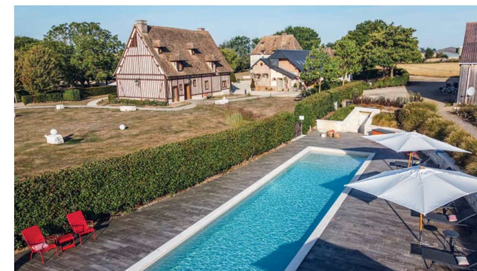
Il Manoir de Surville