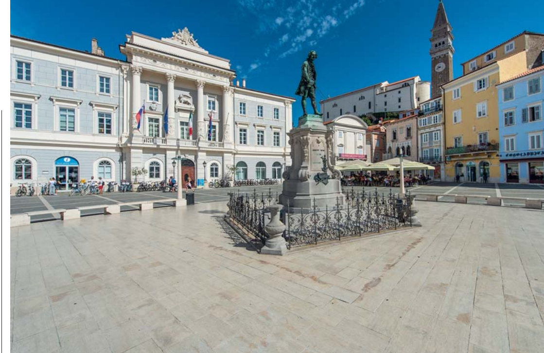
Piazza Tartini a Pirano

La storia di Pirano inizia con la fine dell'Impero Romano, e si narra che la città venne fondata – come Venezia – dagli abitanti di Aquileia, in fuga di fronte agli Unni. Durante l'epopea veneziana, tra il 1283 e il 1797, la città visse la sua fase di massimo splendore,