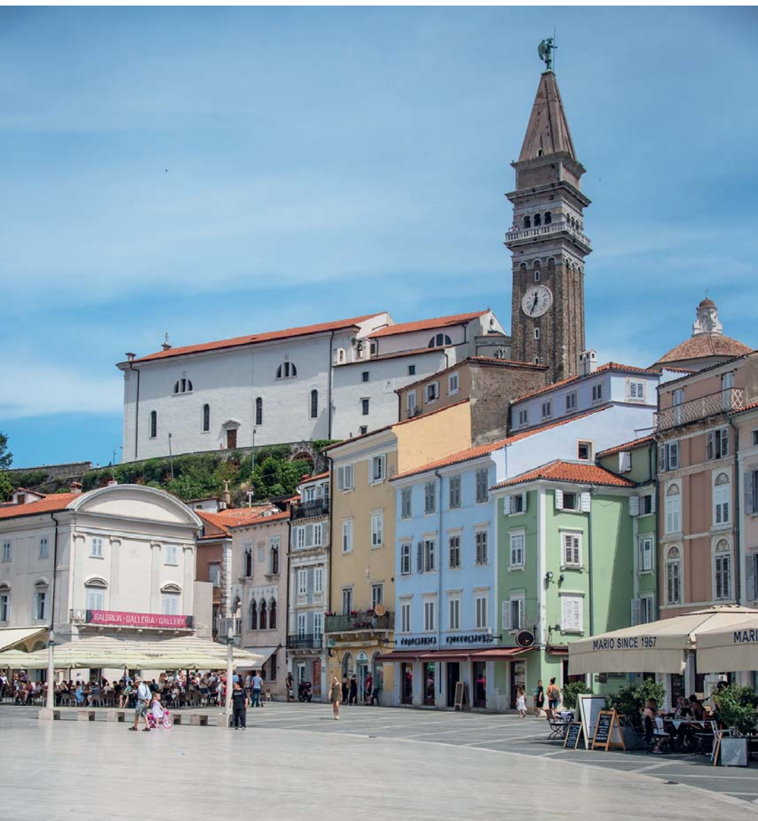
Pirano: il campanile di San Giorgio, riproduzione di quello di San Marco