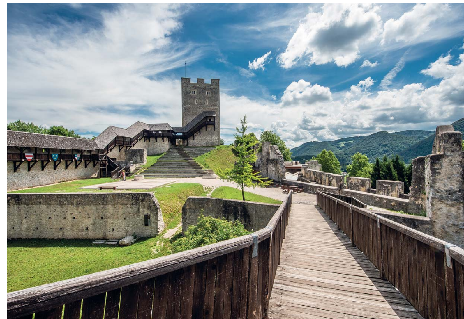
Il castello di Celje