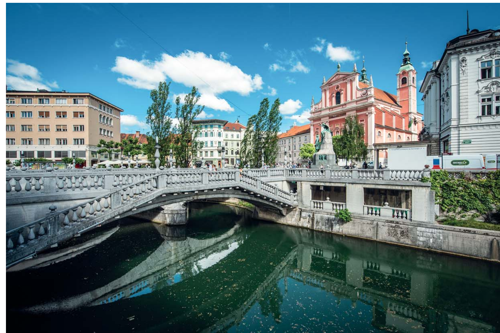
Lubiana: il Triplice Ponte

Ma quanto è bella Lubiana! Elegante di una bellezza asburgica ravvivata da tonalità mediterranee, di un'indolenza parigina lungo le rive del suo fiume, sormontata dal castello come in un libro di fiabe, vivacissima e contemporanea nei suoi quartieri più giovani, capitale che diventa villaggio appena si lascia il centro storico, verdissima e sostenibile con ben 16 ettari di pedonalizzazione, e ancora teatri, parchi, un festival estivo di levatura internazionale, un ben organizzato circuito museale. Quando si afferma che le città ideali del continente hanno tra i 200mila e i 400mila abitanti è d'obbligo pensare alla capitale slovena: 293mila e tutto va bene. Ma noi iniziamo dal drago, che, visti i presupposti, non è solo totem ma amuleto efficacissimo. La leggenda narra che Giasone, dopo aver rubato il vello d'oro al re Aites, fuggì sulla nave Argo attraverso il Mar Nero fino al Danubio. Proseguendo il suo viaggio giunse al fiume Ljubljanka, nel luogo dove oggi sorge la capitale. Gli abitanti implorarono il