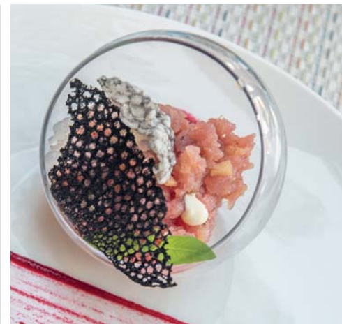
La cucina dell'Istrian bistro &amp; Tapas bar