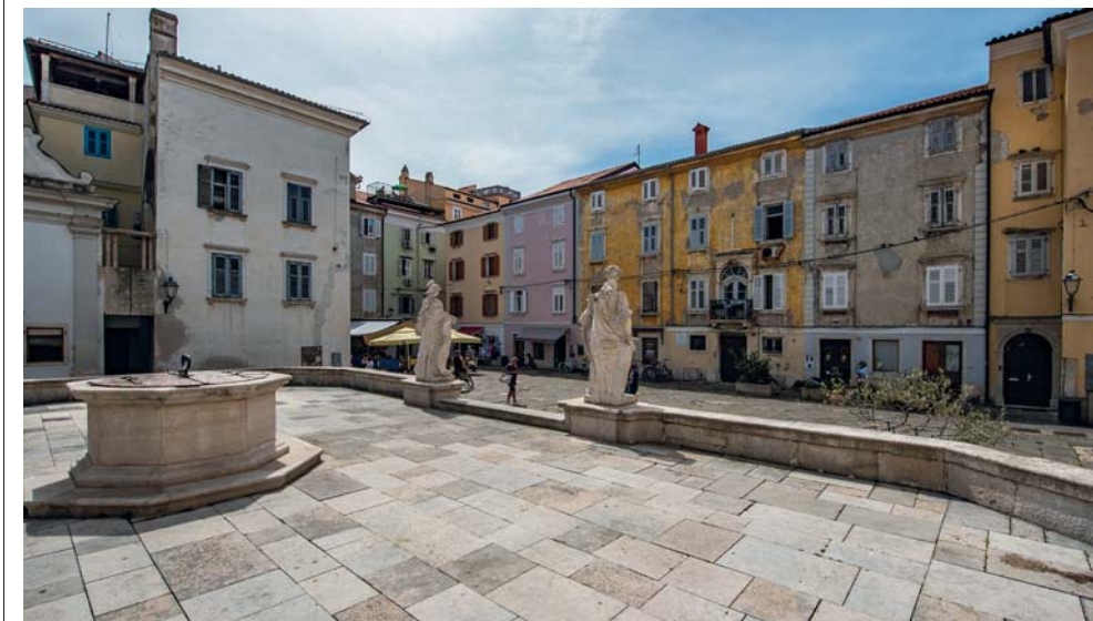
La quiete e l'eleganza del centro storico di Pirano