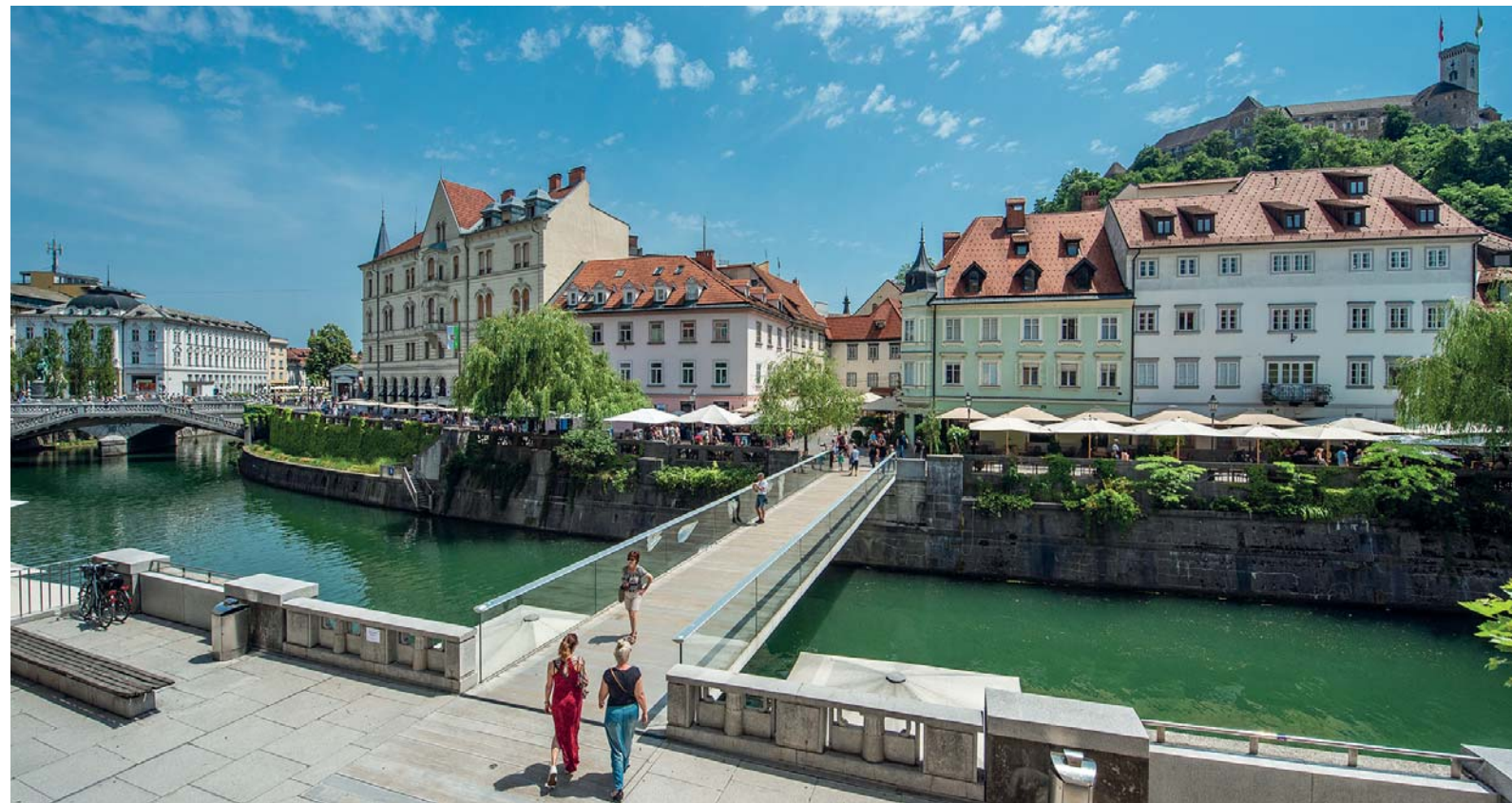
Lubiana: le rive del Ljubljanica