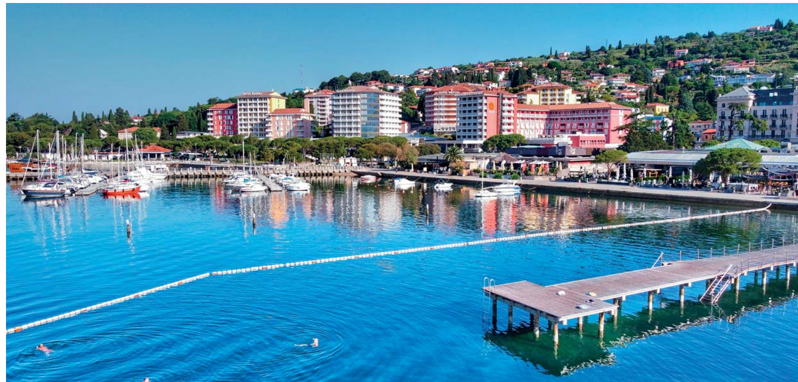
La baia di Portorose