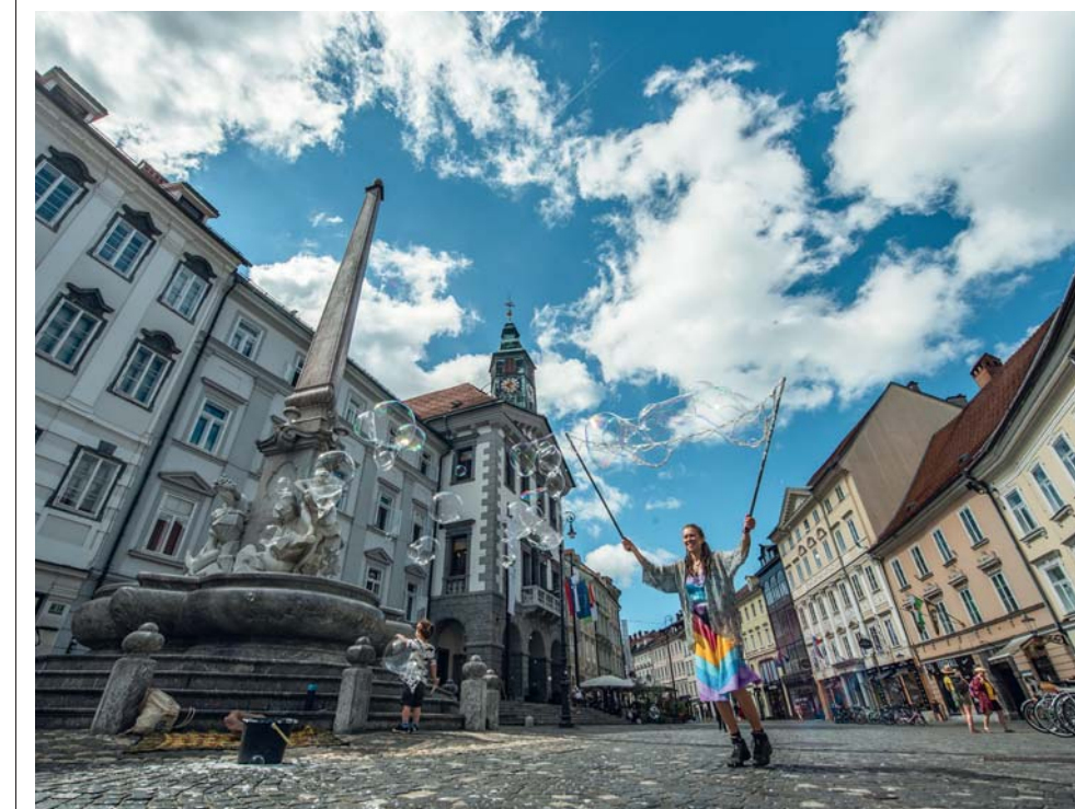
Il centro storico di Lubiana

suo aiuto, vivendo oppressi da un drago che ogni anno imponeva il sacrificio di una fanciulla. Giasone uccise il drago per poi riprendere il cammino verso l'Adriatico e la Grecia, meta finale. Nel tempo sono cambiati i valori simbolici: da mostro la creatura ha progressivamente assunto il significato di talismano e protettore. Oggi il drago si pavoneggia nelle imponenti