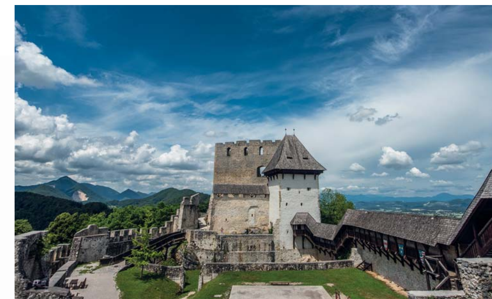
Il maniero di Celje domina la vallata