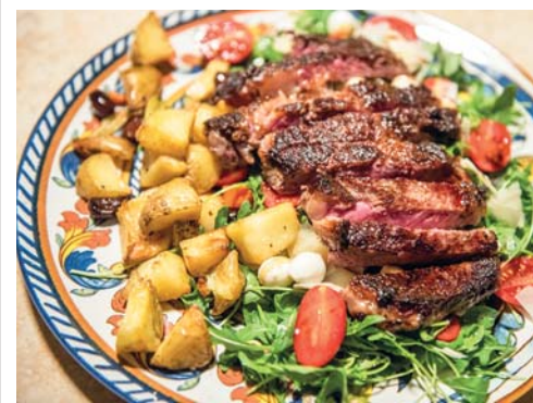
La grigliata di Na Burji