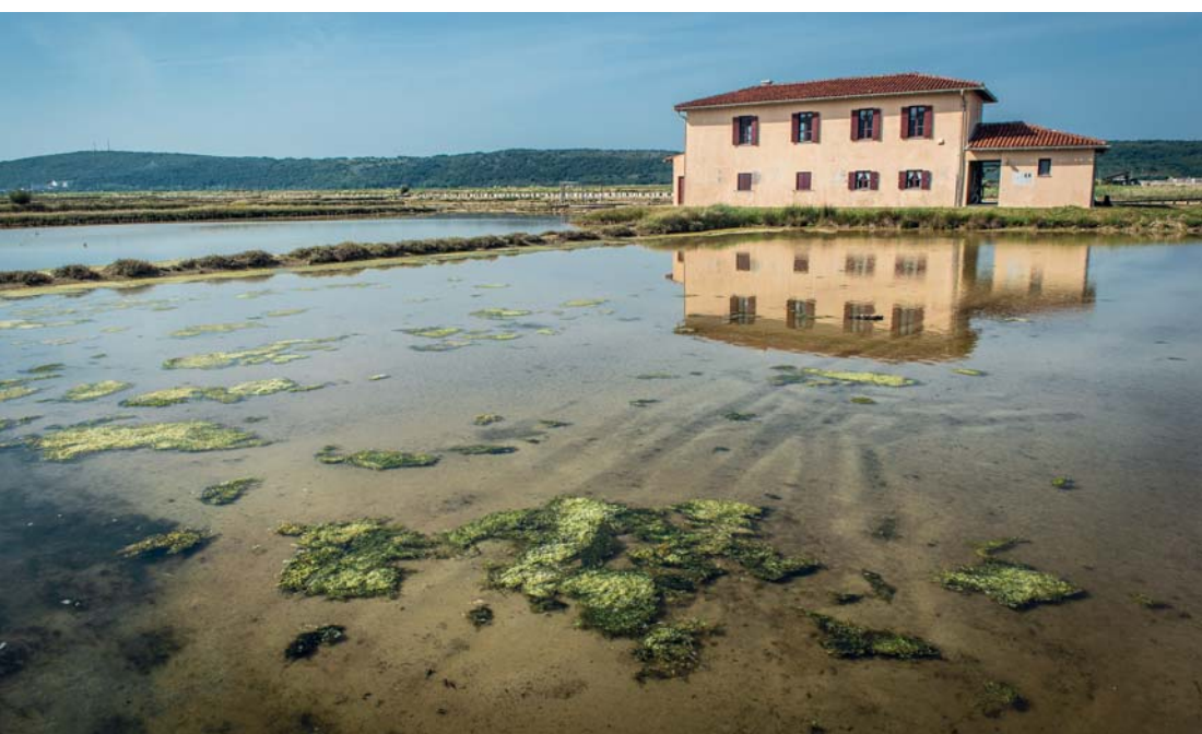
Sopra e a destra le saline di Sicciole