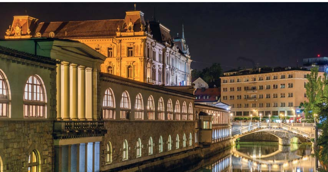
Lubiana: l'illuminazione notturna del mercato ittico

statue del ponte a lui dedicato, tra i luoghi più visitati del centro cittadino. Lubiana è una città fluviale per eccellenza, le sue prospettive migliori si colgono dalle due rive del Ljubljanica, presidiate da decine e decine di caffè e ristoranti. Una prospettiva che cambia dimensione lasciando il centro, con il castello alla nostra sinistra, per arrivare allo Hradeckega Most, dove la capitale diventa villaggio bohémien e molte case hanno il proprio orto privato. Le ragioni di una visita a Lubiana compongono un panel di sicuro interesse: la Cattedrale barocca di San Nicola e il suo interno in marmo rosa, la Biblioteca Nazionale e Universitaria (il suo motto: «Non conta tanto il sapere, ma ciò che farai col sapere»), con la sua scalinata in marmo scuro dalle 32 colonne; il Triplice Ponte che sembra progettato da Escher (mentre invece è di Plečnik), il romantico Parco Tivoli di 510 ettari, il quar-