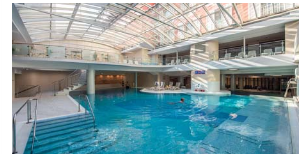
La piscina del Grand Hotel Portorož