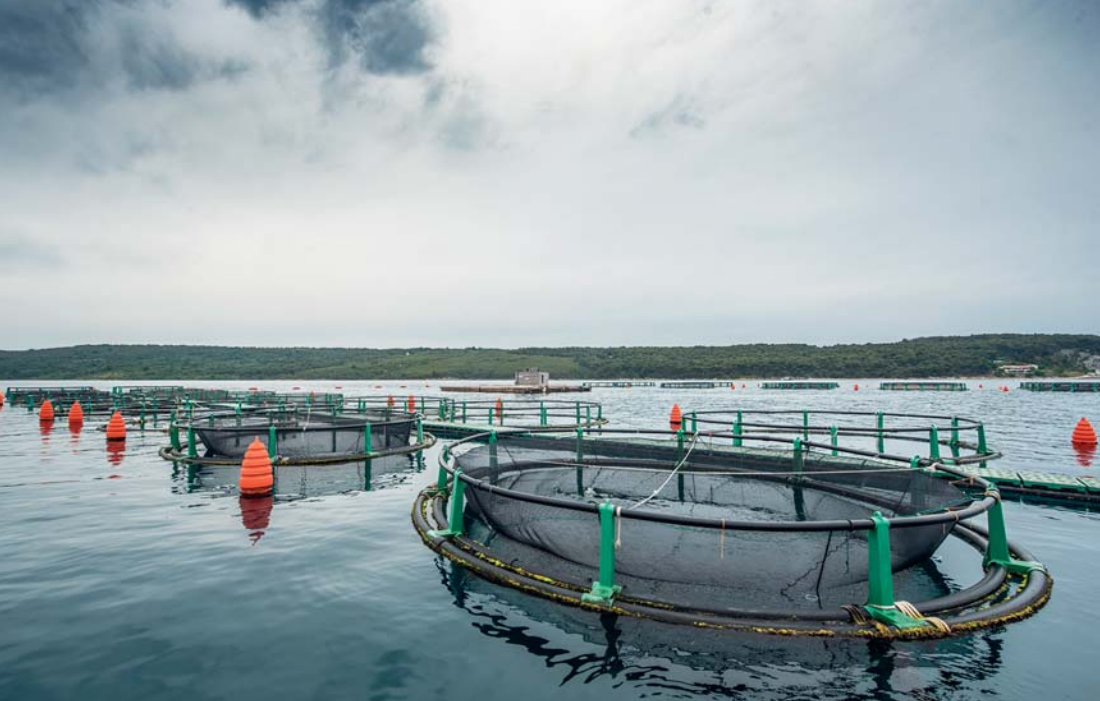
La tenuta Fonda