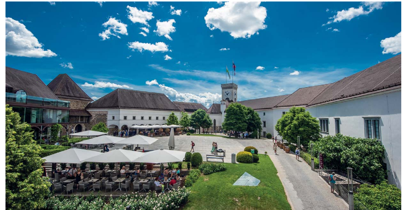
La corte del castello di Lubiana