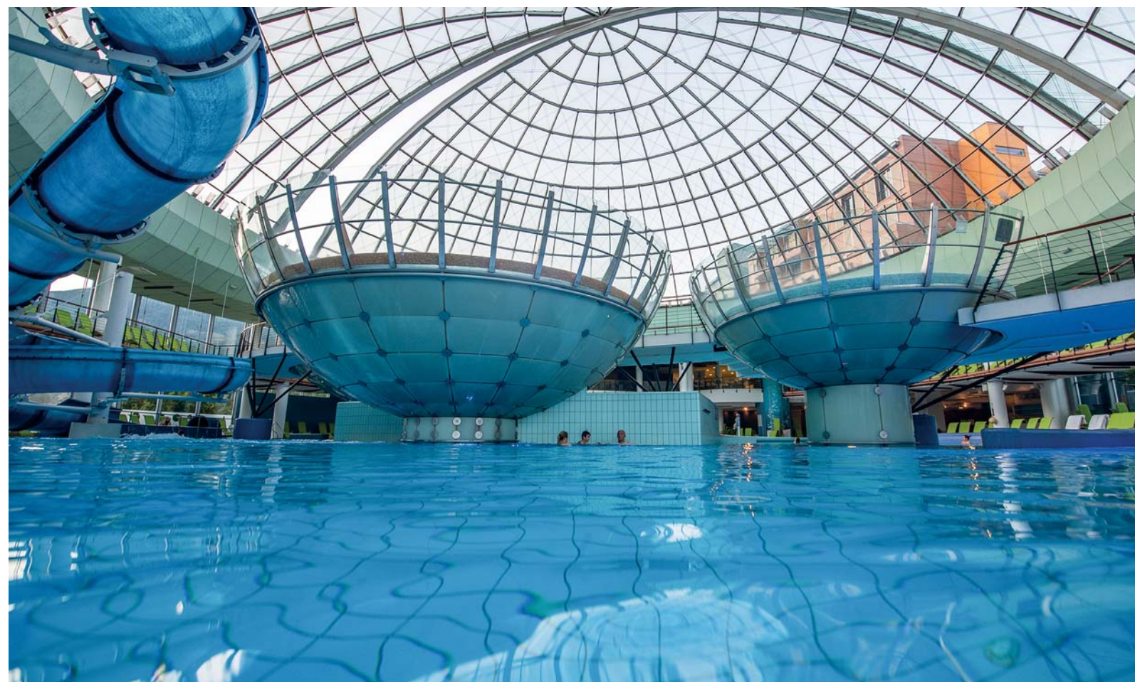
La grande piscina del Thermana Laško con le Whirlpool sopraelevate