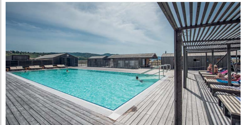
La Thalasso Spa Lepa Vida