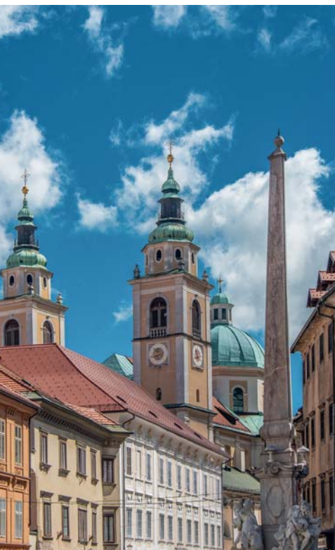
Le cupole di Lubiana