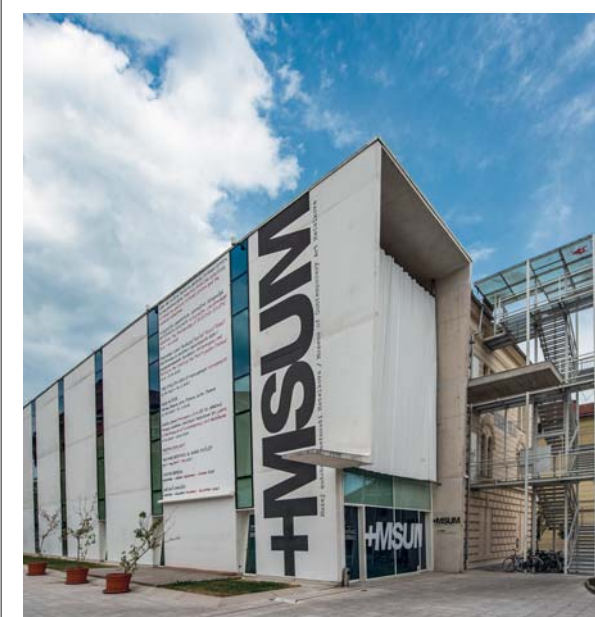
Lubiana: il museo d'arte contemporanea