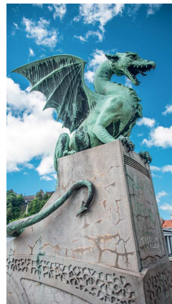
Il drago domina il suo ponte

suo aiuto, vivendo oppressi da un drago che ogni anno imponeva il sacrificio di una fanciulla. Giasone uccise il drago per poi riprendere il cammino verso l'Adriatico e la Grecia, meta finale. Nel tempo sono cambiati i valori simbolici: da mostro la creatura ha progressivamente assunto il significato di talismano e protettore. Oggi il drago si pavoneggia nelle imponenti