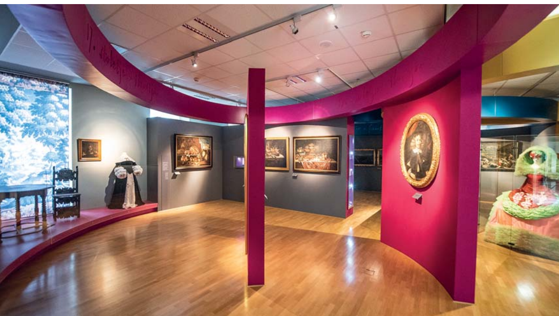
Le sale del Museo Etnografico Sloveno