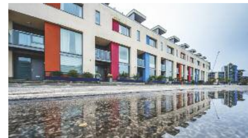
Bristol: giochi d'acqua ad Harbourside