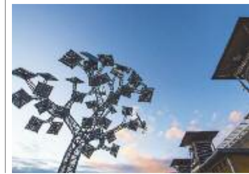
Bristol: l'albero di metallo ad Harbourside

particolare attenzione. Quella testata a Bristol è in assoluto tra le più originali: sul tetto della Brooks Guesthouse ( www.brooksguesthousebristol.com ), a due passi dal trafficatissimo mercato di St Nicholas, si trova un piccolo villaggio di roulotte anni Cinquanta, portate lì chissà come dai proprietari. Sono le rooftop caravan , scintillanti di metallo argentato e arredate come una piccola, confortevole camera d'hotel. Spazi ridotti ma ogni comfort, e in più il panorama sui tetti della città. Da prenotare con adeguato anticipo.