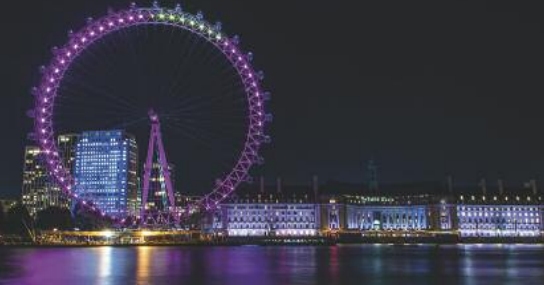
La ruota panoramica lungo il Tamigi