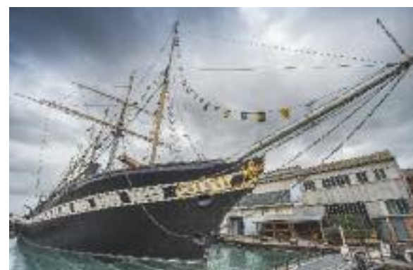
Bristol: la SS Great Britain