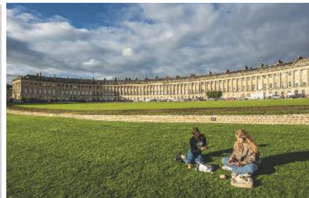
Bath: il Royal Crescent e il prospiciente prato all'inglese