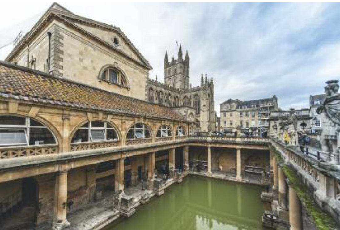
Le terme romane di Bath

apprezzare tutti gli spazi ideati dai Romani. Invece, per usufruire delle preziose acque sulfuree, si può prenotare una sosta, e diversi trattamenti, alle Thermae Bath SPA ( www.thermaebathspa.com ), moderno complesso consacrato al benessere e sormontato da una spettacolare piscina aerea. La città è un elegante complesso di edifici in gran parte georgiani, candidi nelle forme ed evocativi delle atmosfere di Jane Austen , che a Bath visse e scrisse. Dove l'architettura mette in scena un fascino visionario è nei due ellittici spazi di Royal Crescent e del vicino Circus : abitazioni tutte uguali disposte a ellissi e a semicerchio, uno spazio concepito da John Wood il Vecchio e realizzato da John Wood il Giovane tra il 1754 e il 1774. L'obiettivo era quello di dare un aspetto