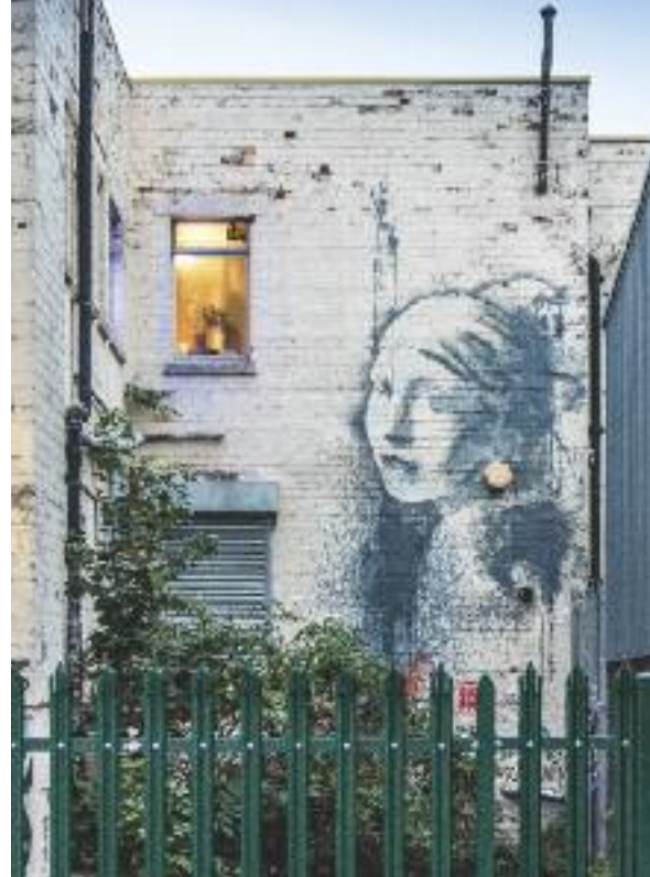
La ragazza con l'orecchino di perla di Banksy

Una regina senza età coi Dr. Martens ai piedi, nazionalista fino al midollo, sguardo fisso al futuro ma radici profondissime e inestirpabili: che tu sia un addicted o ci metta piede per la prima volta, non potrai fare a meno di constatare che non c'è nulla come l'Inghilterra. L'Oxford Languages definisce così l'aggettivo romantico : « Caratterizzato da tendenze o aspetti riconducibili ad un mondo sentimentale, appassionato, languido o sognante ». Ecco, il nostro viaggio nella terra di Elisabetta II prende proprio spunto da questo mood, che si accorda perfettamente alle traiettorie del nostro viaggio, che inizia dal porto di Bristol per tagliare trasversalmente il sud del Regno Unito: Salisbury , che sembra appena uscita da un libro di fairytale ;