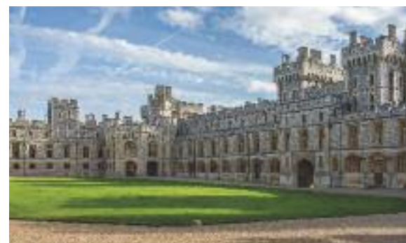
I palazzi reali inglesi, il fascino di dimore abitate