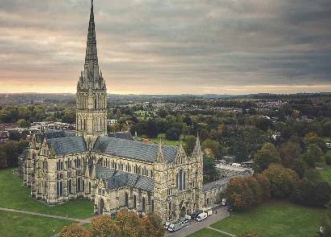
La cattedrale della Beata Vergine Maria di Salisbury