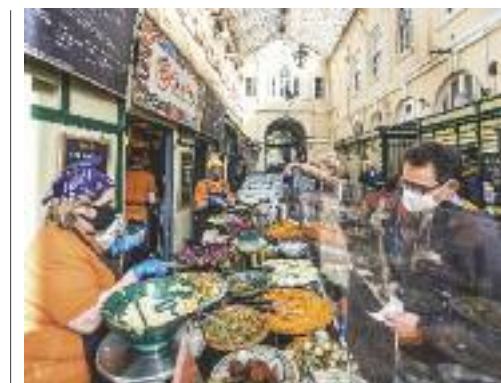
Bristol, St Nicholas Market

particolare attenzione. Quella testata a Bristol è in assoluto tra le più originali: sul tetto della Brooks Guesthouse ( www.brooksguesthousebristol.com ), a due passi dal trafficatissimo mercato di St Nicholas, si trova un piccolo villaggio di roulotte anni Cinquanta, portate lì chissà come dai proprietari. Sono le rooftop caravan , scintillanti di metallo argentato e arredate come una piccola, confortevole camera d'hotel. Spazi ridotti ma ogni comfort, e in più il panorama sui tetti della città. Da prenotare con adeguato anticipo.