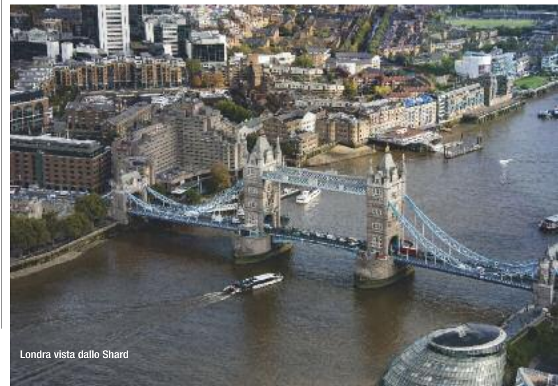
Londra vista dallo Shard