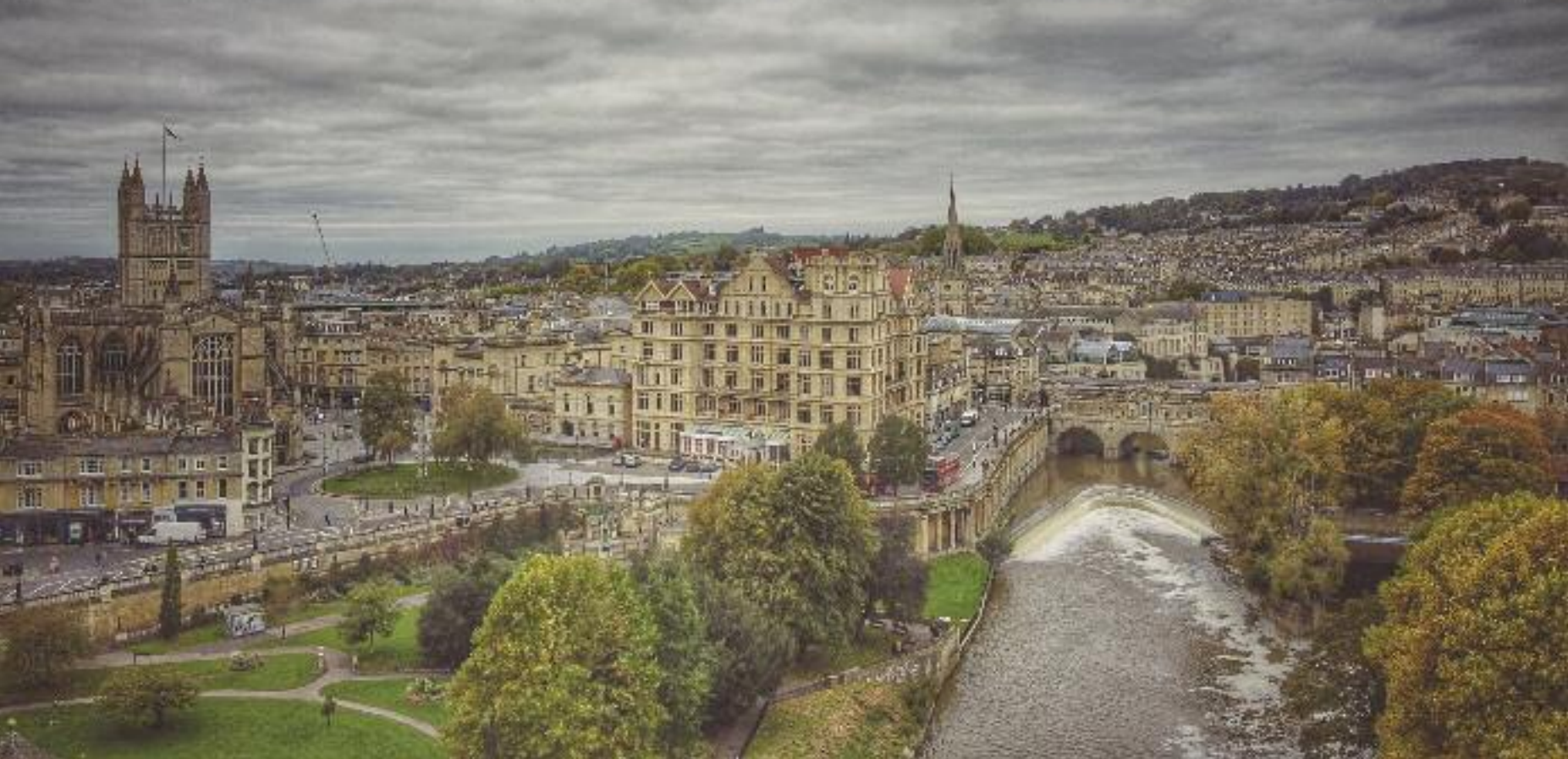
Veduta aerea del centro storico di Bath

apprezzare tutti gli spazi ideati dai Romani. Invece, per usufruire delle preziose acque sulfuree, si può prenotare una sosta, e diversi trattamenti, alle Thermae Bath SPA ( www.thermaebathspa.com ), moderno complesso consacrato al benessere e sormontato da una spettacolare piscina aerea. La città è un elegante complesso di edifici in gran parte georgiani, candidi nelle forme ed evocativi delle atmosfere di Jane Austen , che a Bath visse e scrisse. Dove l'architettura mette in scena un fascino visionario è nei due ellittici spazi di Royal Crescent e del vicino Circus : abitazioni tutte uguali disposte a ellissi e a semicerchio, uno spazio concepito da John Wood il Vecchio e realizzato da John Wood il Giovane tra il 1754 e il 1774. L'obiettivo era quello di dare un aspetto