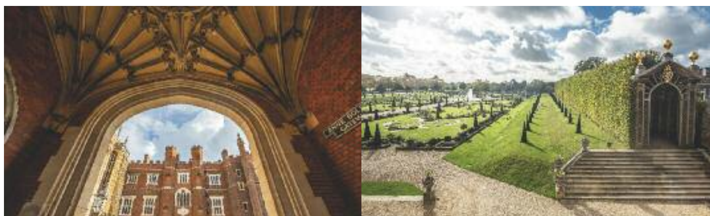
Hampton Court: volte decorate separano un cortile dall'altro