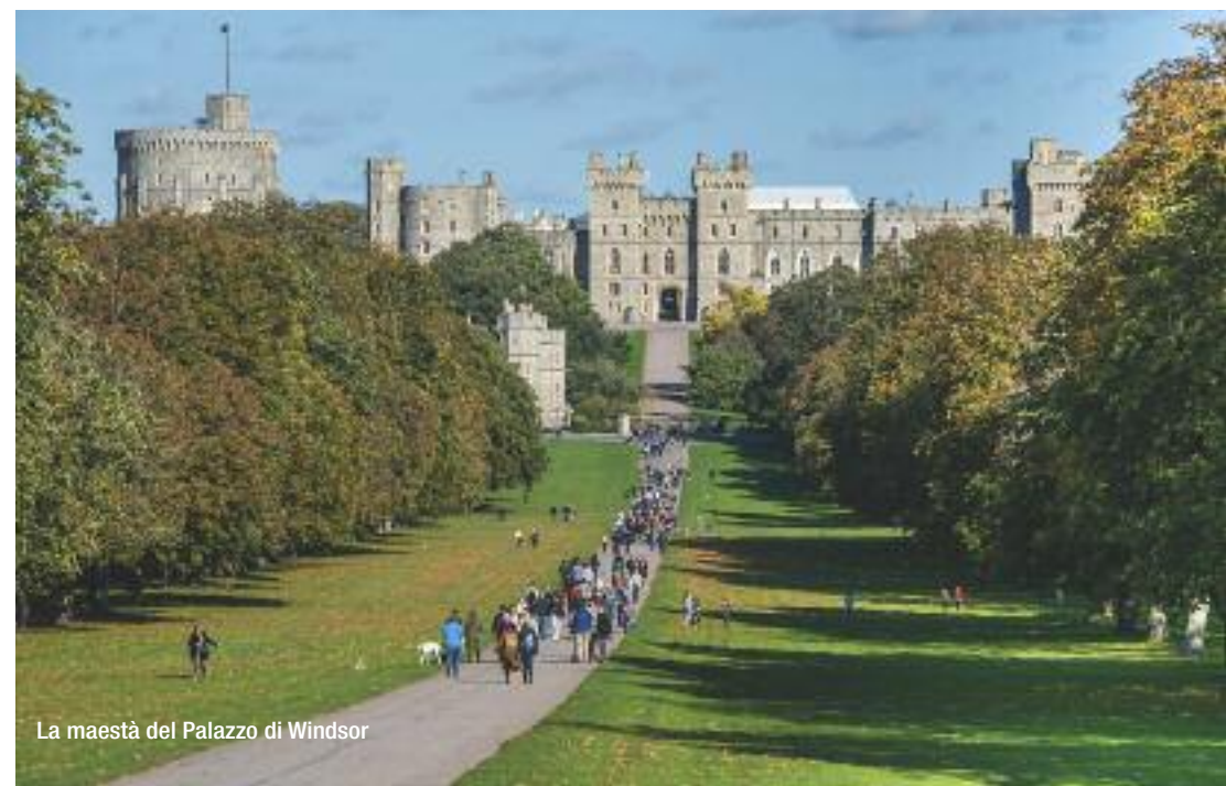
La maestà del Palazzo di Windsor