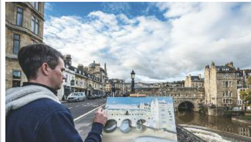
Il Pulteney Bridge di Bath