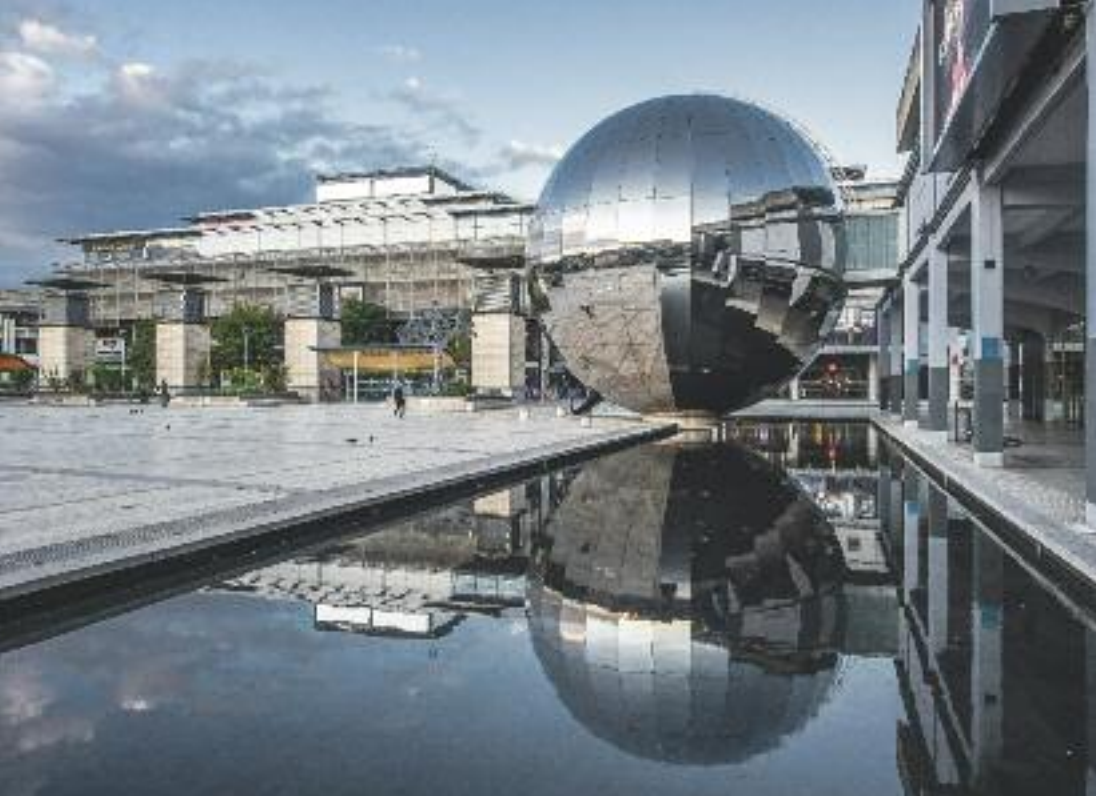
Geometrie contemporanee nel centro di Bristol