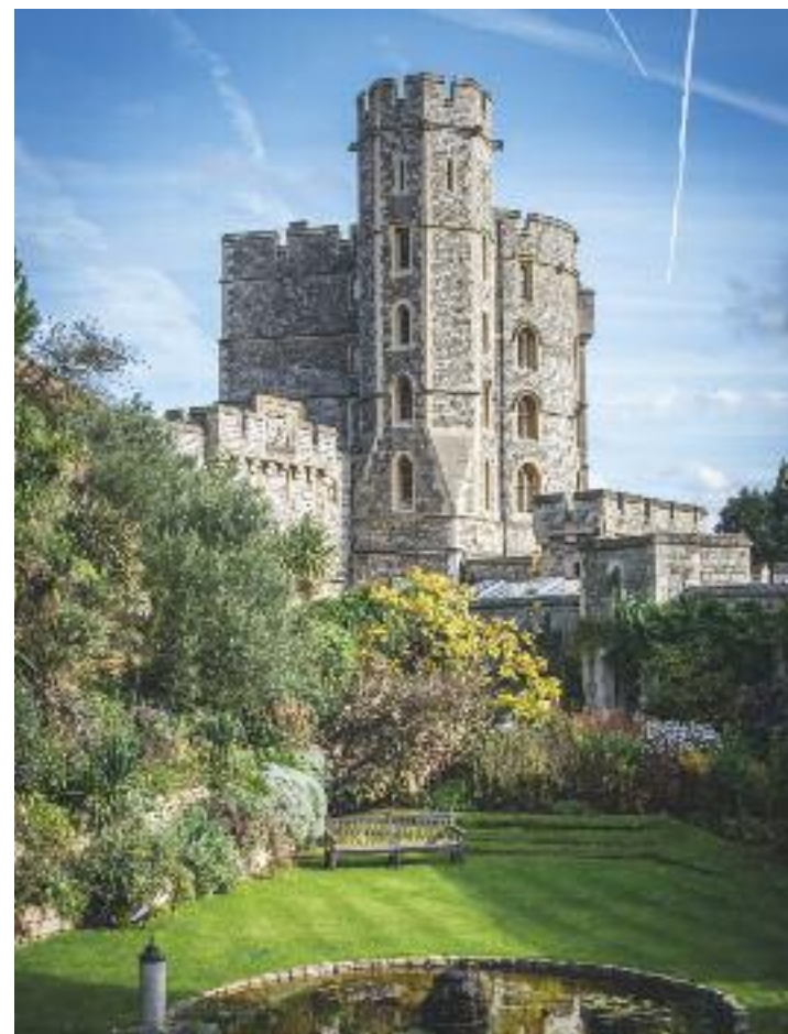
Il Palazzo di Windsor