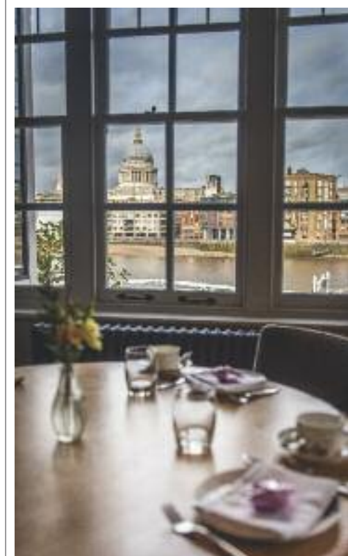
Lo Swan at the Globe