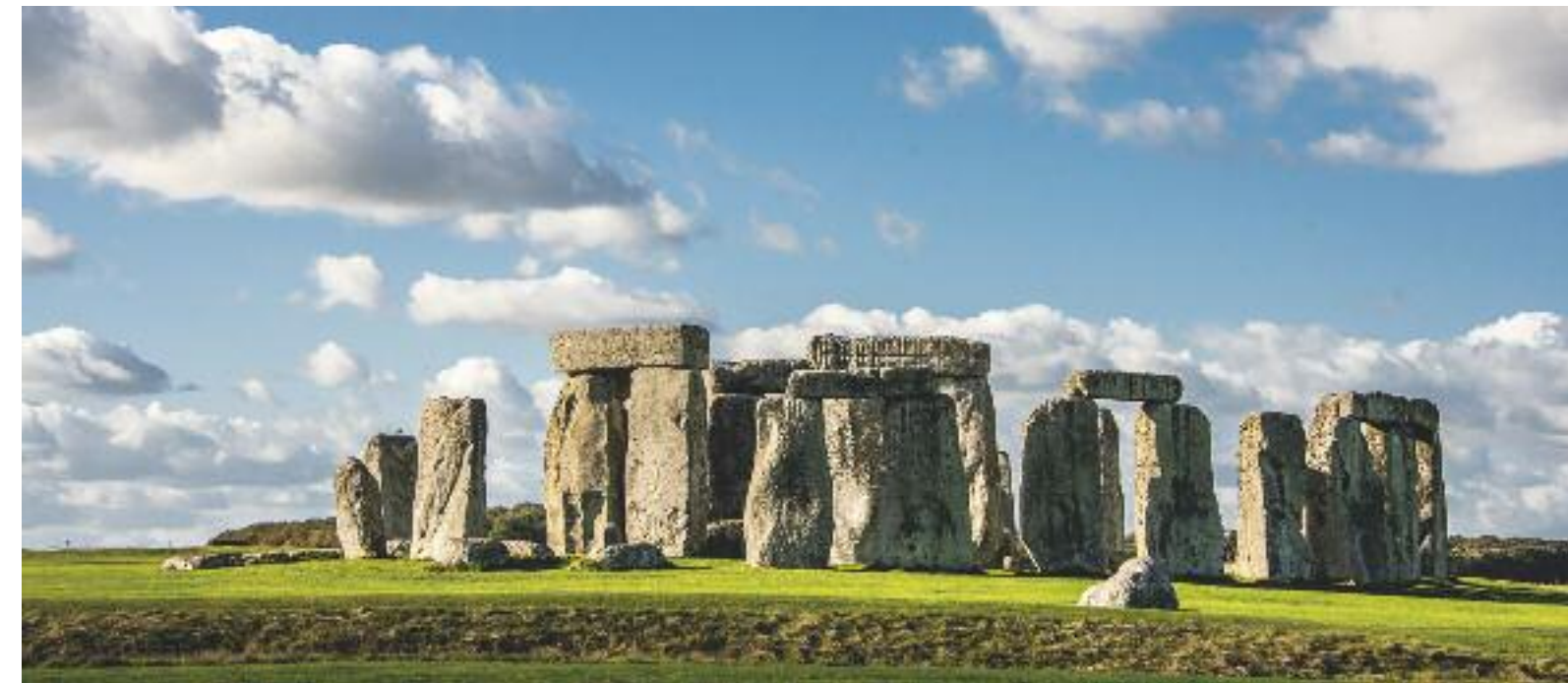
I leggendari allineamenti di Stonehenge

piacere dell'acqua lo portarono i Romani, che, da conquistatori seriali, edificarono città riproponendo ovunque il medesimo modello, a partire dalle terme, luogo deputato non solo al benessere, ma all'incontro e al confronto, spazio sociale prediletto per una civiltà che esportò il proprio stile di vita in tutta Europa. Bath (il cui nome significa appunto "terme romane" ) è un'elegante cittadina georgiana, celebre per le sue acque salubri e medicamentose. I conquistatori arrivarono intorno al 40 d.C. e scoprirono i benefici di quelle che battezzarono aquae sulfis , ma pare ormai accertato che i primi a servirsene furono i Celti, già 2500 anni prima. L'edificio che vediamo oggi è un ibrido tra una pianta romana, ampia e sontuosa, e la ricostruzione, avvenuta nel 1755 a opera di Beau Nash , dandy e bon vivant che ne fece l'elegante ritrovo per l'aristocrazia inglese del tempo. Il percorso di visita si sviluppa intorno alla grande vasca centrale e permette di