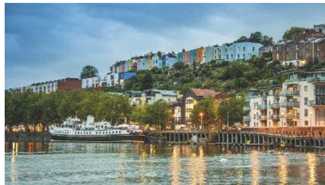
L'alba sulla baia di Bristol