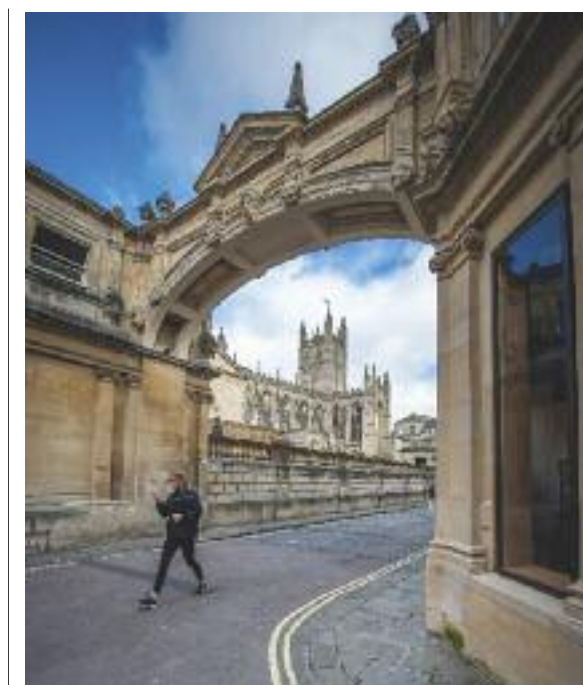
Il centro di Bath

L'uomo ha sempre cercato l'acqua, per vivere ma anche per prendersi cura del proprio corpo. E in Inghilterra il