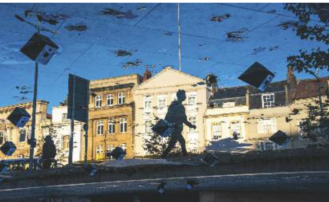
Case vittoriane nell'alba di Bristol

Una regina senza età coi Dr. Martens ai piedi, nazionalista fino al midollo, sguardo fisso al futuro ma radici profondissime e inestirpabili: che tu sia un addicted o ci metta piede per la prima volta, non potrai fare a meno di constatare che non c'è nulla come l'Inghilterra. L'Oxford Languages definisce così l'aggettivo romantico : « Caratterizzato da tendenze o aspetti riconducibili ad un mondo sentimentale, appassionato, languido o sognante ». Ecco, il nostro viaggio nella terra di Elisabetta II prende proprio spunto da questo mood, che si accorda perfettamente alle traiettorie del nostro viaggio, che inizia dal porto di Bristol per tagliare trasversalmente il sud del Regno Unito: Salisbury , che sembra appena uscita da un libro di fairytale ;