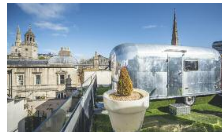
Bristol: Brooks Guesthouse