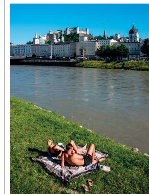
Relax sulle rive del Salzach