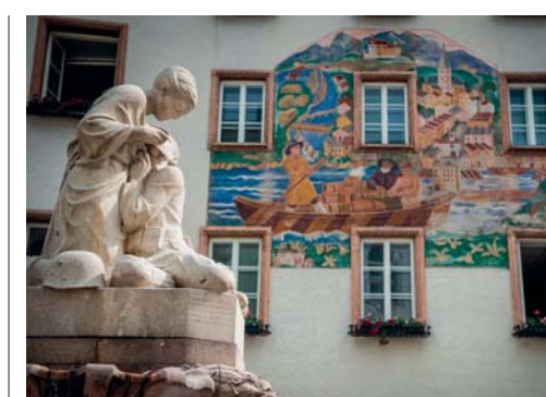
Case di Hallein

Bene, il racconto è giunto al suo epilogo. Abbiamo compiuto il percorso nel Salisburghese in soli cinque giorni: cultura, musica e sapori nel tempo dilatato ad arte. In realtà, le notti sono state solo tre, perché i treni da Milano partono la sera tardi ( wagon-lits con tutti i confort) per arrivare al mattino, idem sul ritorno. Una formula nuova che sa di antico e che permette di sfruttare appieno sia la prima giornata che quella conclusiva. L'arte di vivere una città ed il suo territorio è fatta anche di piccole scelte vittoriose, questa è una di quelle. >>>