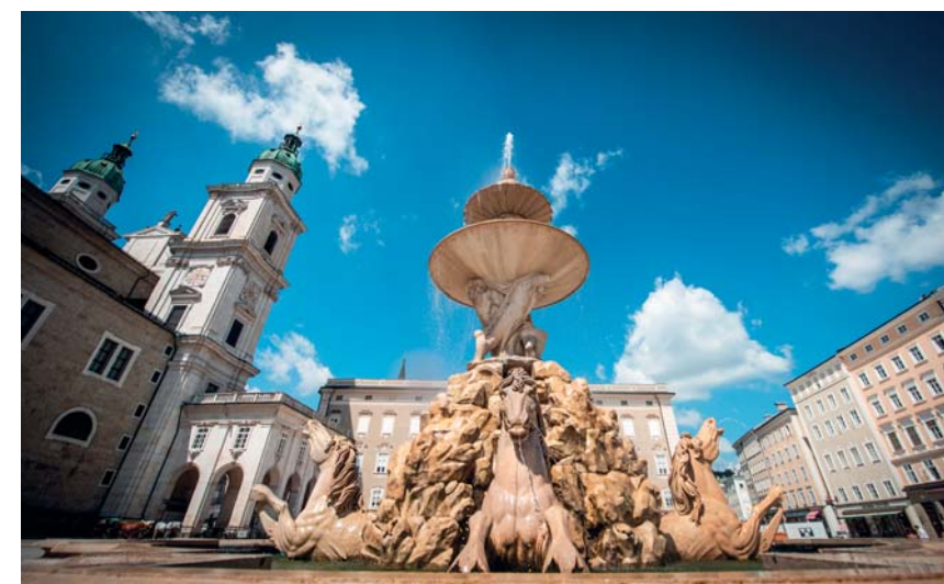
Il centro barocco di Salisburgo

La magia del Salisburghese nasce dall'irresistibile connubio tra green travelling e arte barocca , tra civiltà del villaggio e agricoltura sostenibile , ma dove il bio