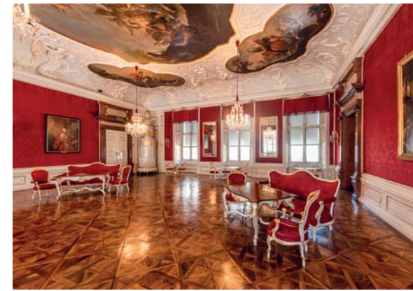
Le magnifiche sale del Quartiere del Duomo