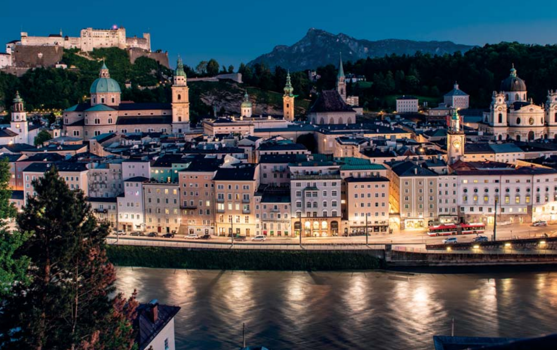
Il centro storico di Salisburgo

stimenti, tutto prima del grande festival, attraverso due secoli di consacrata affermazione.