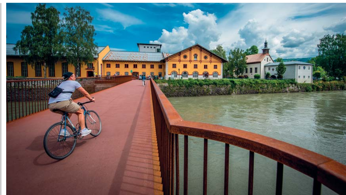
Hallein: ponte sul Salzach

Ogni soggiorno nella capitale dovrebbe sempre essere abbinato a una sosta in uno dei villaggi fiabeschi che punteggiano il territorio. Noi abbiamo scelto Hallein : coi suoi 20mila abitanti, accomodato sulle rive del Salzach , fin dal primo sguardo può sembrare una piccola Salisburgo . Locali coi giardini all'aperto, belle piazze, un incantevole centro pedonalizzato, palazzi disposti come quinte teatrali, una vivacissima scena culturale e un detto popolare (« mangiare e bere tiene insieme anima e corpo ») che è di per sé un invito al viaggio. Fondata dai Celti , che controllarono il territorio per 500 anni a partire dal V secolo avanti Cristo, Hallein deve la sua ricchezza, come buona parte dei centri della regione, al salgemma , qui conosciuto come "oro bianco" . Se volete saperne di più, visitate le grandi