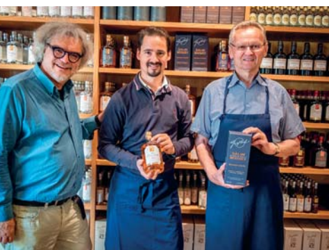
Visita alla distilleria Guglhof

verete, tradotto, tutto il materiale necessario al vostro soggiorno. Nel cuore della cittadina, altra tappa gettonatissima è la casa (oggi museo) di Franz Xaver Gruber , autore della più celebre canzone natalizia di tutti i tempi: Stille Nacht (Silent Night – Santo Natale) .