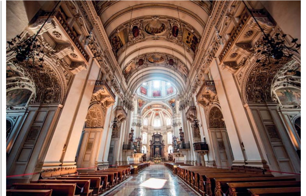
L'interno del Duomo di Salisburgo

candida fortezza di Hohensalzburg (fatta erigere nel 1077 dall'arcivescovo Gebhard , 15mila metri quadrati, la meglio conservata d'Europa) domina Salisburgo ricordando a tutti che il potere si mantiene con la forza delle armi. Nato per difendere e proteggere – è perfettamente visibile da ogni punto dell'abitato – il castello in realtà non fu mai preso d'assedio, venne solo insidiato, ma non realmente assalito, da una rivolta dei contadini protestanti. Episodio che ci ricorda come la città fu sempre fieramente cattolica , anche nei secoli seguenti la riforma luterana. Abbagliante nella sua tinta omogenea, Hohensalzburg offre un panorama monumentale che si arresta solo di fronte alle Alpi Bavaresi . Un fiabesco fenomeno acustico permette, dal cuore della città vecchia, di ascoltare, ogni domenica, la “trumpet tower” , il concerto di tromba barocca eseguito nella torre del castello.