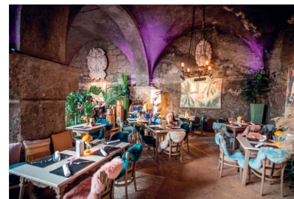
La sala del Stiftskulinarium

Detto che la soluzione strategica ideale per soggiornare a Salisburgo è l' Altstadt Hotel Weisse Taube (Kai-gasse, 9 – www.weissetaube.at ) – per la qualità dell'accoglienza, il confort elegante delle camere e la posizione, a soli cinque minuti a piedi dalla statua di Mozart – veniamo a tre interessanti approdi edonistici. Sul dorsale panoramico della "montagna dei monaci", all'altitudine di 580 metri, subito sopra il nuovissimo Museo d'Arte Moderna (intriganti le esposizioni temporanee), merita una sosta il ristorante M32 ( m32.at ): cucina del territorio arricchita da spunti creativi, ricco assortimento di vini e birre locali, lo sguardo che spazia libero verso il Salzach e il centro storico composto come in un dipinto. Scendendo in città è d'obbligo una sosta gourmet al St. Peter Stiftskulinarium