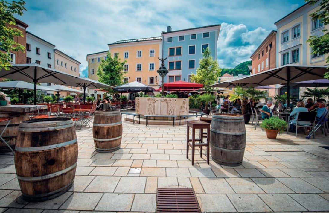
Il centro di Hallein