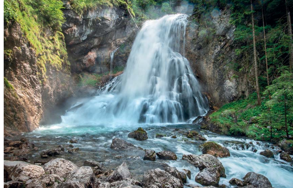
La cascata di Golling