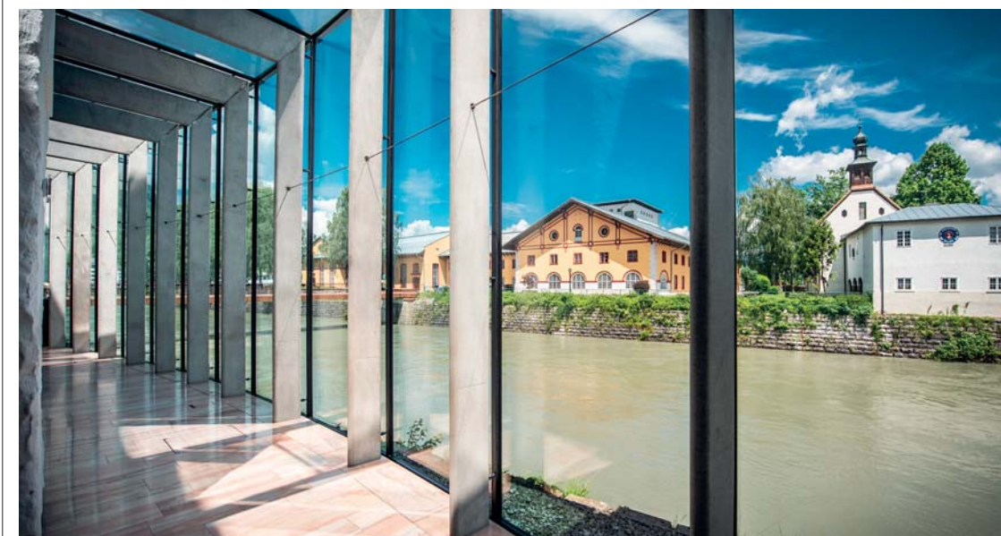
I luminosi spazi del Museo Celtico