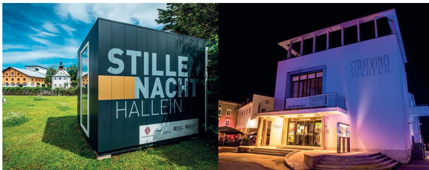
Installazione dedicata a Stille Nacht