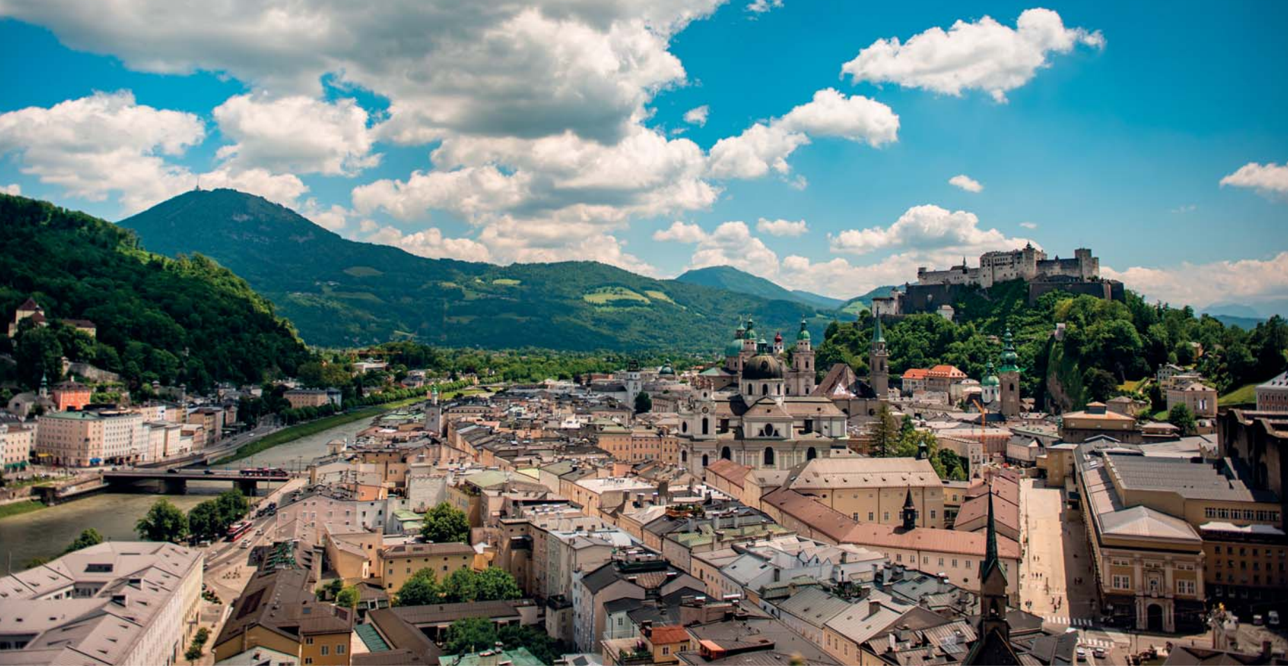
Il centro storico di Salisburgo

C i sono posti dove il tempo assume un valore diverso, dilatandosi, permettendovi un approccio alla curiosità senza limiti apparenti. In questi luoghi ricorderete di esserci stati solo cinque giorni ma, raccogliendo le idee, scoprirete di aver subito un singolare incantamento : visto che raramente (o forse mai) avrete inanellato così tante espe-