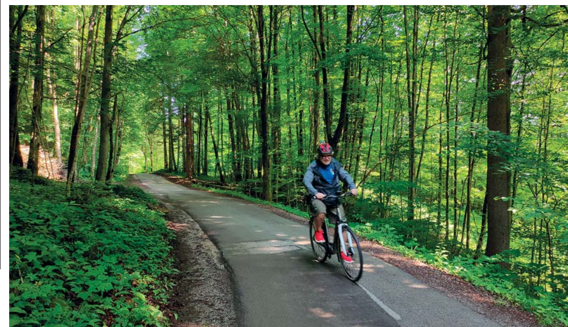
Escursioni in e-bike nel Salisburghese