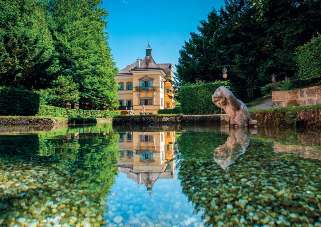
Il palazzo di Hellbrunn