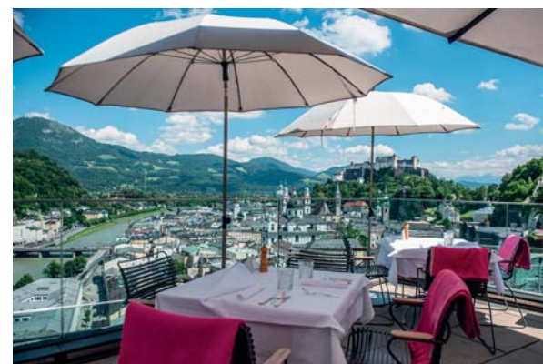
Il ristorante M32

è riallestito con gli interpreti più piccoli del mondo: un esercito di dipendenti in legno in grado di portare in scena anche intere opere del repertorio classico, una minuscola magia irrinunciabile.