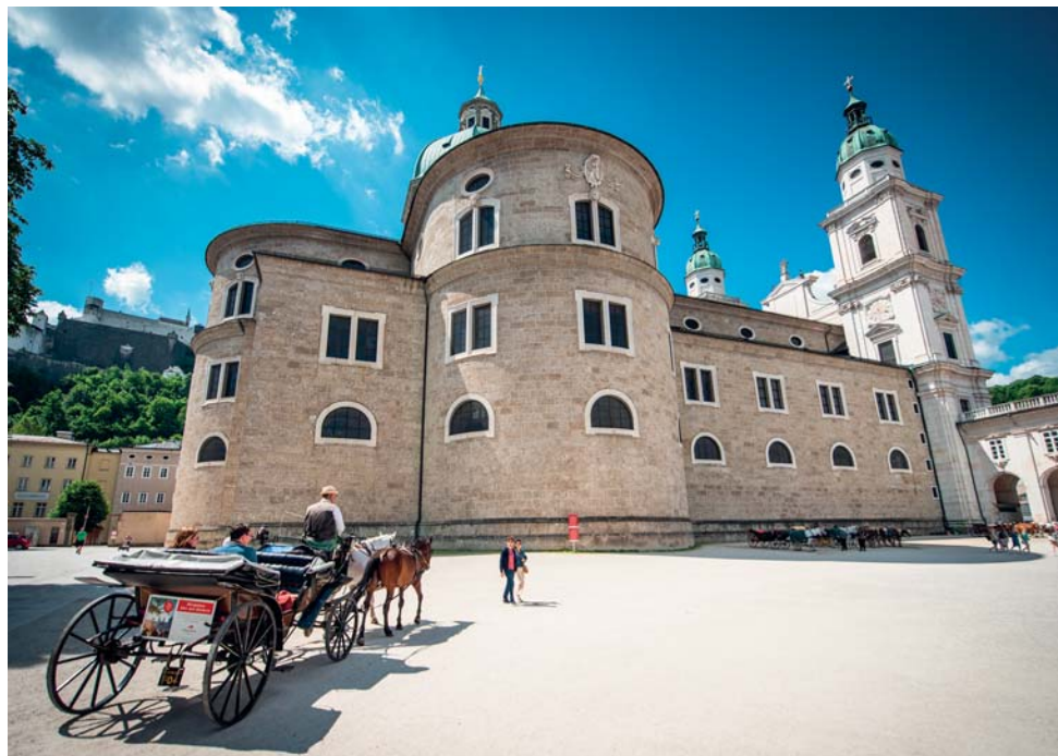
Il Duomo di Salisburgo

Ma il grande appuntamento estivo è solo la punta di diamante di un programma di festival e di concerti che si dipana durante tutto l'anno. Tra i maggiori vanno ricordati: il Festival di Pentecoste , diretto da Cecilia Bartoli , il Festival di Pasqua , il Festival musicale dell'Avvento e la Mozart Week , che ricorda la nascita del compositore. Salisburgo è una città che si riflette nell'immagine del suo artista universale, ma che ha saputo andare oltre, abbracciando, durante tutto l'anno, oltre dieci secoli