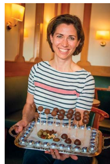
Le originali "palle di Mozart"