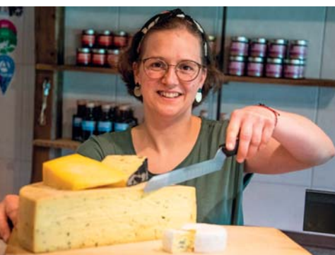
I formaggi di Rettenbacher

E veniamo ai sapori, esaltati in tre diverse varianti: distillati, pasticceria e ristorazione. La distilleria Guglhof ( www.guglhof.at ) è qualcosa che davvero non ti aspetti da queste parti. Passi per le eccellenti acquaviti e i tipici prodotti alpini , ma da Guglhof si sono anche dedicati, con indiscutibile successo, a superalcolici di ben altra natura, come il rum , il gin e il whisky . Se sui primi avanziamo qualche dubbio – interessanti, fantasiosi, persino piacevoli, però nulla a che vedere con gli originali – quando si arriva al whisky si resta con gli occhi sbarrati. Il Salin Single Malt (che si acquista senza neanche chiedere il prezzo) sbaraglia la Scozia e si issa sul trono. Sapore nitido e perfetto, note e aromi disposti come in un manuale, persistenza che ti fa rischiare l'antidoping. Chapeau. Pasticceria e arte del cioccolato d'eccellenza al Café Braun ( www.confiserie-braun.at ): arredi semplici e tavolini affacciati sulla Unterer Markt, tanto, tantissimo talento in laboratorio, dove la stessa famiglia, arrivata alla terza generazione, realizza i propri dolci capolavori dal 1912.