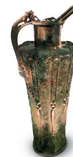
La preziosa brocca "a becco"

miniere recentemente restaurate ( www.salzwellen.at ): un'esperienza particolarmente consigliata alle famiglie, con percorso guidato e, attrazione principale, gli antichi scivoli in legno utilizzati dai minatori. La storia del luogo si apprezza nell'affascinante Museo dei Celti ( www.keltenmuseum.at ), edificio moderno e luminoso che espone, benissimo, oggetti e manufatti di questa antichissima popolazione, alcuni di particolare valore: le spade eleganti come opere di design, gli ornamenti sferici (in oro) per i capelli, una grande brocca "a becco" antica di 2500 anni e istoriata con esseri fantastici, uomini e animali delle leggende. Didascalie e pannelli sono rigorosamente in tedesco, superate lo sconforto e rivolgetevi alla cassa, vi verrà consegnata (gratuitamente) una guida dell'esposizione ricca di ogni dettaglio in italiano. Quest' attenzione alla nostra lingua è una peculiarità di Hallein, all'ufficio turistico tro-