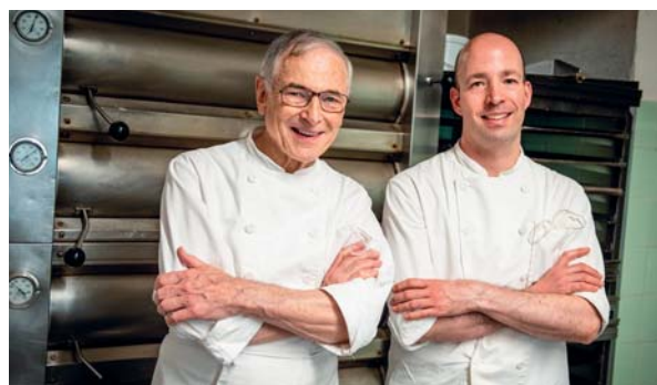
Nel laboratorio del Café Braun