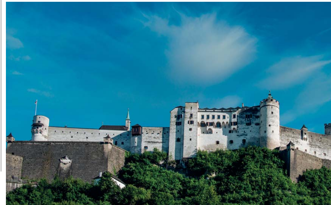
La fortezza di Hohensalzburg

candida fortezza di Hohensalzburg (fatta erigere nel 1077 dall'arcivescovo Gebhard , 15mila metri quadrati, la meglio conservata d'Europa) domina Salisburgo ricordando a tutti che il potere si mantiene con la forza delle armi. Nato per difendere e proteggere – è perfettamente visibile da ogni punto dell'abitato – il castello in realtà non fu mai preso d'assedio, venne solo insidiato, ma non realmente assalito, da una rivolta dei contadini protestanti. Episodio che ci ricorda come la città fu sempre fieramente cattolica , anche nei secoli seguenti la riforma luterana. Abbagliante nella sua tinta omogenea, Hohensalzburg offre un panorama monumentale che si arresta solo di fronte alle Alpi Bavaresi . Un fiabesco fenomeno acustico permette, dal cuore della città vecchia, di ascoltare, ogni domenica, la “trumpet tower” , il concerto di tromba barocca eseguito nella torre del castello.