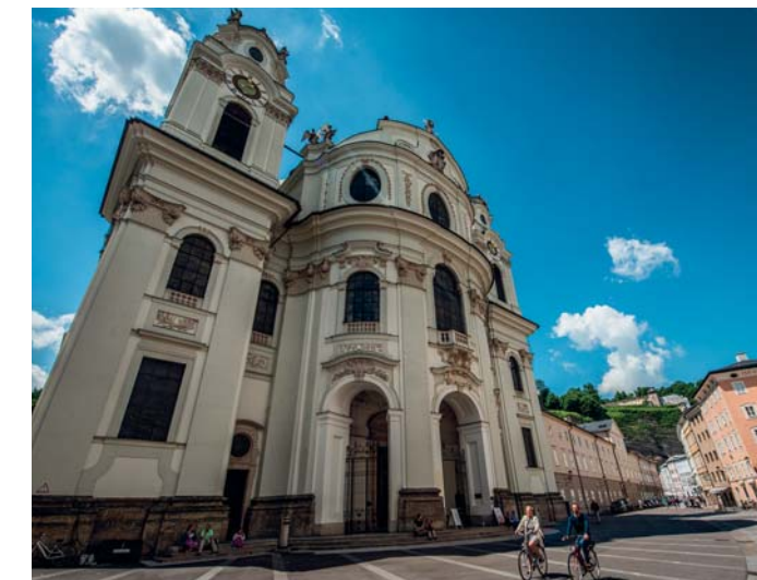
Il Duomo di Salisburgo

L'evento più atteso dell'anno è il Festival di Salisburgo , grande rassegna estiva dedicata alla lirica , alla prosa e alla musica classica , una sontuosa macchina organizzativa con uno sbieglimento che supera regolarmente quota 270mila . Gli spettatori provengono da 85 Paesi diversi, di cui 47 extraeuropei, per l'80% sono abituali e hanno già seguito almeno sei edizioni del Festival. Quest'anno va in scena il centunesimo Festspiele della serie ( www.salzburgfestival.at ), sono previsti 168 spettacoli distribuiti in 46 giorni e in 17 sedi . I biglietti vanno dai 5 ai 445 euro e la manifestazione, caso unico al mondo, si autofinanzia per il 75%, mentre la ricaduta sul territorio è il principale asset economico della città . Tra i padri del Festival vanno ricordati il leggendario Max Reinhardt , Hugo von