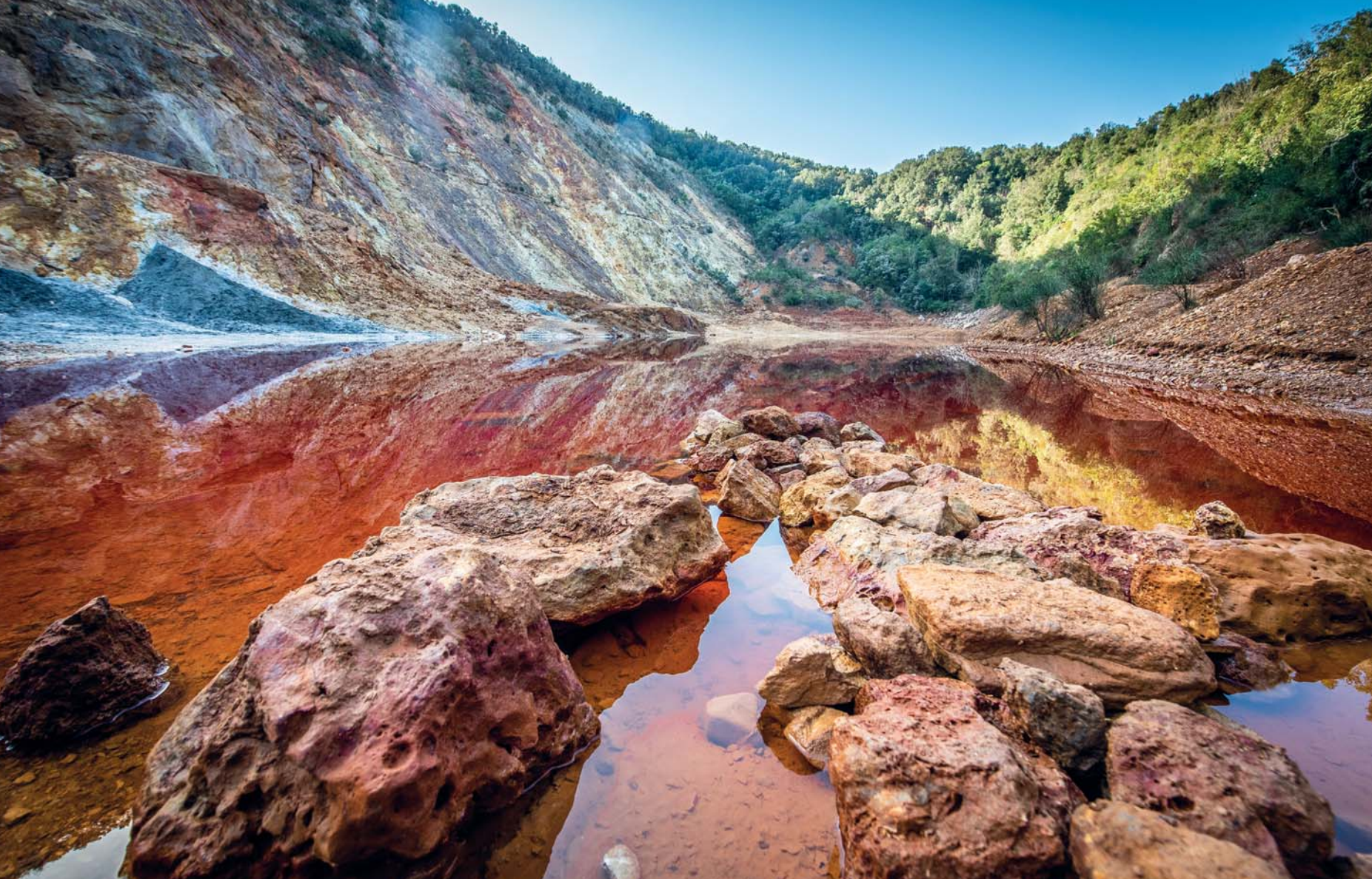
Le acque scarlatte del laghetto delle Conche