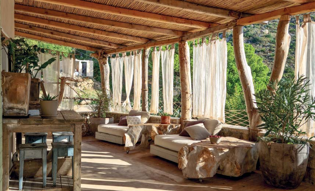
Casa dei Gatti