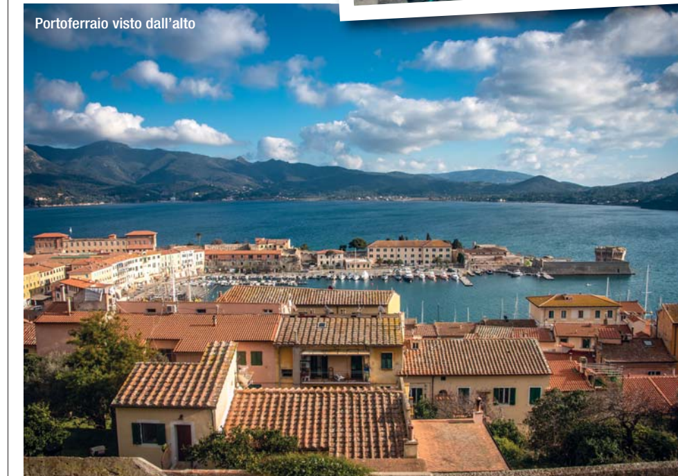
Portoferraio visto dall'alto