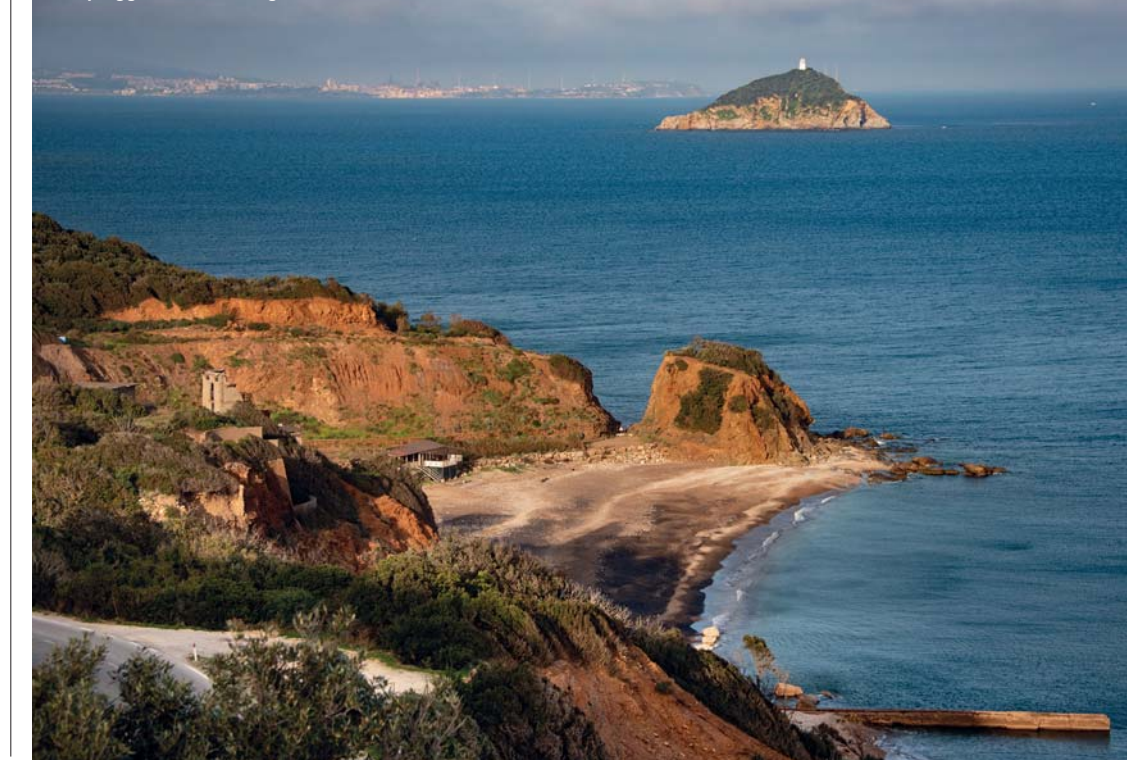
La spiaggia di Cala Seregola