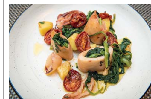
Totani ripieni di verdure