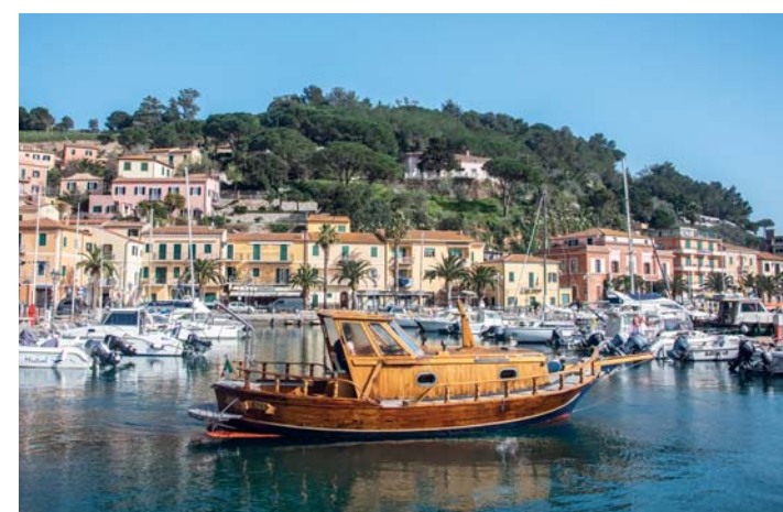
La Lady Lillj a Porto Azzurro

Il patrimonio più conosciuto dell'Elba è sicuramente quello delle spiagge . Tra le più amate, la già citata spiaggia di Sansone , quella prospiciente il laghetto di