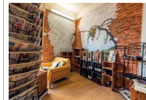
L'Osteria Cacio e Vino