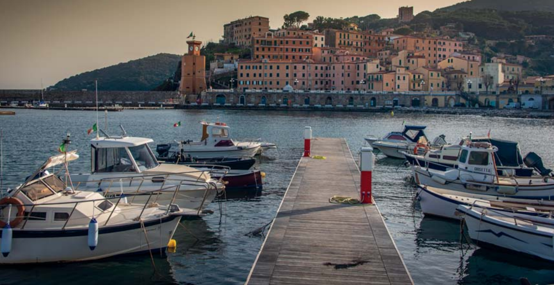
Il porto di Rio Marina