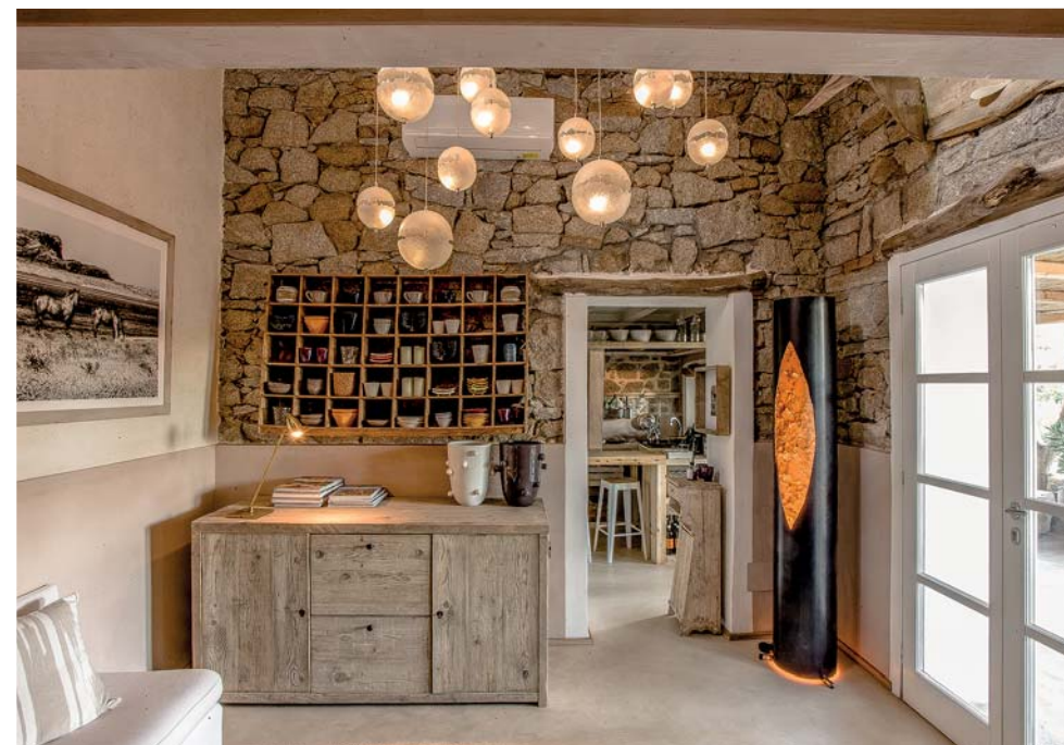
Casa dei Gatti