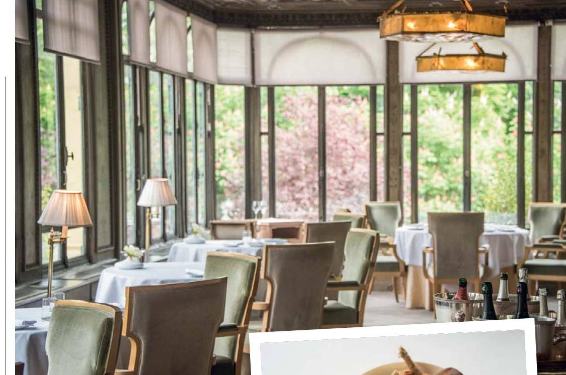
Il Pavillon Ledoyen