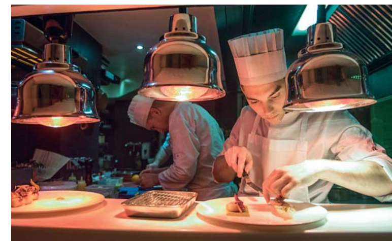
L'impiattamento al 1741