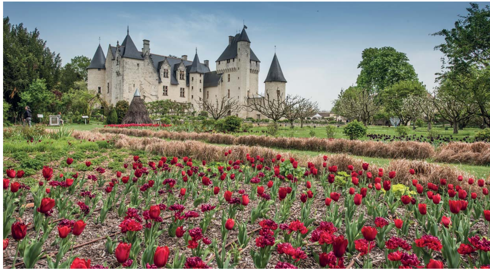
Il castello di Rivau