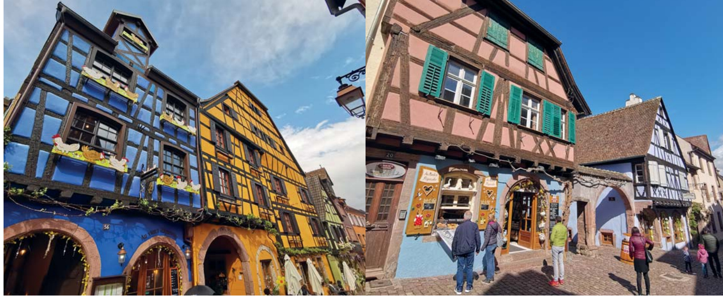
Riquewihr, il centro del villaggio