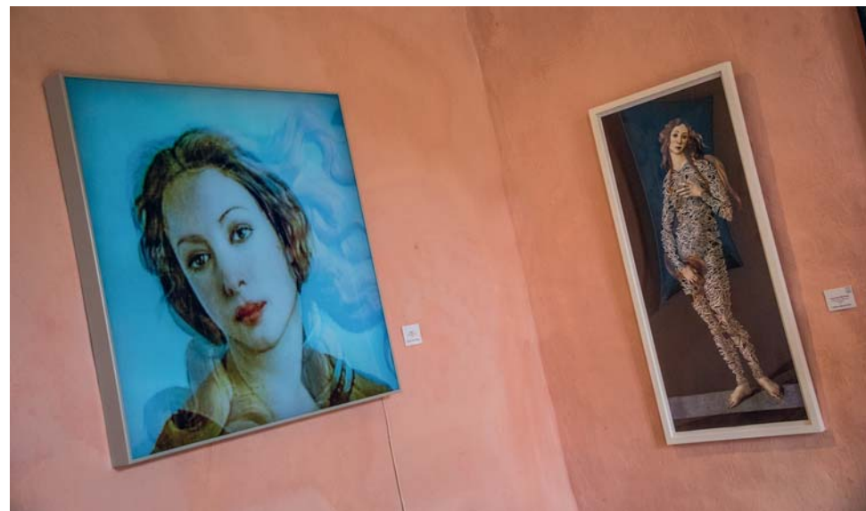
Rivau: l'esposizione 'Hommage à Léonard et à la Renaissance'

L'arte dei geni senza tempo crea ponti e mai confini. L'arte è bellezza condivisa, l'arte rende superflue le frontiere e suggerisce opportunità. Così, l'anno di Leonardo , icona del Rinascimento italiano, ci fa guardare a quella Francia dove trascorse gli ultimi anni, e dove si può ammirare la 'Gioconda' , il ritratto più celebre di tutti i tempi. Gli approdi del nostro viaggio sono tre: la Valle della Loira, tappa conclusiva della sua vita, Parigi, che custodisce il suo capolavoro, e l'Alsazia, dove la cucina d'eccellenza