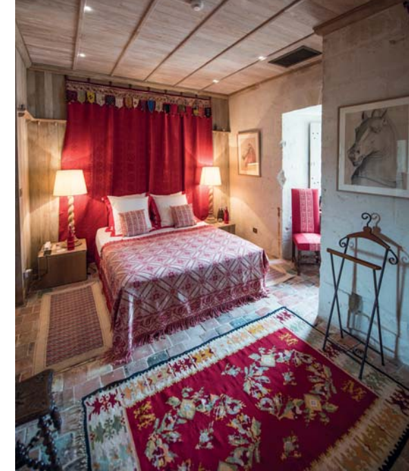
Una delle camere storiche a Rivau