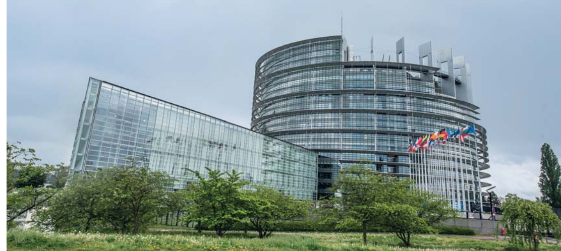
Strasburgo: il Parlamento Europeo A sinistra: la Cattedrale