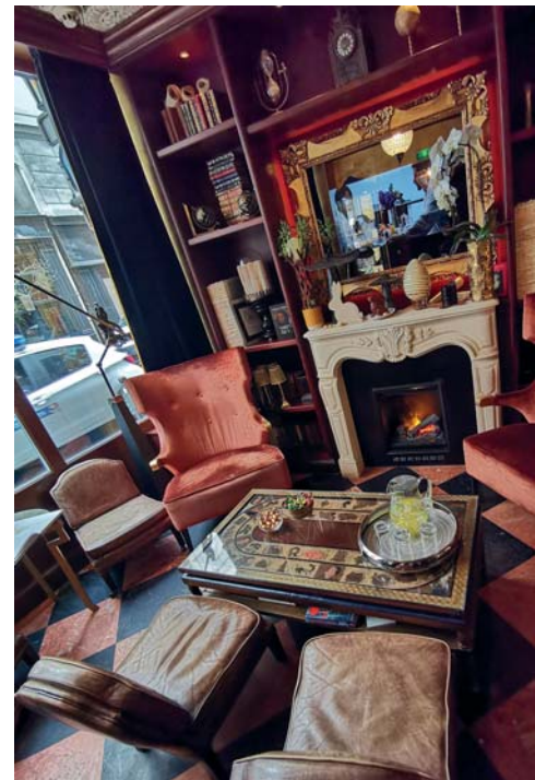
Il salotto dell'Hôtel Da Vinci