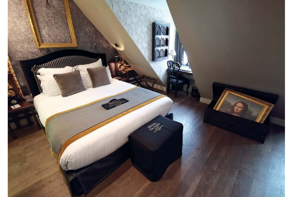
Hôtel Da Vinci: Chambre de l'Adorateur