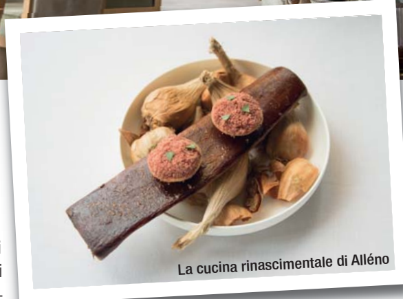
La cucina rinascimentale di Alléno