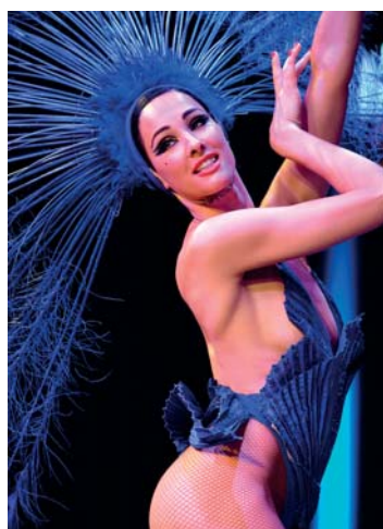
'Paris Merveilles' lo show del Lido Sotto: la cucina di Malro