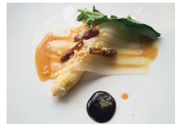
Una creazione di Yannick Alléno