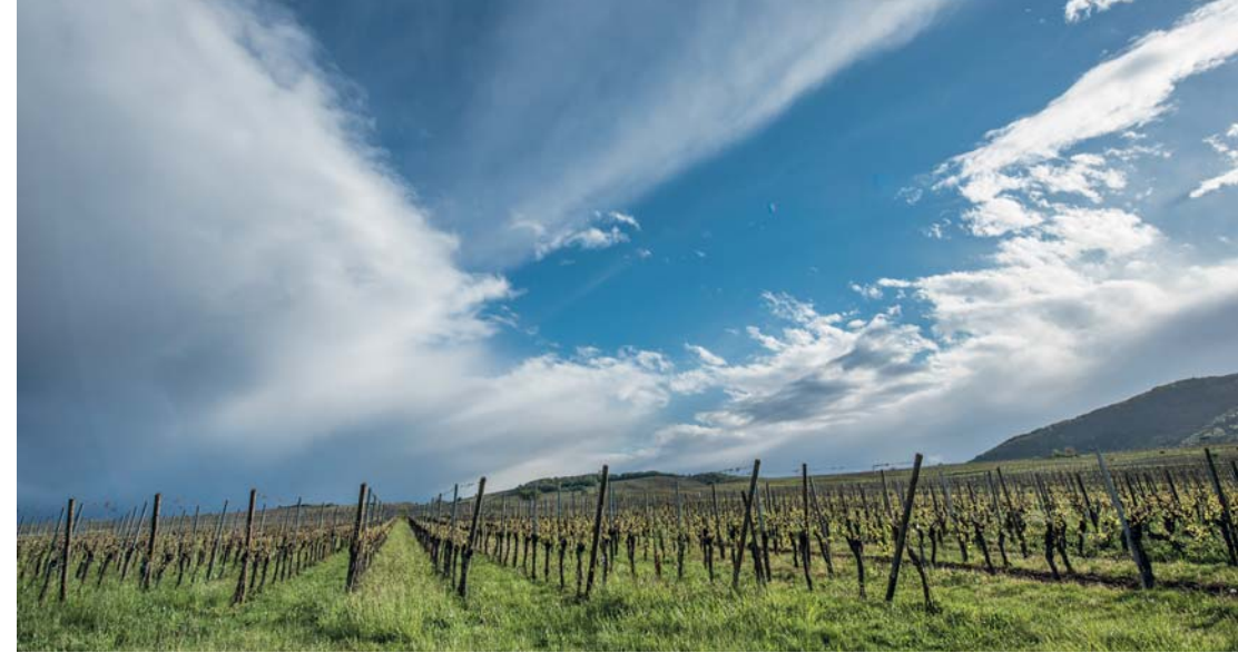
I vigneti alsaziani di Riquewihr