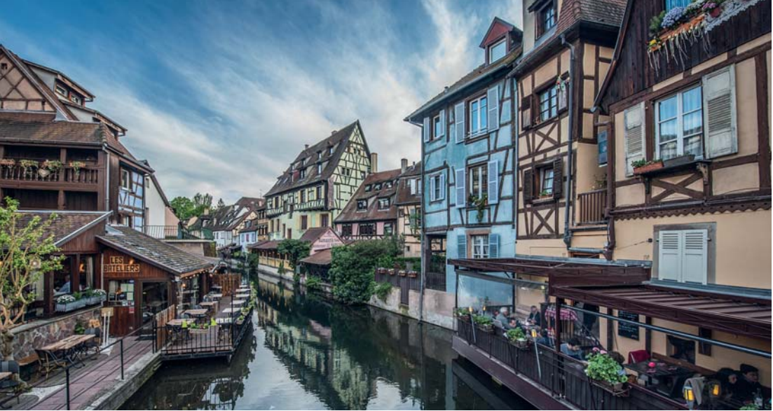
Case a graticcio di Colmar, la Venezia d'Alsazia