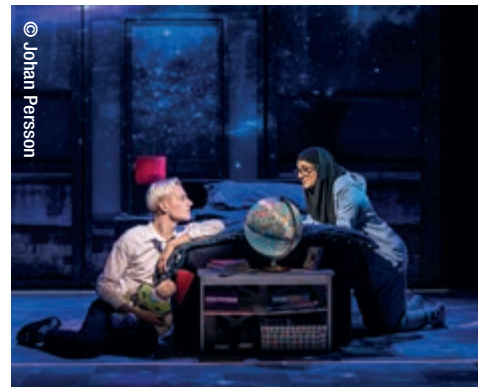
John McCrea nel musical 'Jamie'