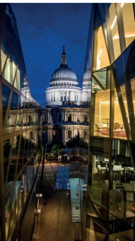
Il New Change Passage

all'epoca la più grande residenza d'Europa, concepito da Enrico VIII all'apice del suo prestigio. Questa meraviglia fu completamente distrutta durante il grande incendio del 1666 . Quel che ne rimase è tra i capolavori del celebre architetto Inigo Jones : una sala candida in stile palladiano lunga 37 metri e alta 17. Sul soffitto a cassettoni si trova la vera meraviglia: un ciclo di tele realizzate da Pieter Paul Rubens . Si possono ammirare comodamente dalle soffici poltrone disposte sul pavimento, oppure, senza sollevare lo sguardo verso l'alto, dai carrelli specchiati proposti ai visitatori. L'opera, voluta da Carlo I , non portò fortuna al committente, che fu giustiziato proprio di fronte alla Banqueting House, il 30 gennaio del 1649 . La sala è sempre stata utilizzata, sin dalla sua origine, per banchetti e ricevimenti; attività che viene esercitata tuttora. Al termine della visita i più audaci possono utilizzare gli abiti di corte messi a disposizione per una foto ricordo, o per una passeggiata fuori dal tempo sotto i capolavori di Rubens.