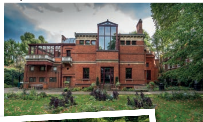
La Leighton House

Concluso il nostro giro del mondo, facciamo una puntata nella Londra più aulica, ma sempre al di fuori delle rotte abituali. Siamo di fronte alla Horse Guards e al 10 di Downing Street , proprio dove si arrestano i turisti. Bene, voltiamo le spalle alla folla e attraversiamo la strada, perché il nostro obiettivo – la Banqueting House (letteralmente, 'casa dei banchetti') – è uno di quelli che sfuggono per eccesso di visibilità da parte del vicinato. Il palazzo è l'unico edificio superstite del leggendario Whitehall : un complesso di 1.500 stanze ,