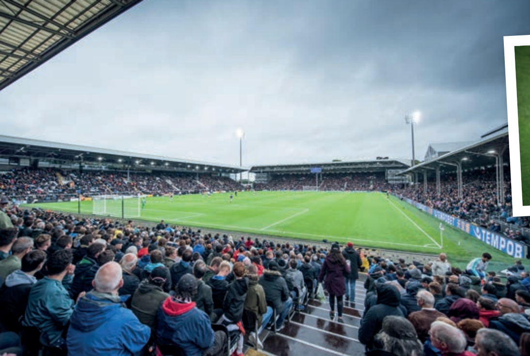
Il Craven Cottage