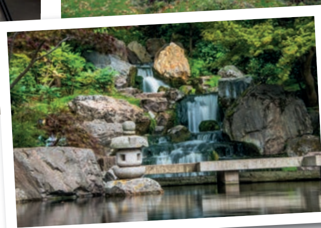
Il Kyoto Garden