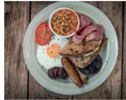
Il breakfast del Rail House Café