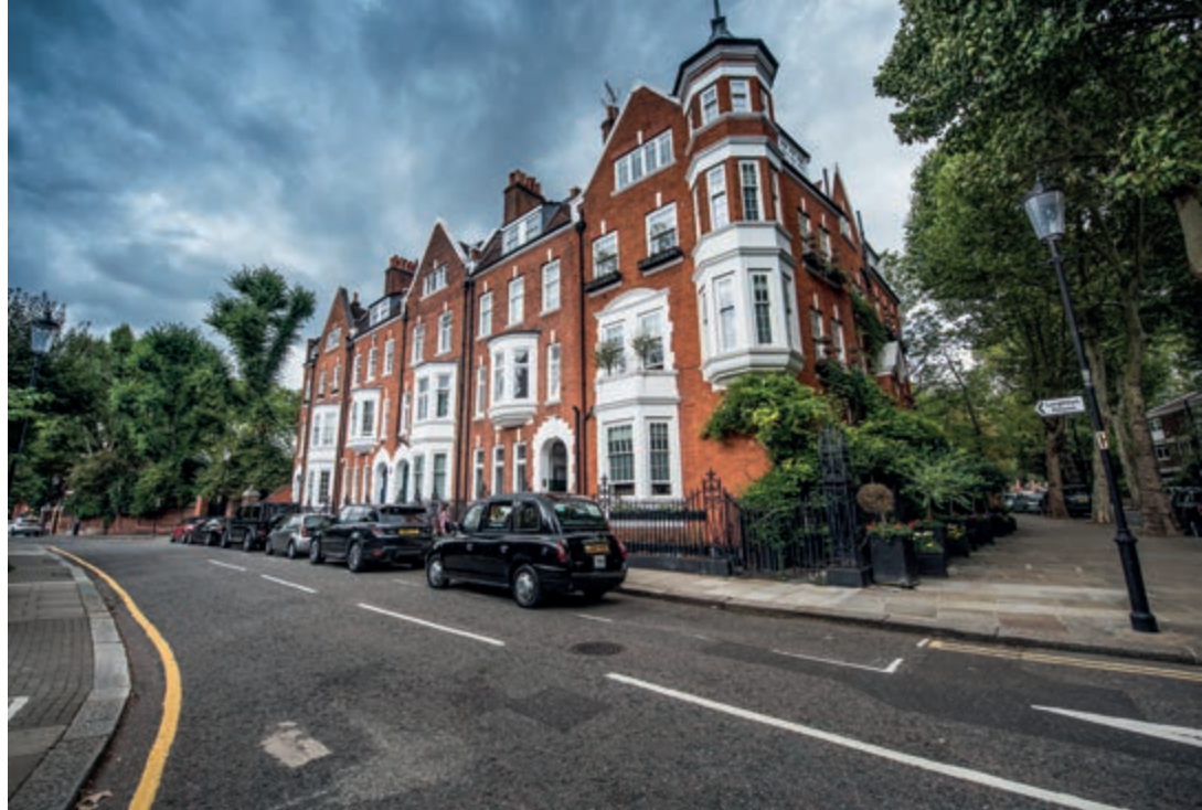
Casette vittoriane nei pressi di Holland Park