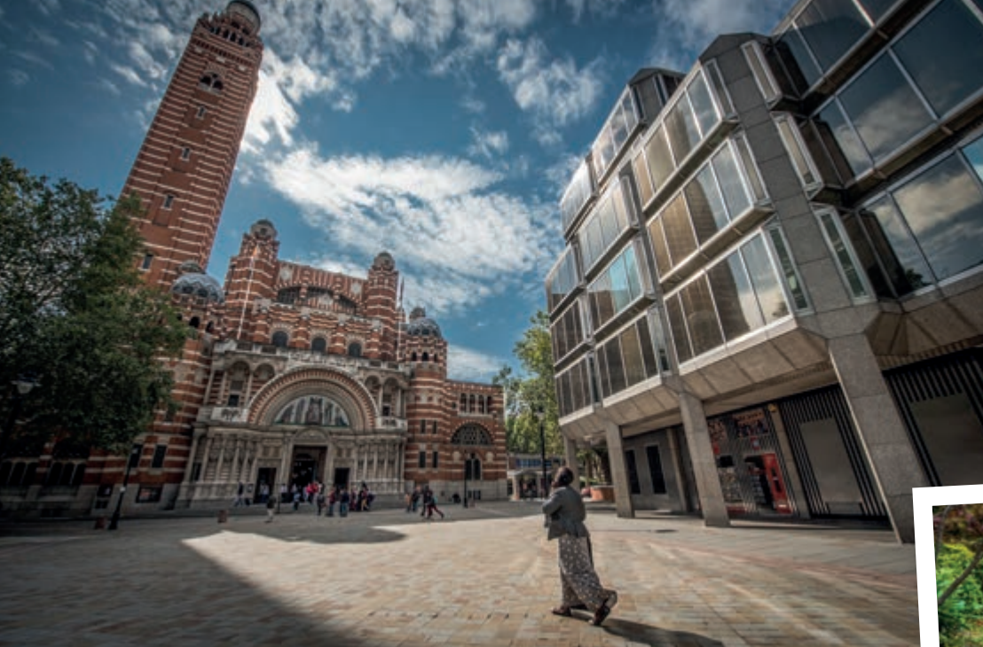
La Cattedrale di Westminster

e il progetto dell'architetto vittoriano Francis Bentley si può definire sorprendente e visionario. Affascinato dalla Basilica di San Marco e dalla moschea di Santa Sofia a Istanbul, il progettista combinò i due edifici in uno e portò Bisanzio nella City. In più, aggiunse una torre campanaria alta e aguzza come un minareto. La cattedrale, consacrata al Preziosissimo Sangue di Cristo, con rimandi all'antico mito del Graal, propone un interno di luminosa bellezza: magnifiche cappelle, marmi pregiati, infiniti mosaici, le emozionanti stazioni della Via Crucis scolpite da Eric Gill . Sulle pareti, come in un grande libro illustrato, si leggono le storie del Vecchio e del Nuovo Testamento, ma sono anche messe in rilievo le figure del cattolicesimo britannico: San Patrizio e i santi scozzesi. Osservata dall'esterno, circondata da anonimi edifici contemporanei, la cattedrale di Westminster appare estranea e solenne, sembra sia stata depositata dall'alto e non costruita su umane fondamenta.