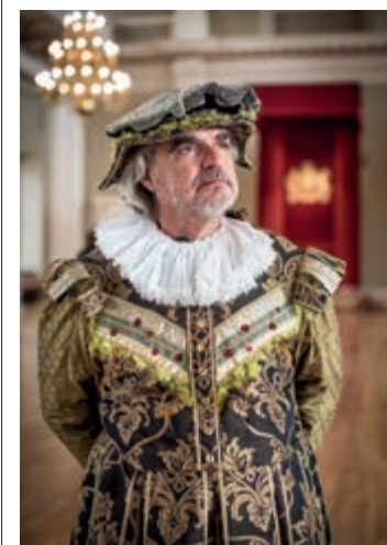
Banqueting House: visita in costume