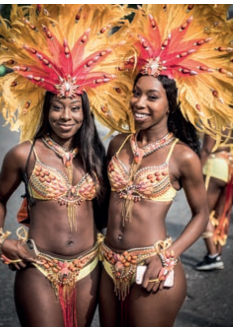
Le protagoniste del carnevale di Notting Hill