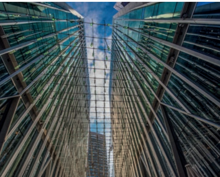
I palazzi a specchio della City