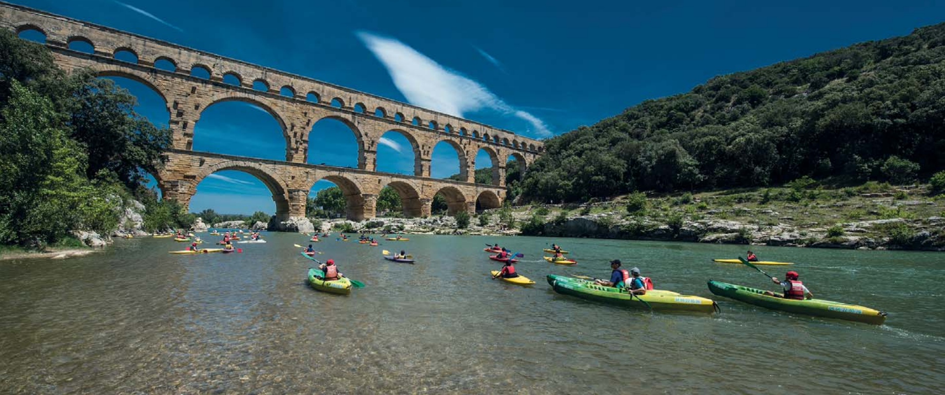
Il ponte di Gard

● ● ● la città si aspetta un riconoscimento universale al proprio percorso storico e artistico, alla propria capacità di innovare e preservare. L'obiettivo è quello di entrare nel patrimonio mondiale dell'Unesco ● ● ●