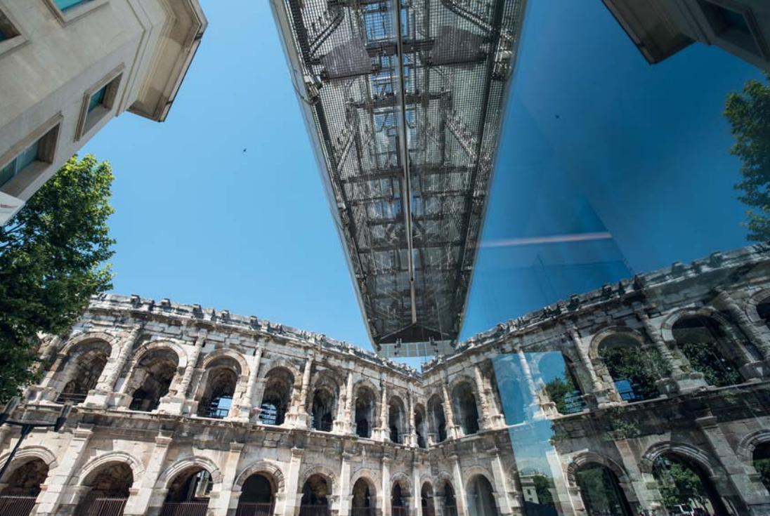
Les Arènes di Nîmes, si specchiano sul Musée de la Romanité

Contrasti voluti, immagini speculari, gli archistar a confronto con gli ingegneri dell'impero