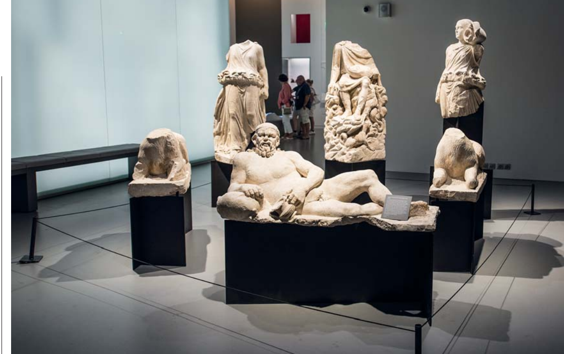
Gli interni e gli allestimenti del Musée de la Romanité