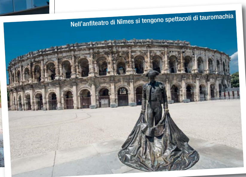
Nell'anfiteatro di Nîmes si tengono spettacoli di tauromachia