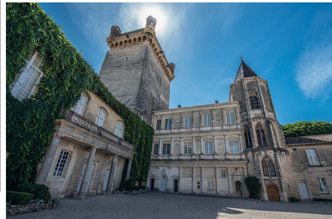
Il ducato di Uzès e la Torre Bermonde