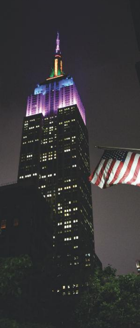
Empire State Building

A New York c'è sempre una storia da raccontare, infinite storie da raccontare. Il suo eclettismo verticale, la sua foresta di skyscraper, oggi ha epigoni globali che vanno da Dubai all'estremo Oriente, i record non ci sono più ma l'anima resta inimitabile. Le storie, le infinite storie di Nyc, continuano ad alimentarsi col nuovo che irrompe sulla scena, perché c'è sempre qualcosa che accade, qualcuno che arriva, una rivoluzione urbana dietro l'angolo, economica o artistica, sociale o gastronomica, ineguagliabile approdo metropolitano per i trendsetter di moda, finanza, design, cinema e teatro. Tanta roba, tutto sotto lo stesso cielo. Ma il nuovo ha fatto la storia perché tutto è sempre stato nuovo, a partire dall'architettura. A New York City non ci sono solo i grattacieli, ma anche i primi grattacieli, solo qua possiamo ammirare Empire State e Chrysler , building per antonomasia. Ma 'sotto di loro' ci sono il Greenwich e Harlem , il Bronx e Chinatown , Brooklyn e Chelsea , luoghi di cinema e di romanzi, di immigrazione e di cultura che è stata (e sarà sempre) avanguardia permanente, di delitti efferati e di smisurate fortune. Questa è l'America bellezza. Questa è la capitale del mondo. E vale un viaggio, qualche volta 'il viaggio'. Lo vale anche se è diventata costosissima, anche se le auto di Time Square vanno di clacson come in India, anche se la sua metropolitana è un rebus non sempre decifrabile. A New York trovano pieno alloggio tutti gli aggettivi, che si