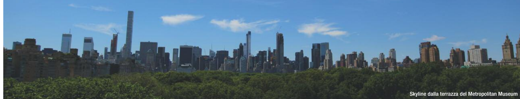
Skyline dalla terrazza del Metropolitan Museum

A New York c'è sempre una storia da raccontare, infinite storie da raccontare. Il suo eclettismo verticale, la sua foresta di skyscraper, oggi ha epigoni globali che vanno da Dubai all'estremo Oriente, i record non ci sono più ma l'anima resta inimitabile. Le storie, le infinite storie di Nyc, continuano ad alimentarsi col nuovo che irrompe sulla scena, perché c'è sempre qualcosa che accade, qualcuno che arriva, una rivoluzione urbana dietro l'angolo, economica o artistica, sociale o gastronomica, ineguagliabile approdo metropolitano per i trendsetter di moda, finanza, design, cinema e teatro. Tanta roba, tutto sotto lo stesso cielo. Ma il nuovo ha fatto la storia perché tutto è sempre stato nuovo, a partire dall'architettura. A New York City non ci sono solo i grattacieli, ma anche i primi grattacieli, solo qua possiamo ammirare Empire State e Chrysler , building per antonomasia. Ma 'sotto di loro' ci sono il Greenwich e Harlem , il Bronx e Chinatown , Brooklyn e Chelsea , luoghi di cinema e di romanzi, di immigrazione e di cultura che è stata (e sarà sempre) avanguardia permanente, di delitti efferati e di smisurate fortune. Questa è l'America bellezza. Questa è la capitale del mondo. E vale un viaggio, qualche volta 'il viaggio'. Lo vale anche se è diventata costosissima, anche se le auto di Time Square vanno di clacson come in India, anche se la sua metropolitana è un rebus non sempre decifrabile. A New York trovano pieno alloggio tutti gli aggettivi, che si