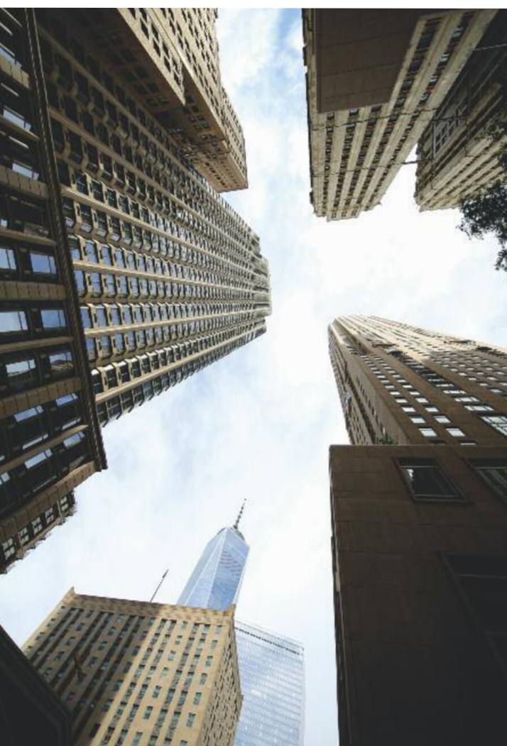
Skyline di Manhattan