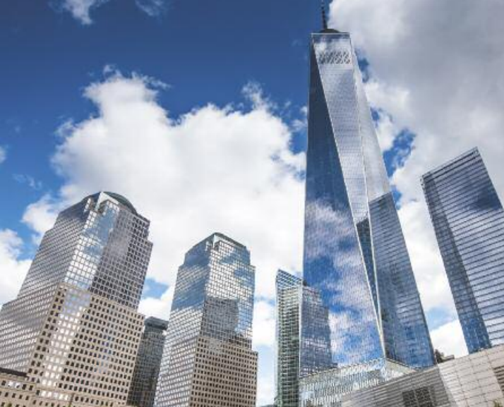
One World Trade Center