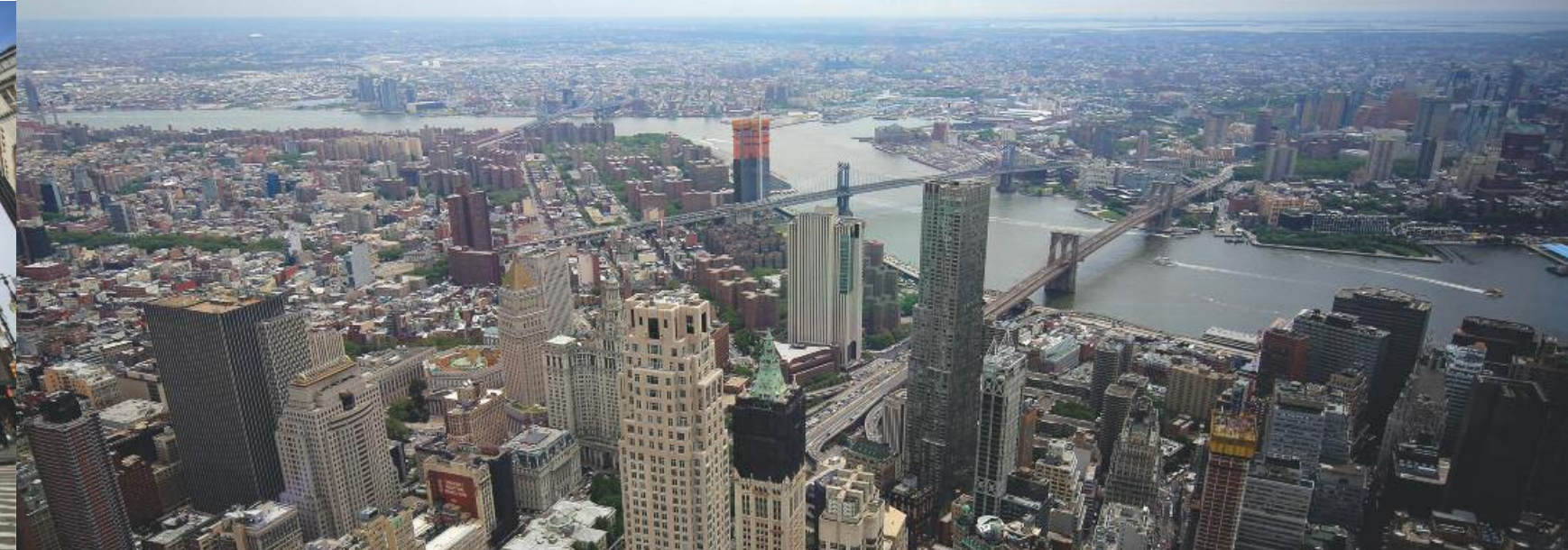
Vista dall'One World Observatory

hattan, partendo dall'isola verde e disabitata si arriva alla skyline contemporanea. Sbarcati in cima – nel One World Observatory – il colpo d'occhio spazia sull'intera New York e nessun grattacielo manca all'appello. Unica assente, l'ebbrezza dell'aria sulla pelle, nonostante la limpidezza delle vetrate. Per quel tipo di emozione il 'grande vecchio' Empire State non teme ancora confronti. Fin qui l'orgoglio, ma quel lembo di Manhattan non poteva sottrarsi alla dolorosa memoria dell'11 settembre, al commovente ricordo delle vittime dell'attentato. Negli esatti spazi dove sorgevano le Torri Gemelle oggi si trovano le due Memorial Pool , grandi vasche a specchio irrorate da una cascata perenne che scende dai bordi; intorno, incisi, i nomi di coloro che persero la vita. Concepite da Michael Arad e Peter Walker , sono un tributo semplice quanto maestoso. A pochi metri di distanza si scende nel museo. L'elemento più impressionante è la collocazione: a metà strada tra le vasche, l'allestimento è posizionato sotto i due piloni portanti della North Tower , iconici cimeli del devastante attentato. Varcato il padiglione d'ingresso il percorso propone 10300 oggetti che raccontano la giornata fatale; in più video, ricostruzioni accurate, voci e suoni che danno i brividi. A Downtown, in poche centinaia di metri quadrati, New York espone – con perfetta sintesi – audacia di vedute, fierezza e rispetto della propria memoria.