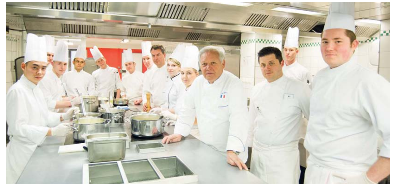
In alto a sinistra: i cuochi di Vonnas Sopra: il ristorante tristellato di Vonnas In basso: Georges Blanc in cucina con il suo team

minano Vonnas. Ma Georges non si ferma e crea il Village Blanc: una macchina dei sapori con almeno una vittima predestinata (l'imprescindibile poulet de Bresse) e tante, tantissime attività: il ristorante tristellato, un hotel a cinque stelle, un altro a tre, un ristorante che propone la copia conforme della prima 'Maison Blanc' del 1872, una spa e, ancora, un relais per feste ed eventi, una boulangerie/épicerie e persino un cinema. Agguerriti come militari al fronte, gli chef segnano il paesaggio spostandosi da un luogo all'altro, a voi resta solo il piacere della scelta. Per un giorno, o un soggiorno, a Vonnas ogni gourmand si sente monarca del proprio sogno. >>>