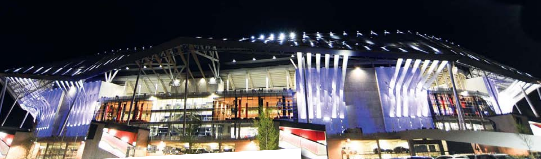
I colori della notte al Parc Olympique Lyonnais