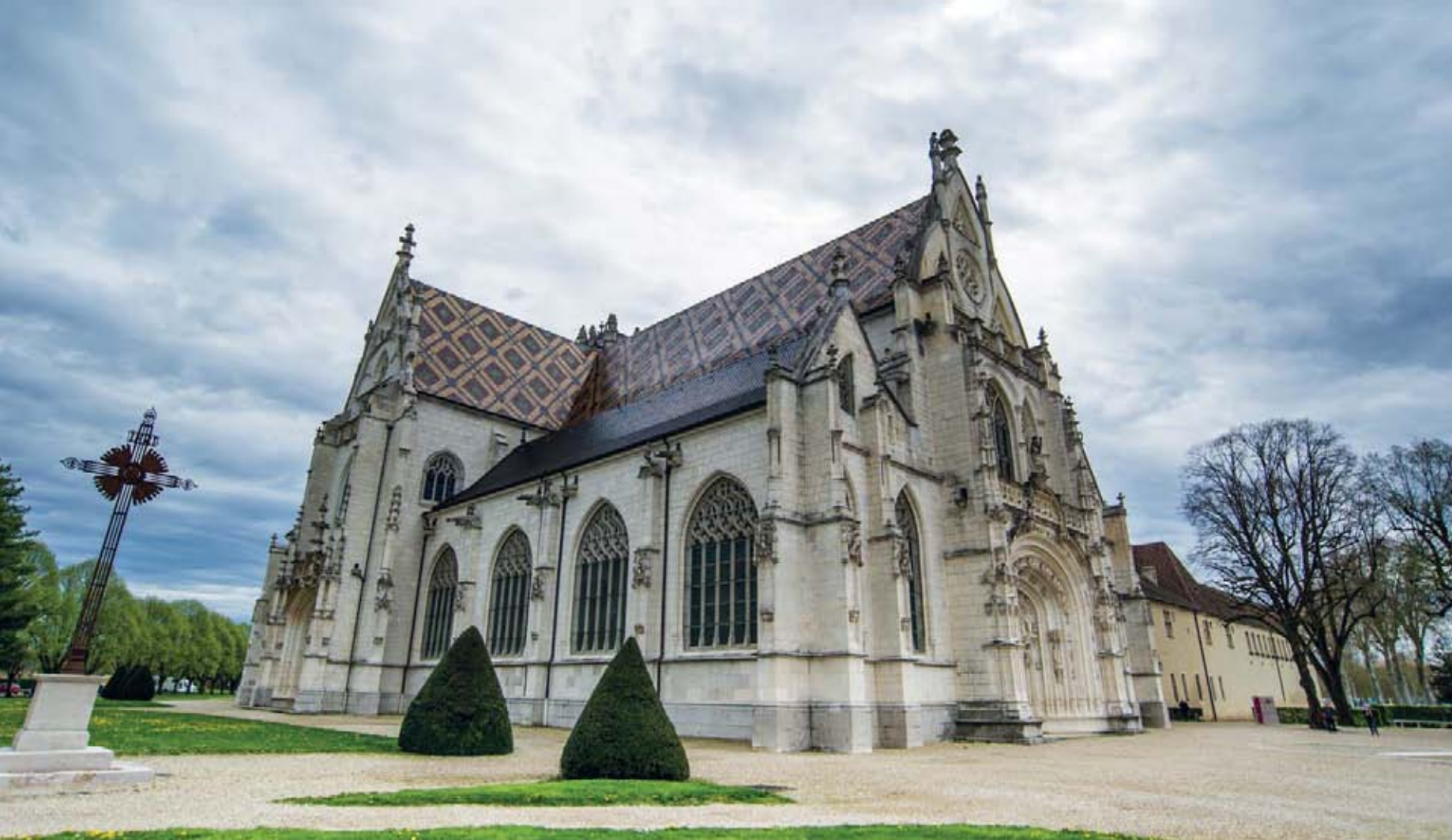
Il Monastero Reale di Brou a Bourg-en-Bresse