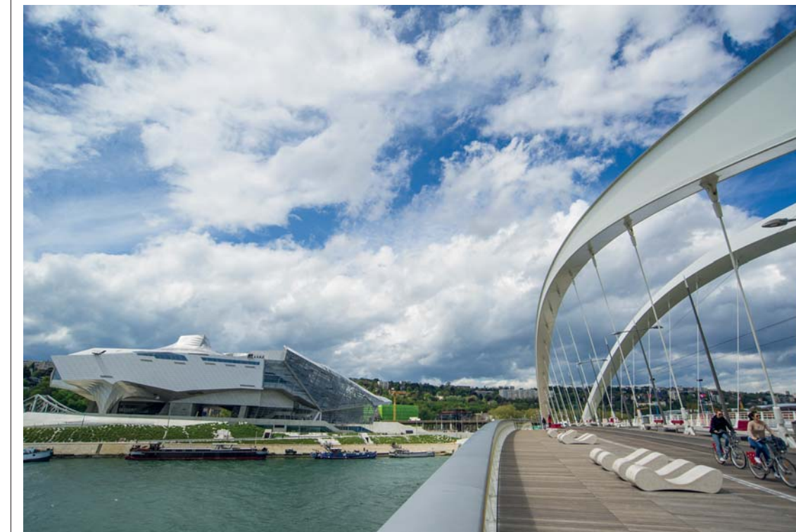
Il Musée des Confluences

Il Musée des Confluences interroga la Terra sin dalle sue origini e l'umanità sulla sua storia e la sua geografia