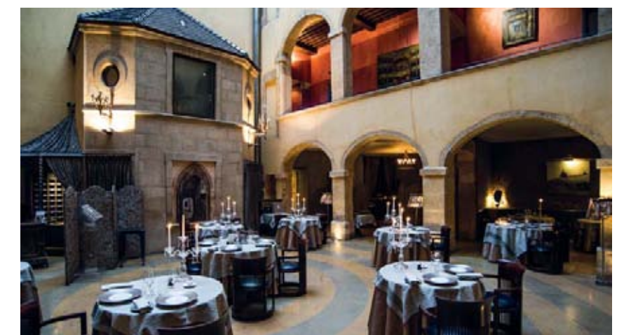
Il Cour Les Loges