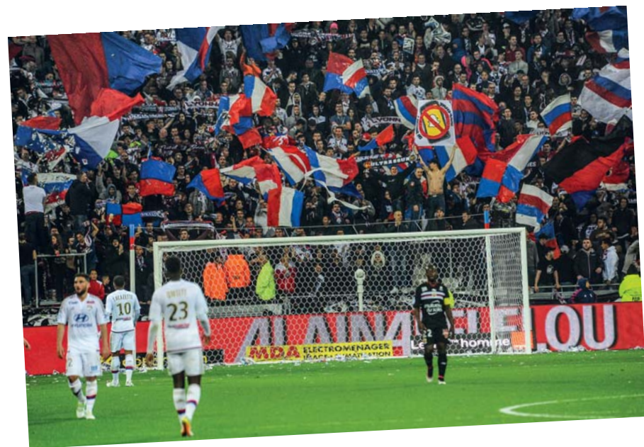
Il Parc Olympique Lyonnais