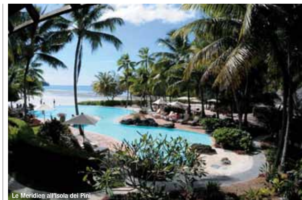
Le Meridien all'Isola dei Pini