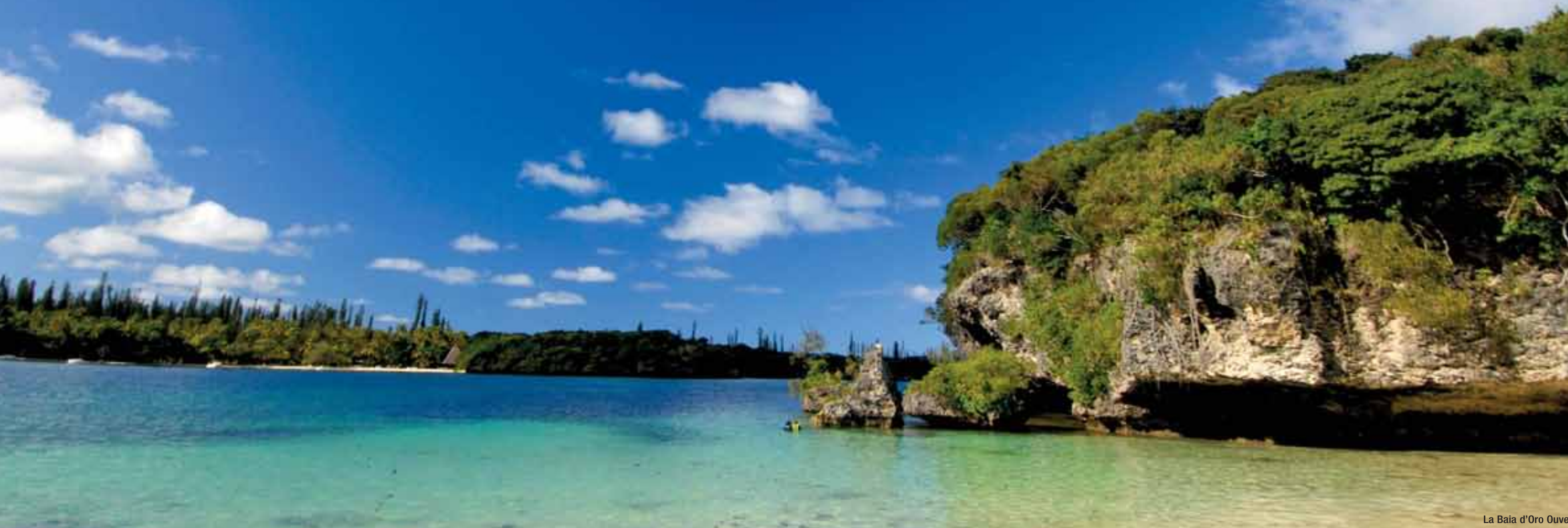
La Baia d'Oro Ouvea

Un viaggio dall'altra parte del mondo, nell'arcipelago dove le donne hanno sempre un fiore tra i capelli, dove un italiano ha concepito il capolavoro dell'architettura contemporanea, dove si ammira il più grande atollo del mondo e la natura conserva i pini della preistoria. Nei Mari del Sud, a venticinque ore di volo, per respirare emozioni senza confini