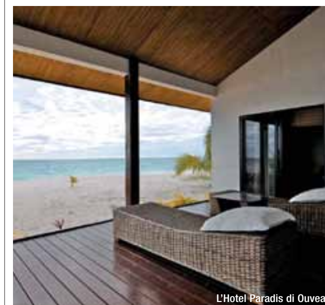
L'Hotel Paradis di Ouvéa