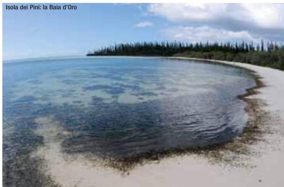
Isola dei Pini: la Baia d'Oro