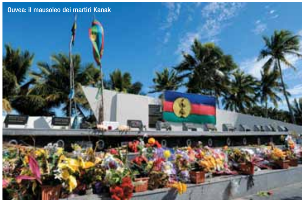
Ouvéa: il mausoleo dei martiri Kanak