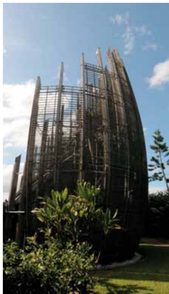
Il centro culturale Tijbaou progettato da Renzo Piano