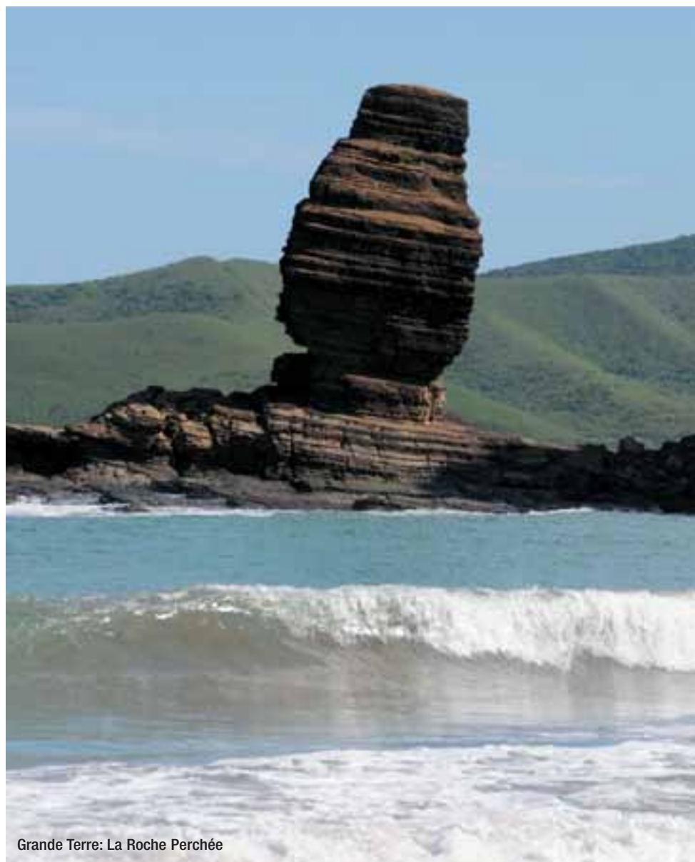
Grande Terre: La Roche Perchée