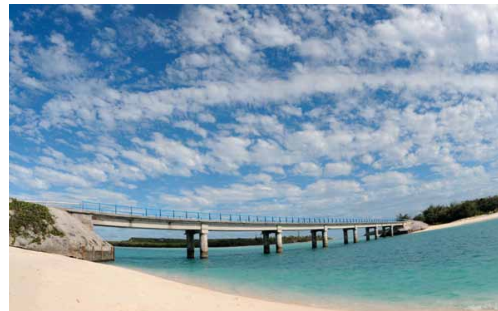
Sotto: Ouvea, il ponte sulla laguna