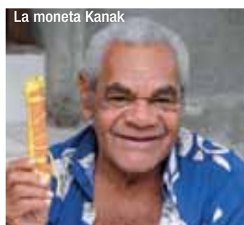
La moneta Kanak

na, dove le suggestioni tropicali si confrontano con l'alba dei tempi. In queste isole vivono 2500 delle 3400 piante presenti sul pianeta. Un esempio eclatante sono le Araucariaceae (progenitrici di tutti gli alberi e soprattutto dei pini), su 19 specie conosciute ben 16 crescono in Nuova Caledonia. Sono alberi molto simili ai loro antenati del Giurassico, e vantano una carta d'identità dove la data di nascita è ferma a 195 milioni di anni fa. Le loro forme eleganti e verticali svettavano già nei frammenti alla