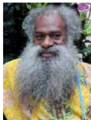
Il capo della tribù Wadrilà a Ouvea

chiedere ed ottenere. In una civiltà 'orale', che non si è mai tramandata con la scrittura, gestualità e linguaggio rappresentano la base delle relazioni sociali. Relazioni sociali che per secoli non hanno contemplato il denaro come elemento di scambio. Nei mercati e nelle tribù contava solo il baratto e l'unica moneta – la moneta Kanak (una pergamena realizzata con filamenti di cocco e contenente piccoli e rari oggetti rituali) – serviva solo per stringere alleanze o matrimoni; aveva, ed ha tuttora, un valore puramente simbolico che dipende dal tempo necessario a realizzarla, almeno due giorni di lavoro... Nella cultura melanesiana la 'morte è un rito di passaggio', il paradiso non è in cielo ma sotto l'oceano, e 'gli antenati camminano al nostro fianco per indicarci la strada'. Ogni gesto, ogni oggetto, ogni pianta ha un suo preciso significato all'insegna di un animismo ortodosso e fantasioso: non ci può essere un'abitazione moderna senza aver vicino una casa tradizionale (la 'case'); le tombe, i luoghi interdetti ed i posti dove ci si reca a far visita sono ornati da un lembo di pareo multicolore; le donne hanno sempre un fiore tra i capelli; tutti salutano tutti per la strada; la terra non