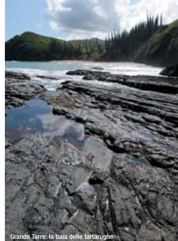
Grande Terre: la baia delle tartarughe