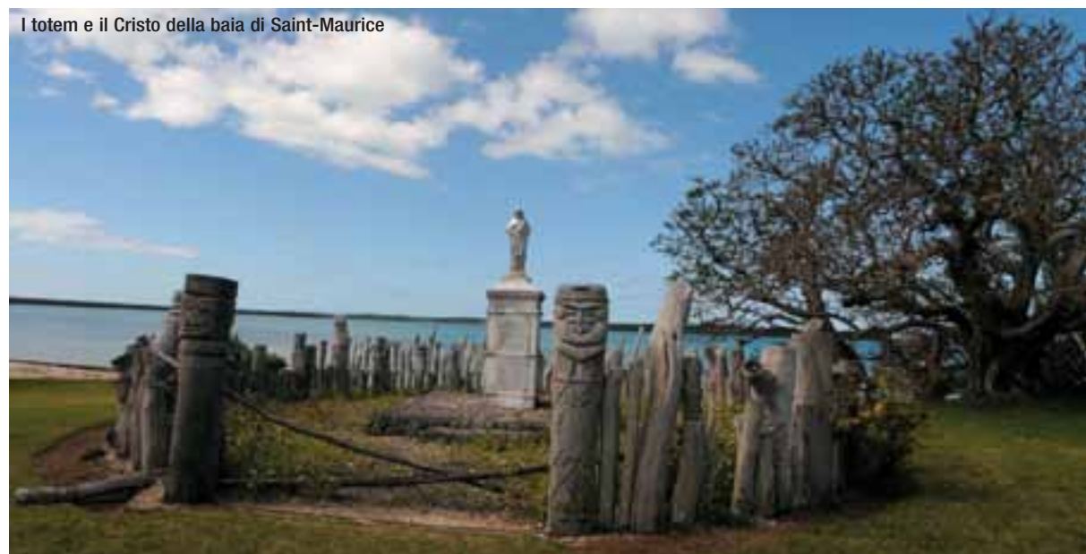
I totem e il Cristo della baia di Saint-Maurice

si può vendere ma solo donare; ci sono alberi femmina, il cocco, ed altri maschi, il pino; ci sono alberi magici, il Buynj, ed altri imponenti, come il Bagnan, dove viene sepolto il capo; gli antenati e gli dei sono membri a pieno titolo della società ed ogni manufatto ha un'anima, una vita propria e simbolica. Nel cuore dei mari del Sud un popolo ai confini del mondo preserva il dono di una terra primitiva e bellissima; sembra un sogno, forse un'utopia, ma quell'universo di riti e segreti piace al sole ed agli dei del mare che ci permettono – dopo 25 ore di volo – un rispettoso affacciarci sull'ultima Pandora, la Nuova Caledonia. ▷▷