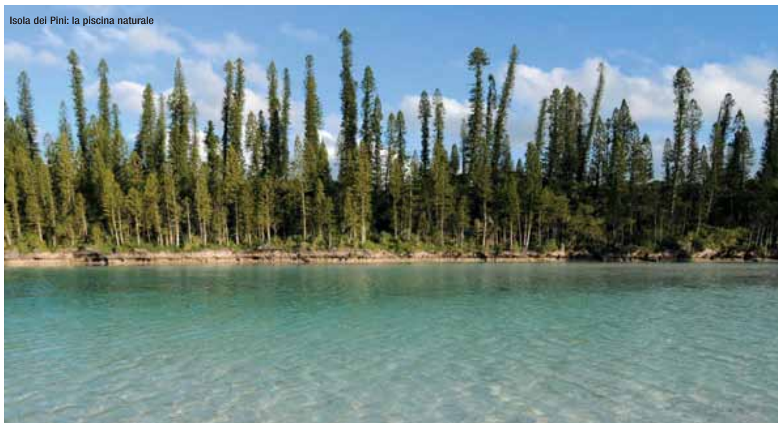
Isola dei Pini: la piscina naturale